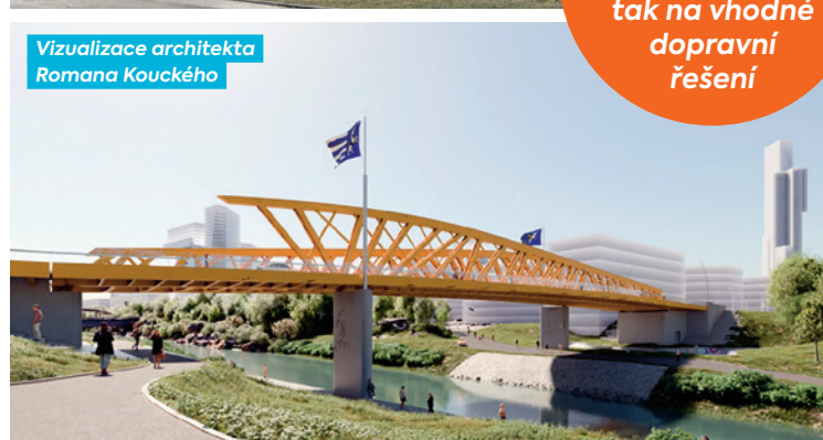
Vizualizace architekta Romana Kouckého

Projekt nového mostu klade důraz jak na estetiku, tak na vhodné dopravní řešení