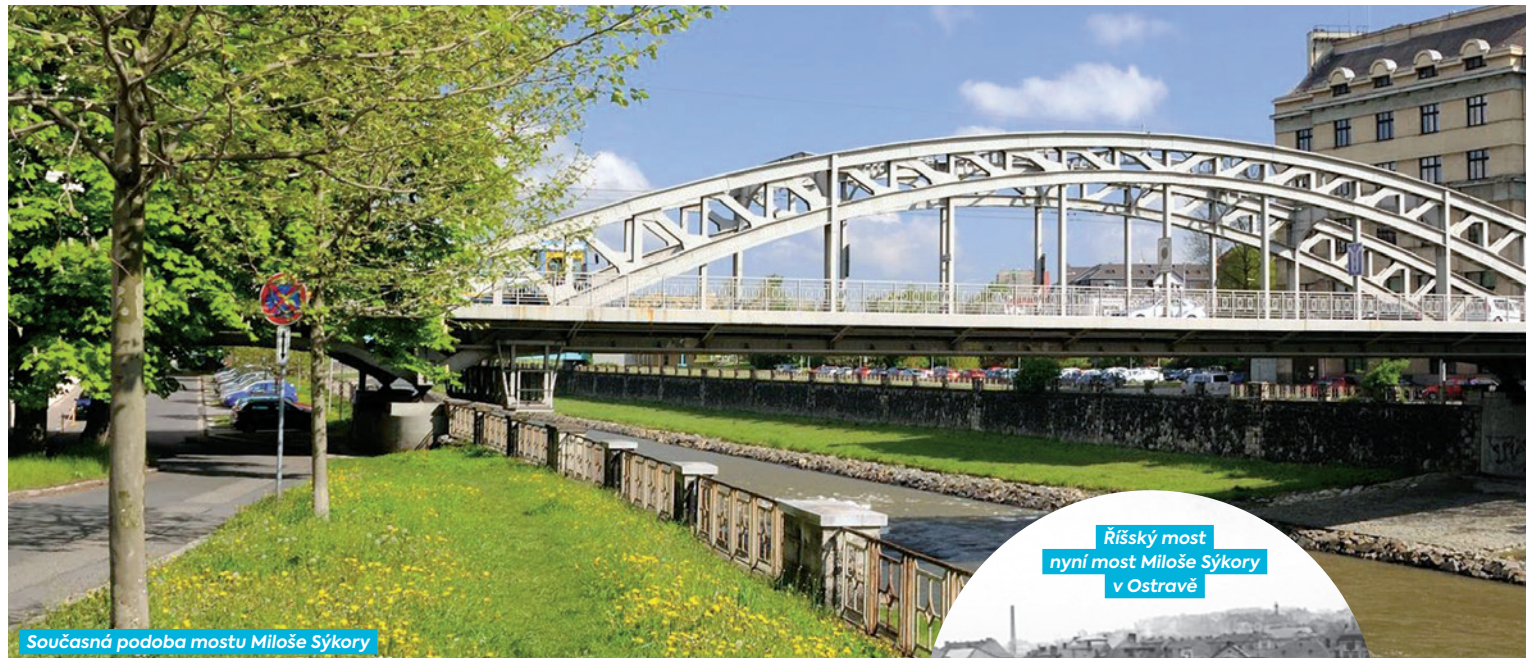
Současná podoba mostu Miloše Sýkory