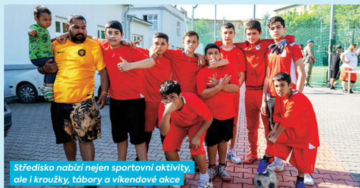
Středisko nabízí nejen sportovní aktivity, ale i kroužky, tábory a víkendové akce