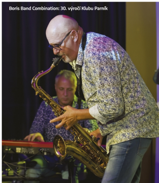
Boris Band Combination: 30. výročí Klubu Parník