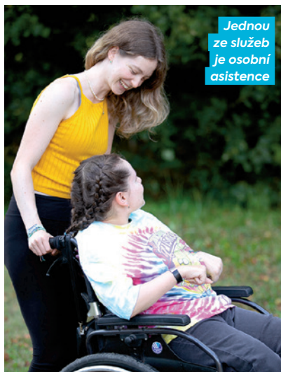
Jednou ze služeb je osobní asistence