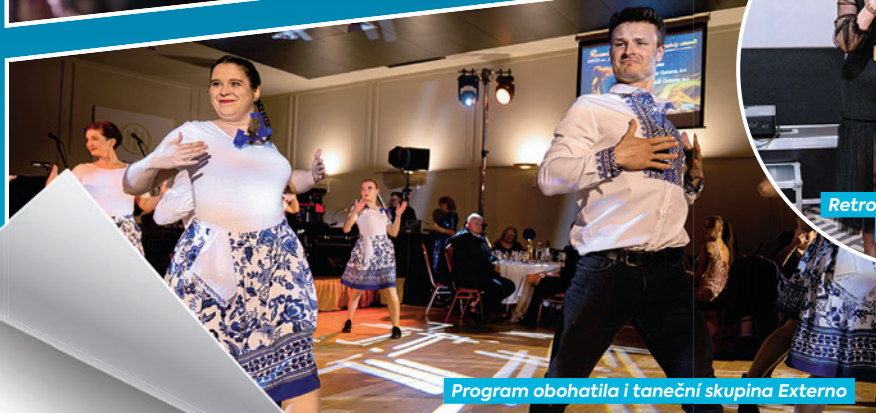
Program obohatila i taneční skupina Externo