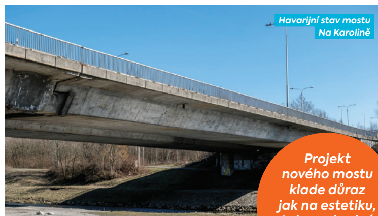
Havarijný stav mostu Na Karolině

Nový most nahradí dvě konstrukce jedním kompaktním objektem, bude užší a kratší než stávající soumostí, zlepší bezpečnost a plynulost dopravy, nově nabídne kvalitní propojení také pro pěší i cyklisty a podpoří rozvoj území Karoliny a nábřeží Ostravice. Součástí stavby je rovněž úprava navazujících komunikací v délce přibližně 600 metrů, přestavba tří křižovatek, včetně přeměny dvou z nich na okružní, vybudování nových komunikací pro pěší a cyklisty, dešťové kanalizace a veřejného osvětlení.