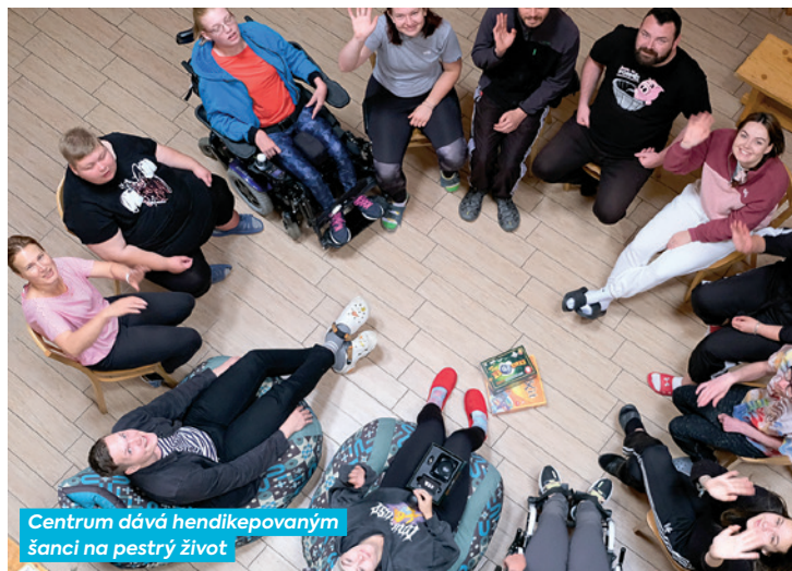
Centrum dává hendikepovaným šanci na pestrý život