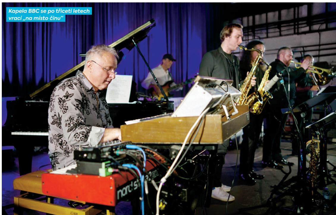
Kapela BBC se po třiceti letech vrací „na místo činu“