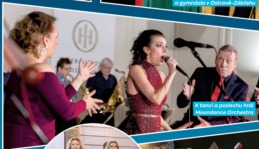
K tanci a poslechu hrál Moondance Orchestra