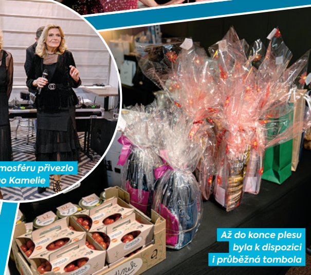
Až do konce plesu byla k dispozici i průběžná tombola