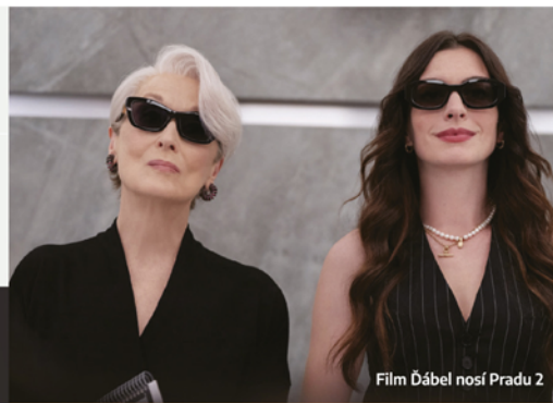
Film Ďábel nosí Pradu 2