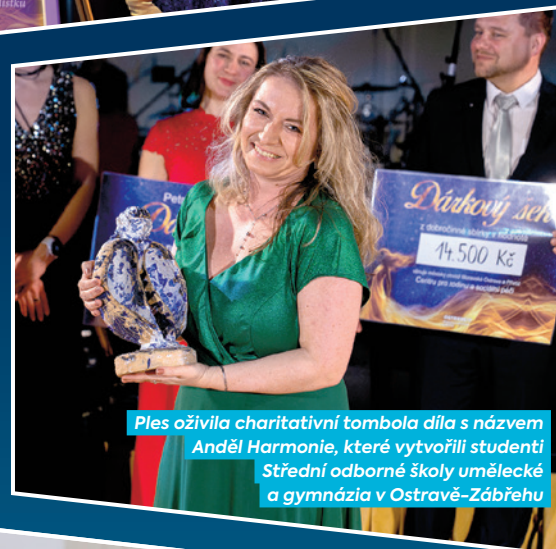
Ples oživila charitativní tombola díla s názvem Anděl Harmonie, které vytvořili studenti Střední odborné školy umělecké a gymnázia v Ostravě-Zábřehu