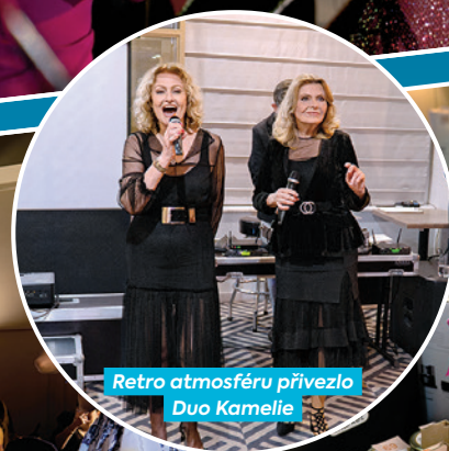
Retro atmosféru přivezlo Duo Kamelle