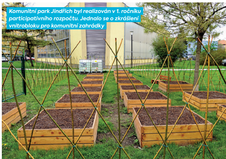
Komunitní park Jindřich byl realizován v 1. ročníku participativního rozpočtu. Jednalo se o zkrášlení vnitrobloku pro komunitní zahrádky

„Oba projekty, jak Adoptuj plácek, tak Živé vnitrobloky, mají sloužit ke zkrášlení okolí bydliště občanů našeho obvodu. V obou případech musí být koncepce výsadby schválena správcem veřejné zeleně a žadatel je povinen zajistit adekvátní péči o vysazené rostliny.“