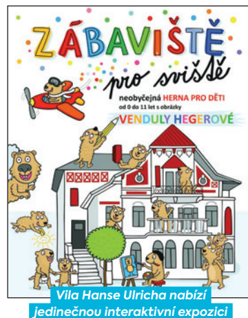
Vila Hanse Ulricha nabízí jedinečnou interaktivní expozici

Zábaviště pro sviště je otevřeno od pondělí do pátku (14:00 až 17:00 hodin), v sobotu a neděli od 11:00 do 18:00 hodin. Vstupné činí 70 korun, senioři, studenti