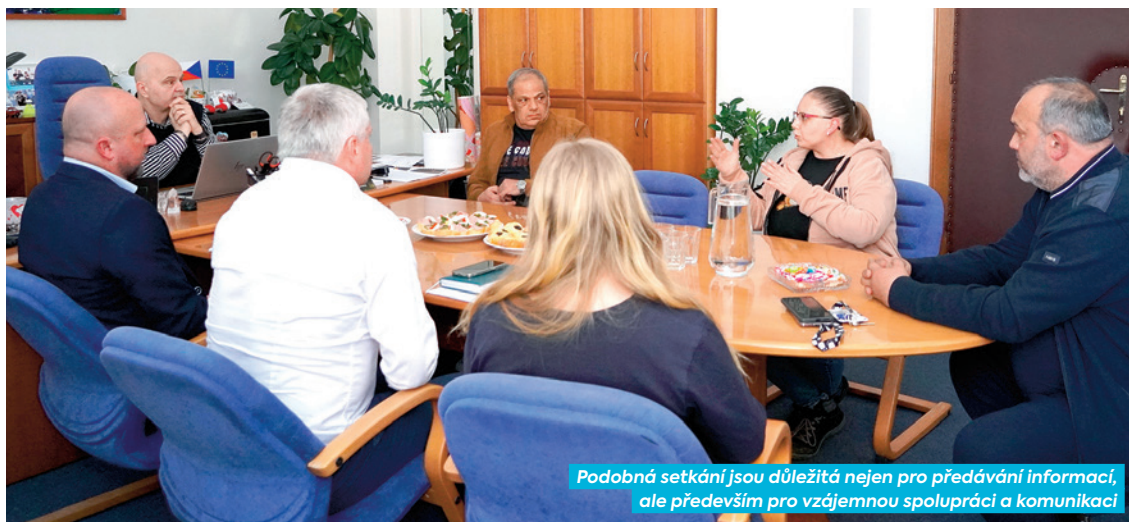
Podobná setkání jsou důležitá nejen pro předávání informací, ale především pro vzájemnou spolupráci a komunikaci

V současné době působí v našem obvodu 22 domovníků v 52 domech s obecními byty