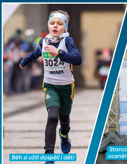
Běh si užili dospělí i děti