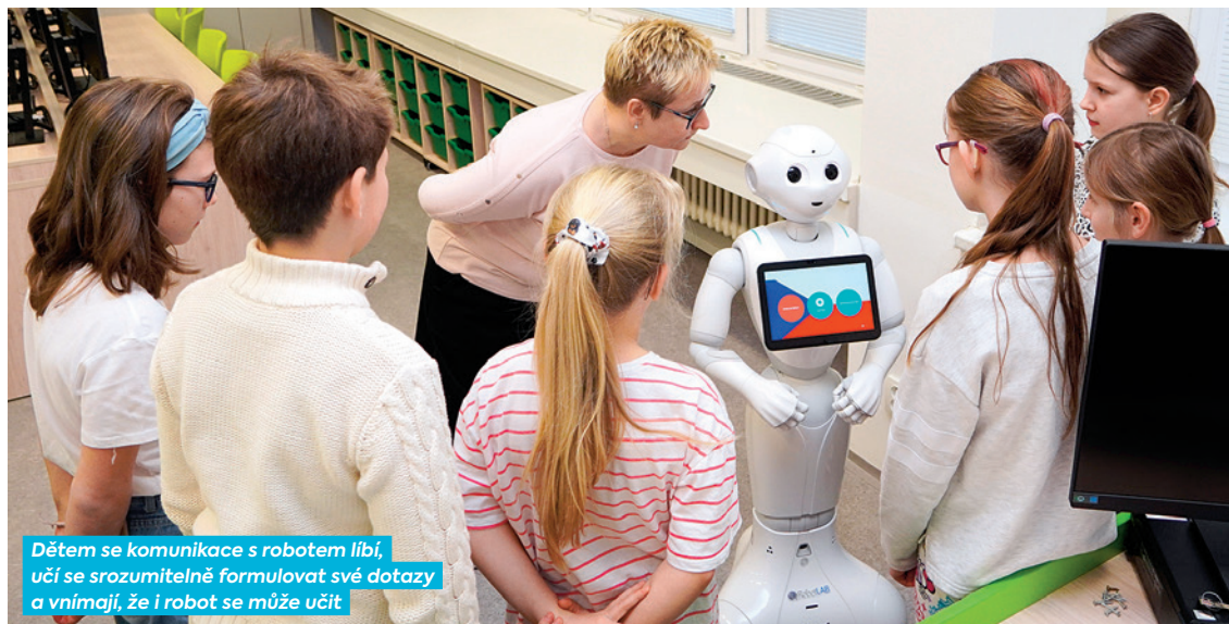
Dětem se komunikace s robotem líbí, učí se srozumitelně formulovat své dotazy a vnímají, že i robot se může učit