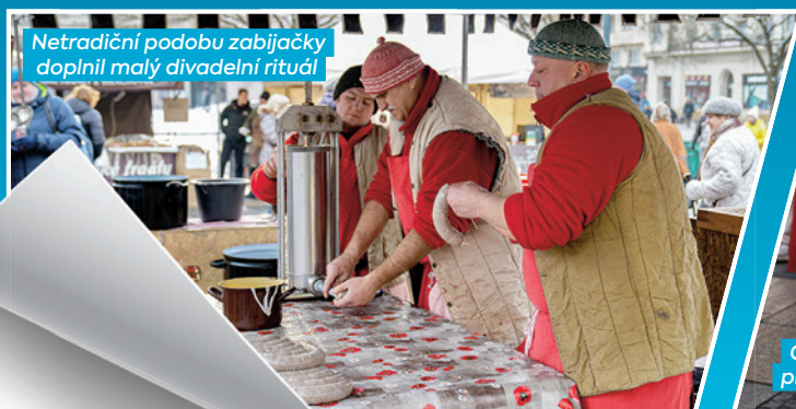
Netradiční podobu zabijačky doplnil malý divadelní rituál