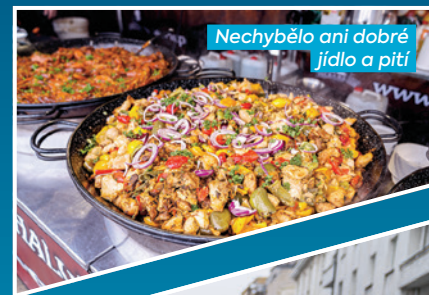
Nechybělo ani dobré jídlo a pití