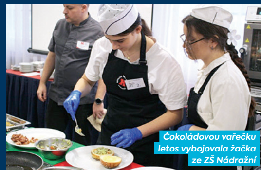
Čokoládovou vařečku letos vybojovala žačka ze ZŠ Nádražní

svého pokrmu, ale i precizním zpracováním a estetickou prezentací. Její vítězný pokrm nesl název: Portobello hamburger s gratinovaným sýrem s modrou plísní, doplněný batátovými hranolky a medově hořčičnou omáčkou.