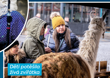
Děti potěšila živá zvířátka