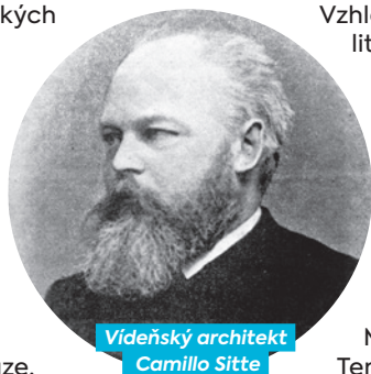
Videňský architekt Camillo Sitte

Camillo Sitte chápal město jako umělecké dílo a dokázal Přívoz postavit na úroveň tehdejších evropských měst. Navrhnul centrum Přívozu jako soubor uzavřených domovních bloků kolem prostorného náměstí a hlavní dopravní tepny vedoucí k tehdejší Severní Ferdinandově dráze. Dominantou se stal kostel Neposkvrněného početí