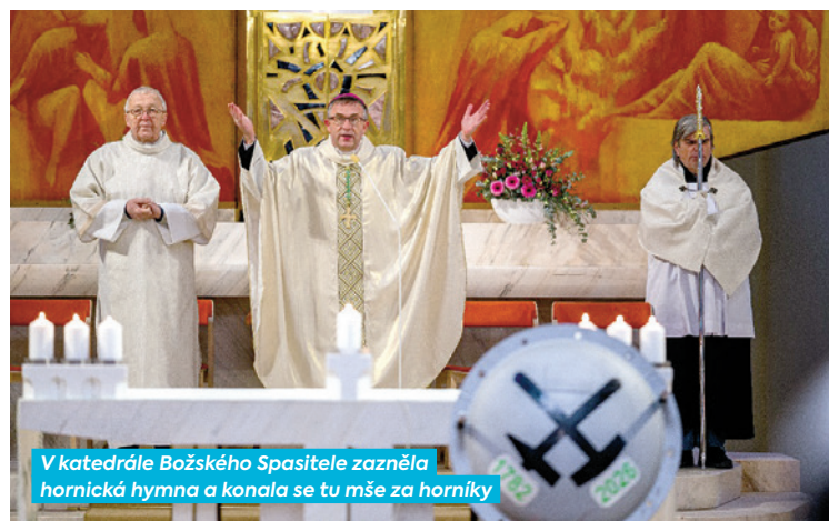
V katedrále Božského Spasitele zazněla hornická hymna a konala se tu mše za horníky