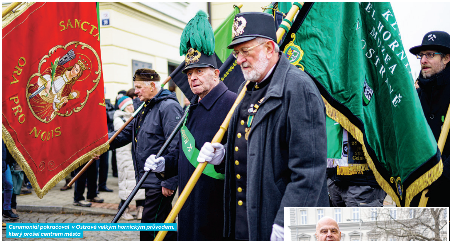
Ceremoniál pokračoval v Ostravě velkým hornickým průvodem, který prošel centrem města