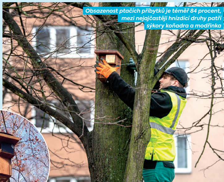
Obsazenost ptačích příbytků je téměř 84 procent, mezi nejčastější hnízdicí druhy patří sýkora koňadra a modřinka

z důvodu nevhovujícího stavu vyměněny. Celková obsazenost ptačích