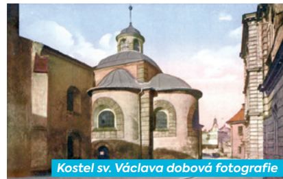
Kostel sv. Václava dobová fotografie