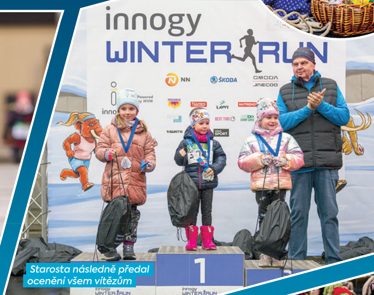
Starosta následně předal ocenění všem vítězům