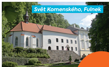
Svět Komenského, Fulnek

Druhý letošní zájezd pro seniory s tématem Po stopách Komenského a Jednoty bratrské se uskuteční 16. dubna. Těšit se můžete na komentovanou vyjížďku s historikem Tomášem Majlíšem.