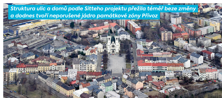
Struktura ulic a domů podle Sitteho projektu přežila téměř beze změny a dodnes tvoří neporušené jádro památkové zóny Přívoz

Stavba měst podle uměleckých zásad. Především jeho zásluhou byly položeny základy moderního urbanismu uplatňující se až do současnosti.