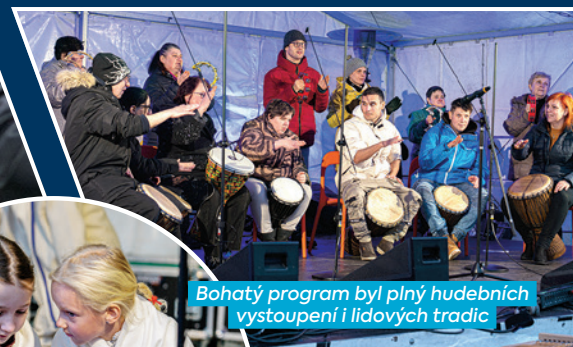
Bohatý program byl plný hudebních vystoupení i lidových tradic