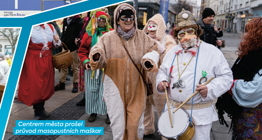
Centrem města prošel průvod masopustních maškar