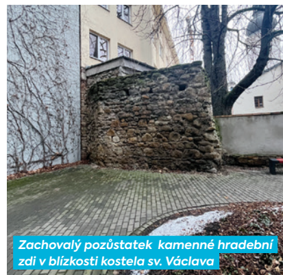
Zachovalý pozůstatek kamenné hradební zdi v blízkosti kostela sv. Václava

Dnešní historické centrum Ostravy bylo v 2. polovině 14. století obkrouženo městským opevněním. Většina opevnění byla zbořena v letech 1780–1833, kdy ztratilo obranný význam. Dodnes se dochoval už jen malý pozůstatek kamenné zdi vysoký asi čtyři metry. Zeď můžete najít v prostoru u kostela sv. Václava před domem Ostravská brána. V tom místě také stála jedna ze tří bran, které byly součástí hradeb, brána Kostelní, která sloužila pro přístup do města od mostu přes Ostravici z Polské Ostravy. Archeologický výzkum v místech před Kostelní branou odhalil, že zde ve středověku probíhal vodní příkop. Další brána, Horní či Hrabovská, stála v místech, kde se dnes kříží ulice 28. října s ulicí Puchmajerovou. Brána Přívozská byla u Jiráskova náměstí.