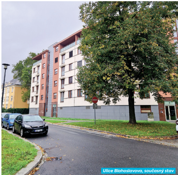
Ulice Blahoslavova, současný stav

Od března má začít rekonstrukce oboustranných chodníků podél ulice Blahoslavova od slepého konce až k ulici Sadové. Náklady jsou 4, 4 milionu Kč.