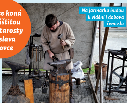
Na jarmarku budou k vidění i dobová řemesla

Tradiční oslava Dne české státnosti nabídne bohatý program pro děti i dospělé spojené s jarmarkem, jehož cílem je co nejvěrohodněji