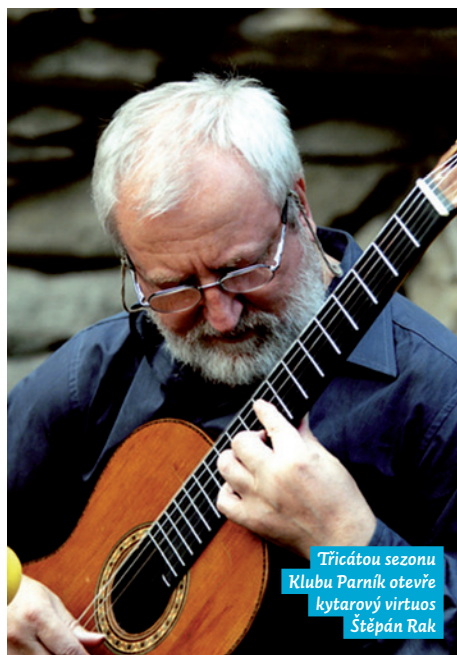
Třicátou sezону Klubu Parník otevře kytarový virtuos Štěpán Rak

P ro letošní jubilejní sezonu chystá klub opět něco výjimečného. Oslava jeho třicátin bude totiž zároveň poctou významnému hudebníkovi a kytarovému virtuosovi světového formátu Štěpánu Rakovi, který letos slaví 80. narozeniny. Výjimečný slavnostní večer s názvem „Co čert chtěl a anděl zachránil,“ nabídne 12. září od 18:00 hodin nejen koncert jubilanta, ale také osobní vzpomínky, povídání ze života a gratulace hostů. Návštěvníky čeká večer plný emocí, radosti a hudby, která přesahuje hranice žánrů i generací.