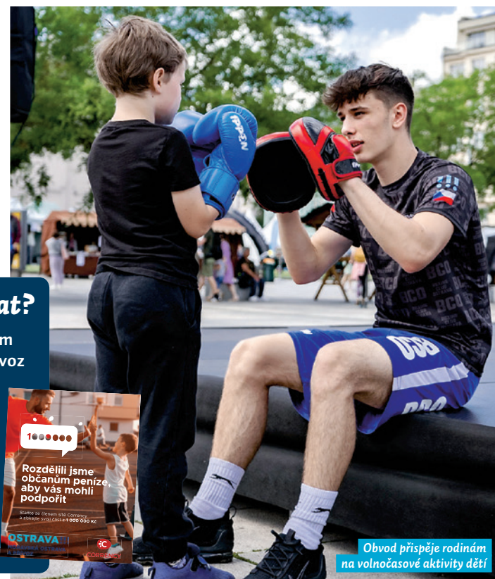
Obvod přispěje rodinám na volnočasové aktivity dětí

Jste ostravská organizace, která nabízí zájmové aktivity pro děti a mládež? Zaregistrujte se na stránkách moap.corrency.cz !