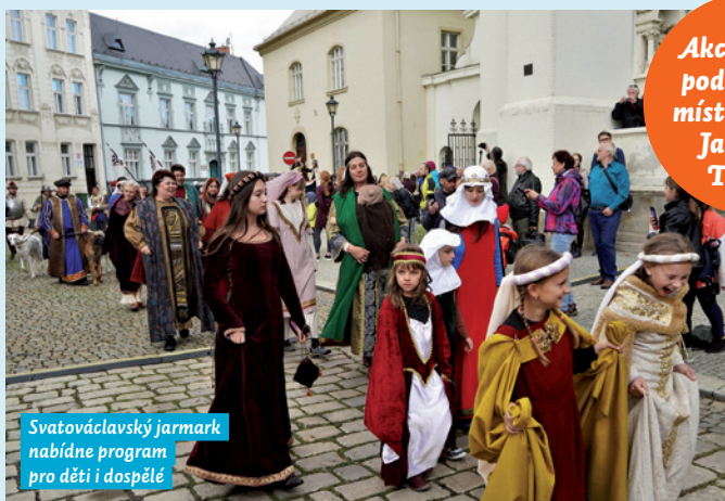
Svatováclavský jarmark nabídne program pro děti i dospělé

Akce se koná pod záštitou místostarosty Jaroslava Trnovce