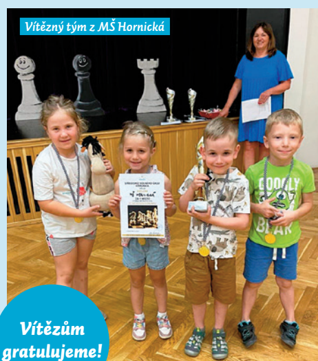
Vítězný tým z MŠ Hornická

i strategického myšlení. Učí je také samostatnosti v rozhodování, dává jim prostor pro práci s chybou i uměním prohrávat.