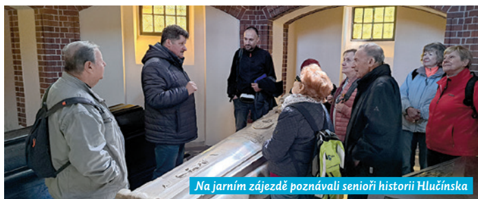
Na jarním zájezdu poznávali seniory historii Hlučinska