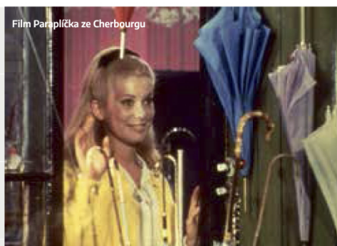
Film Paraplíčka ze Cherbourgu