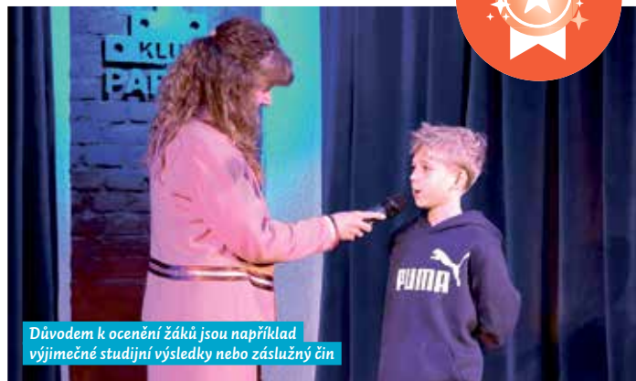
Důvodem k ocenění žáků jsou například výjimečné studijní výsledky nebo záslužný čin