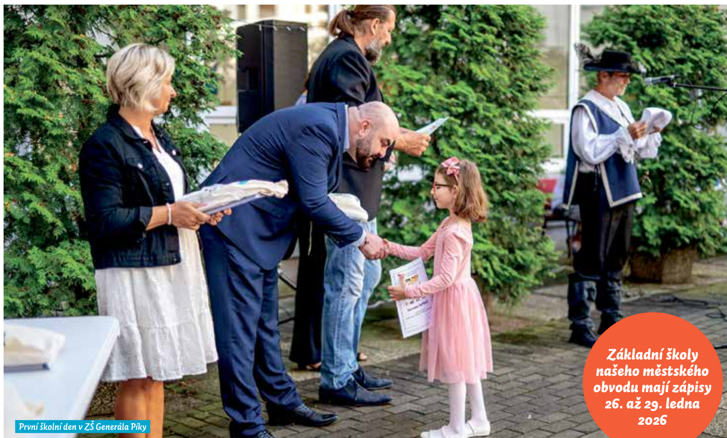
První školní den v ZŠ Generála Píky

Základní školy našeho městského obvodu mají zápisy 26. až 29. ledna 2026