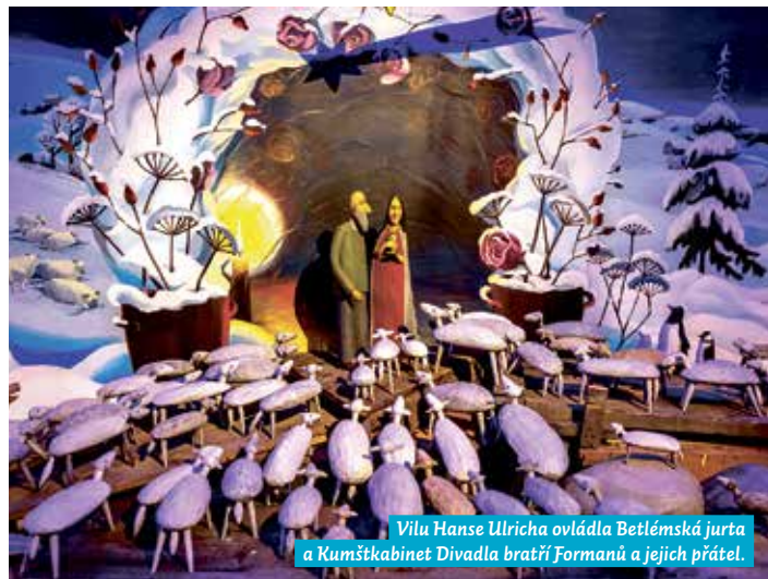
Vila Hanse Ulricha ovládla Betlémská jurta a Kumštškabinet Divadla bratří Formanů a jejich přátel.

Prostory Vily Hanse Ulricha na Sokolské třídě se už v listopadu proměnily v místo plné vánoční poezie díky interaktivní expozici Betlémská jurta Divadla bratří Formanů a jejich přátel. Součástí výstavy je také unikátní hravá expozice Kumštškabinet, nad kte-