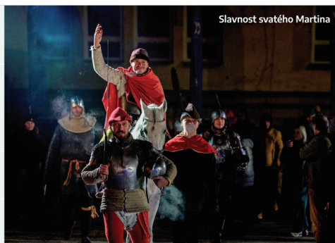
Slavnost svatého Martina