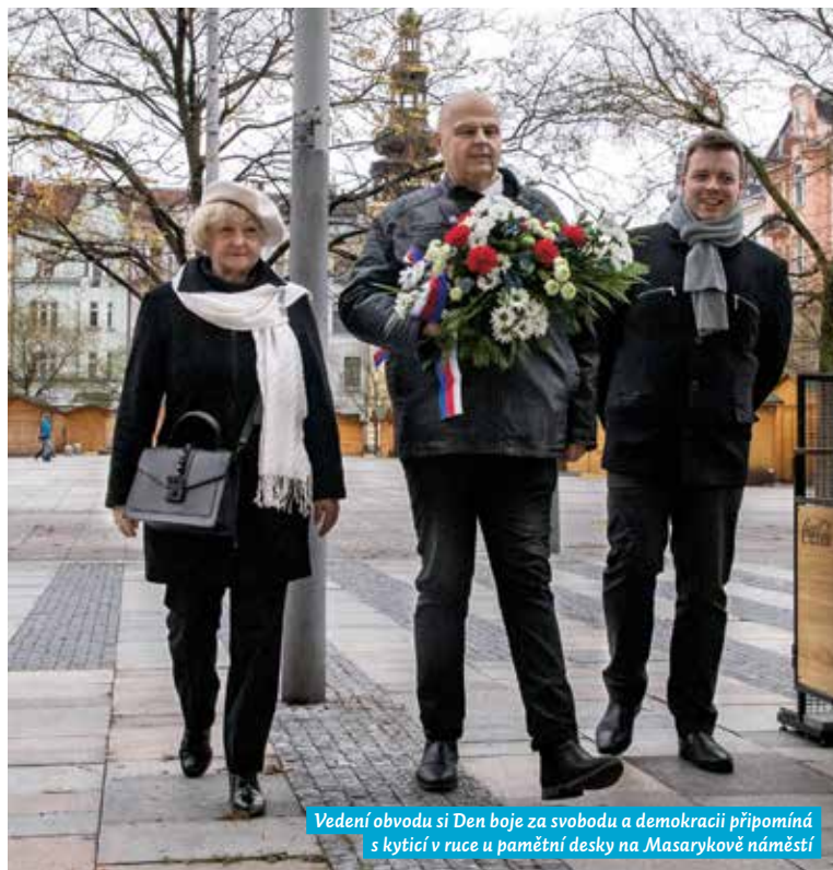
Vedení obvodu si Den boje za svobodu a demokracii připomíná s kyticí v ruce u pamětní desky na Masarykově náměstí