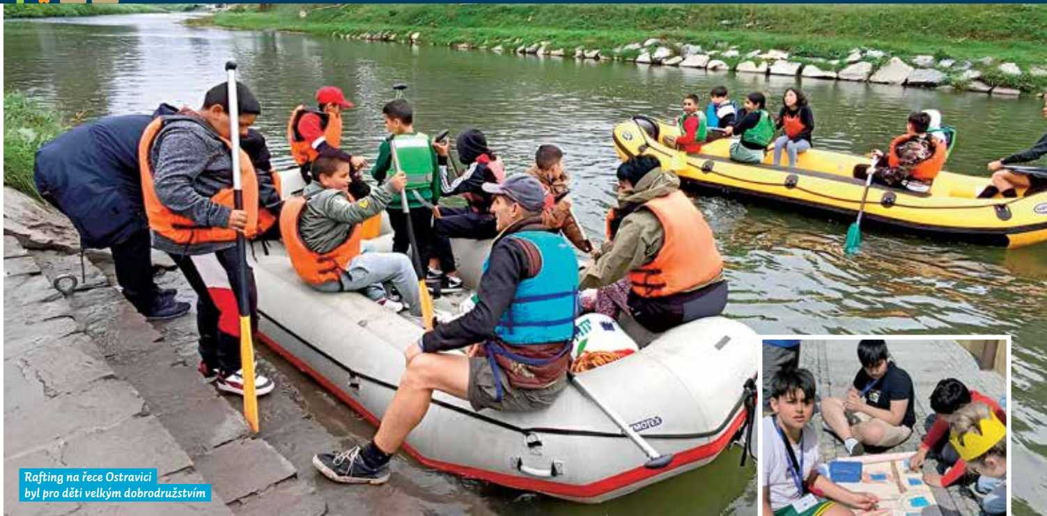
Rafting na řece Ostravici byl pro děti velkým dobrodružstvím