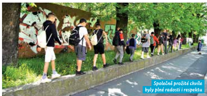
Společně prožité chvíle byly plné radosti i respektu