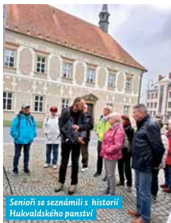
Senioři se seznámili s historií Hukvaldského panství

V říjnu naši senioři objevovali zajímavosti Hukvaldského panství, poslední letošní zájezd se koná 20. listopadu a cílem je Velehrad. Šest zájezdů absolvují senioři i v roce 2026, z toho dva budou opět doprovázeni