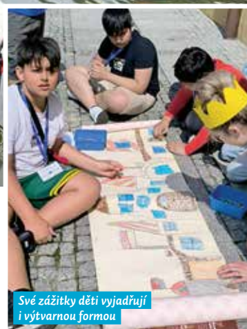
Své zážitky děti vyjadřují i výtvarnou formou

V září se konala 7. klíčová aktivita s názvem Rafting, Landek. V rámci ní se žáci seznámili s atrakcemi v příhraničí. Aktivita byla zahájena plavbou na raftech, kdy si děti vyzkoušely sjet část řeky Ostravice. Poté je čekala komentovaná prohlídka hornického muzea Landek.