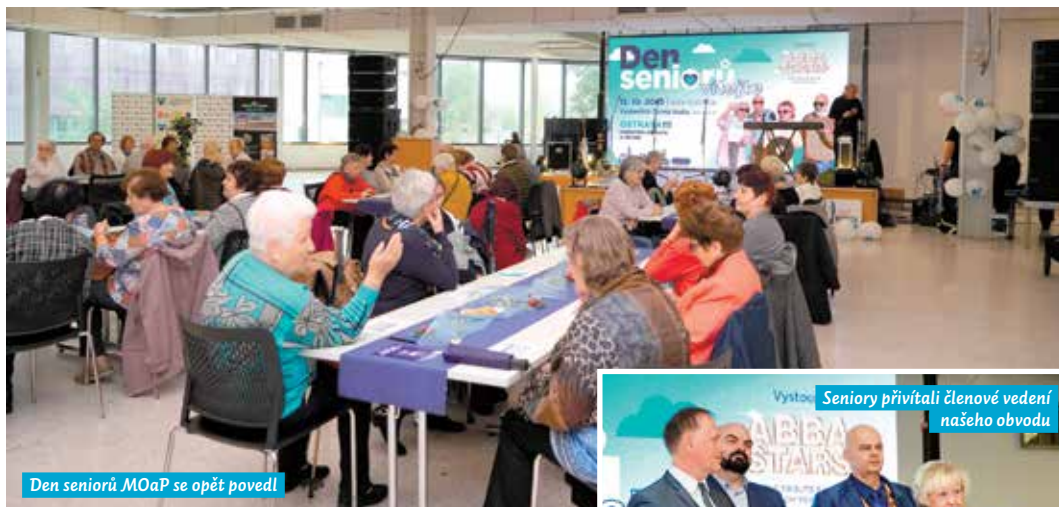
Den seniorů MOaP se opět povedl

V našem obvodě se koná řada oblíbených a zajímavých akcí. Pojdme si připomenout události, které jsme si už naplno užili a které nás ještě čekají.