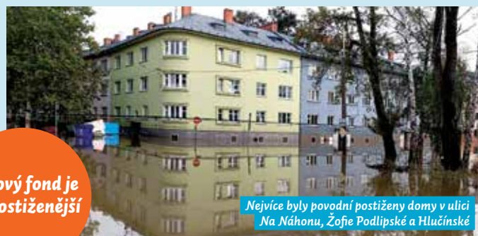
Nejvíce byly povodní postiženy domy v ulici Na Náhonu, Žofie Podlipské a Hlučinské

domů a úklid veřejného prostranství, odstranění bahna ze sklepů domů, poškozené kotelny a strojovny výtahů,