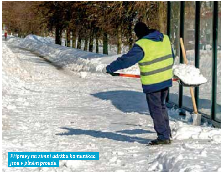
Přípravy na zimní údržbu komunikací jsou v plném proudu