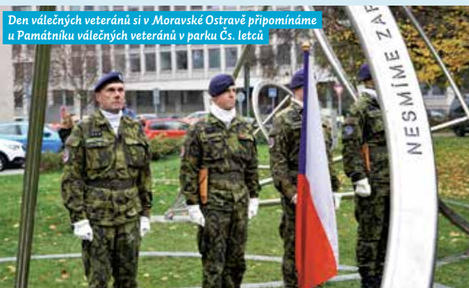
Den válečných veteránů si v Moravské Ostravě připomínáme u Památníku válečných veteránů v parku Čs. letců

památník, který byl odhalen před 3 lety, připomíná všechny válečné veterány, kteří nasazují život v zahraničních misích v boji za svobodu a demokracii.