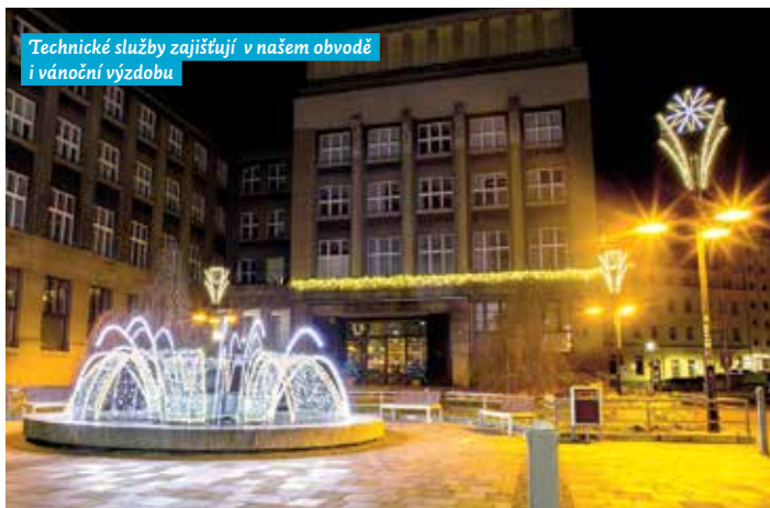
Technické služby zajišťují v našem obvodu i vánoční výzdobu