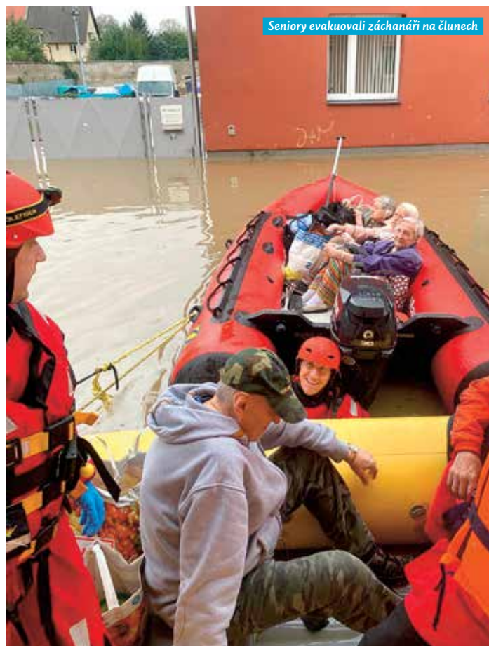
Seniory evakuovali záchranníři na člunech

„Když se ve vzpomínkách vrátím k situaci před rokem, vyvstanou mi na myslí hlavně lidé, kteří během povodně pomáhali. Evakuaci řídily záchranné složky, kterým patří náš dík. Díky jejich profesionálnímu a velmi lidskému zásahu naštěstí nedošlo ke zdravotním újmám obyvatel DPS. Hodně nám pomohli i příslušníci vězeňské služby a vězni z heřmanické věznice, kteří uklízeli přívozké ulice. Povodeň totiž nejvíce postihla Přívoz, kde se vylila voda kvůli protržení hráze. Dnes je hráz na soutoku Odry s Opavou již opravena a zpevněna. Město pracuje na tom, aby se odolnost těchto staveb během velké vody zvýšila.“