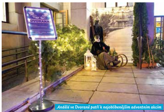
Andělé ve Dvoraně patří k nejoblíbenějším adventním akcím

A všichni se už nemůžeme dočkat 4. ročníku naší krásné adventní akce Andělé ve Dvoraně, která se koná 6. 12., 15:30 – 20:30. Opět nás čeká andělský program plný hudebních vystoupení, přátelských setkání, vánočních zvyků i ochutnávek. Podrobný program najdete na str. 16.