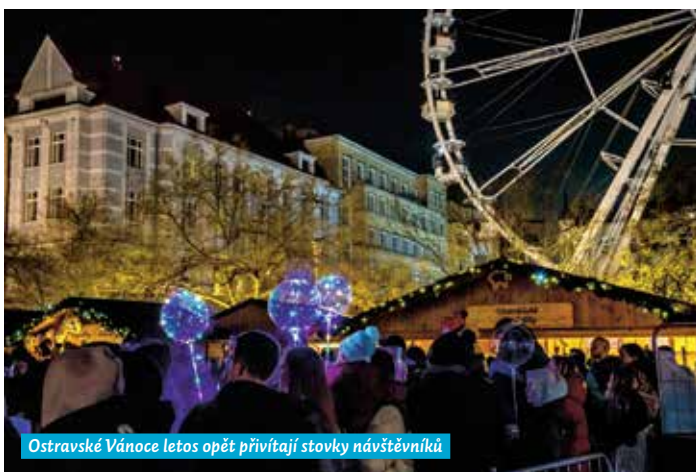
Ostravské Vánoce letos opět přivítají stovky návštěvníků