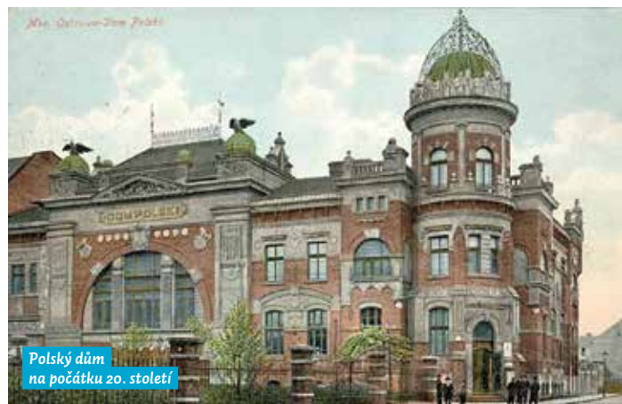
Polský dům na počátku 20. století