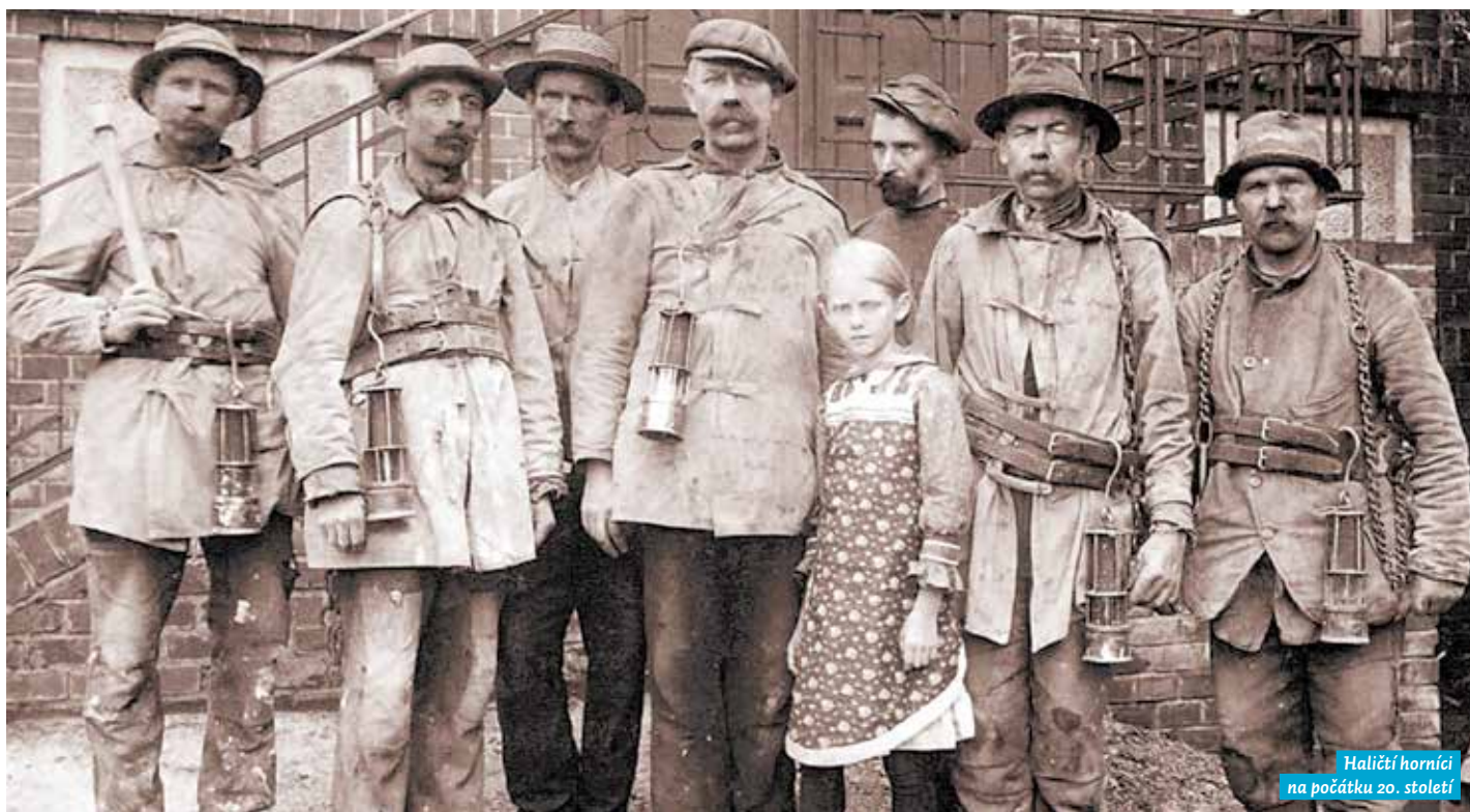
Haličtí horníci na počátku 20. století

Na přelomu října a listopadu se již tradičně konají Polské dny v Ostravě , které se pořádají již od roku 2008. Během přednášek, koncertů, vycházek a mnoha dalších akcí se organizátoři snaží představit polskou kulturu a také minulost a současnost vzájemných česko-polských vztahů. Ostrava je pro konání tohoto festivalu příhodným místem, vždyť její vztahy s Polskem se utvářejí již od středověku.