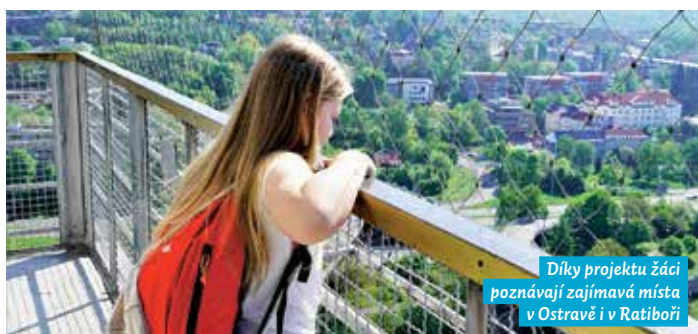
Díky projektu žáci poznávají zajímavá místa v Ostravě i v Ratiboři