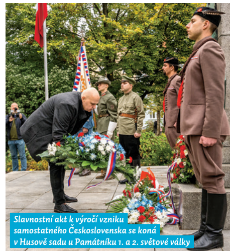
Slavnostní akt k výročí vzniku samostatného Československa se koná v Husově sadu u Památníku 1. a 2. světové války

toto významné výročí připomíná každoročně řadou akcí po celé republice, vrcholem je pak udělování státních vyznamenání na Pražském hradě.