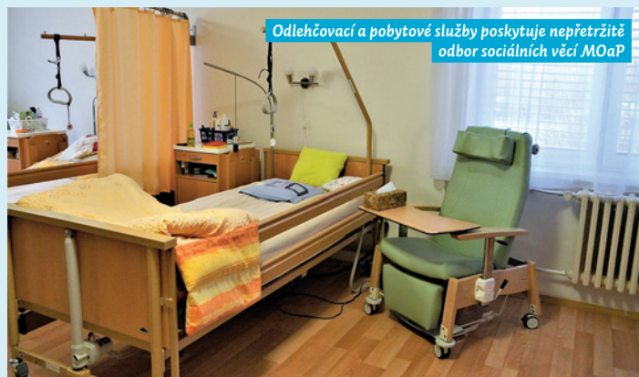
Odehčovací a pobytové služby poskytuje nepřetržitě odbor sociálních věcí MOaP

nižší úhrada činila 13 Kč, nejvyšší 11 573 Kč. Pro klienty je důležitá dosažitelnost sociálních služeb, bytové zázemí a bezpečnost, 95% klientů ohodnotilo naši péči na výbornou, 4% na chvalitebnou a 1% klientů ohodnotilo péči jako dobrou. V roce 2024 jsme získali dotaci Ministerstva práce a sociálních věcí na provozování pečovatelské služby ve výši 3 800 tisíc korun.