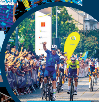
Závodníci povzbuzovali v ulicích města davy nadšených fanoušků