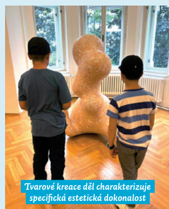
Tvarové kreace děl charakterizuje specifická estetická dokonalost