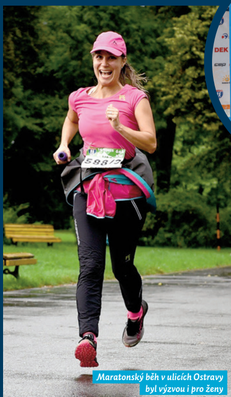
Maratonský běh v ulicích Ostravy byl výzvou i pro ženy