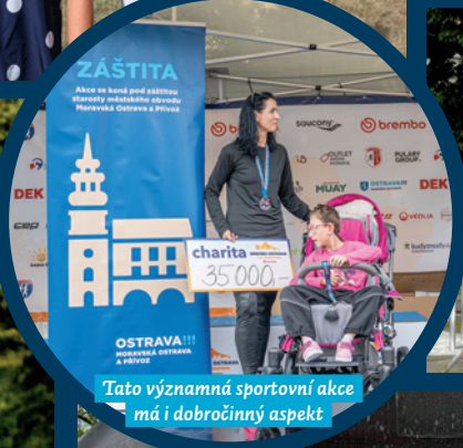
Tato významná sportovní akce má i dobročinný aspekt