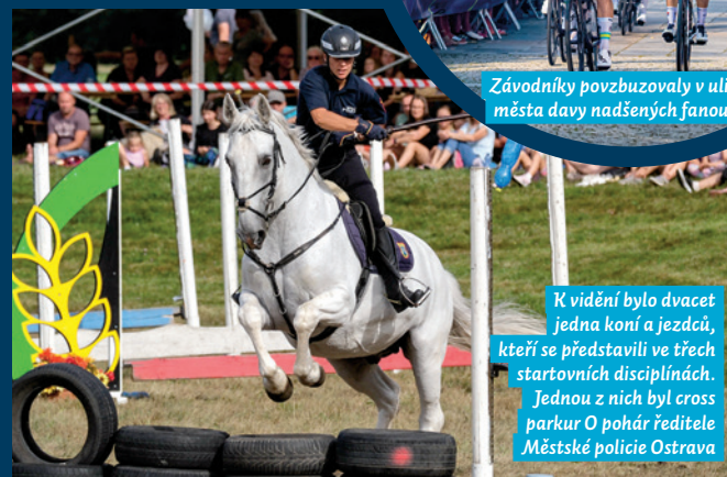
K vidění bylo dvacet jedna koní a jezdců, kteří se představili ve třech startovních disciplínách. Jednou z nich byl cross parkur O pohár ředitele Městské policie Ostrava