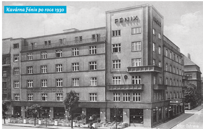
Kavárna Fénix po roce 1930

Výstava Ostravská kavárna se koná pod záštitou starosty MOaP Petra Veselky.