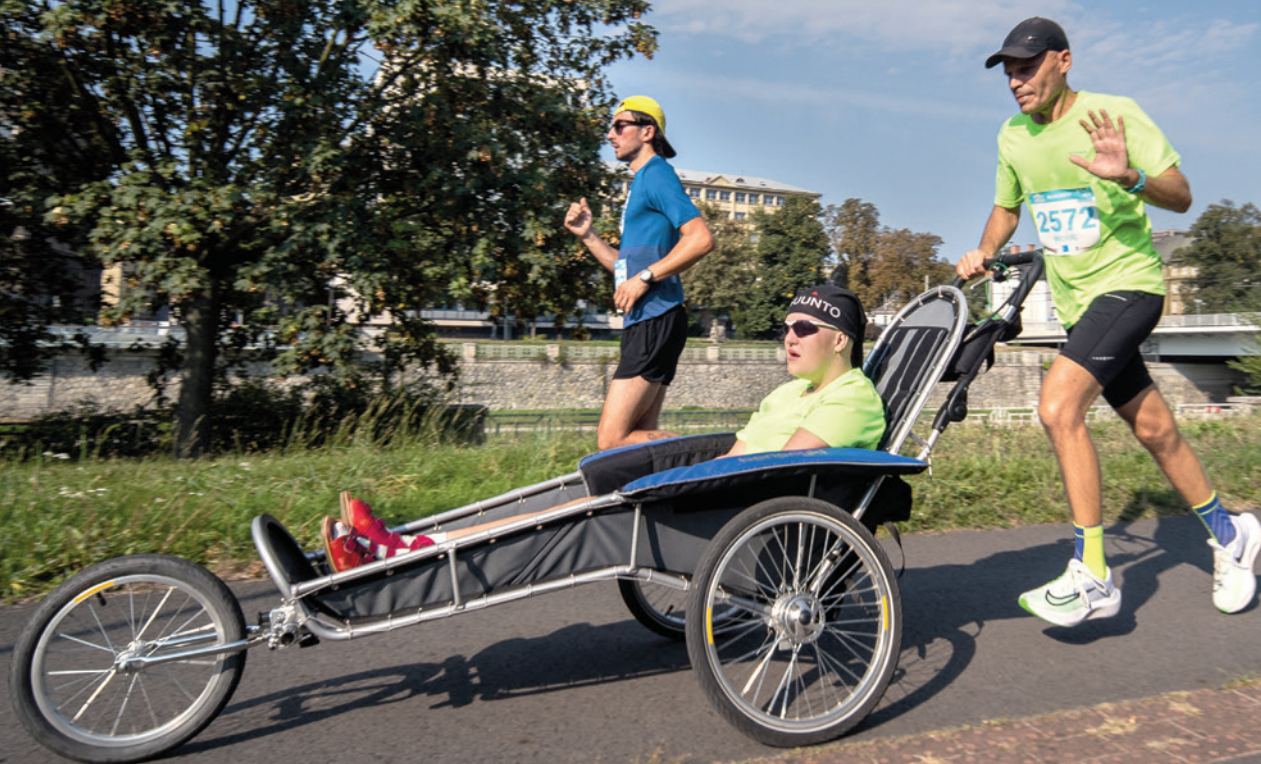
Ostrava City marathon