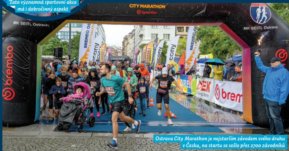
Ostrava City Marathon je nejstarším závodem svého druhu v Česku, na startu se sešlo přes 2700 závodníků