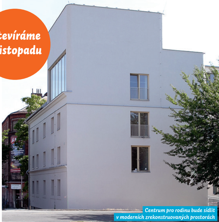
Centrum pro rodinu bude sídlit v moderních zrekonstruovaných prostorách

Věříme, že činnost Centra v našem obvodu bude pro vás přínosem a pomocí.