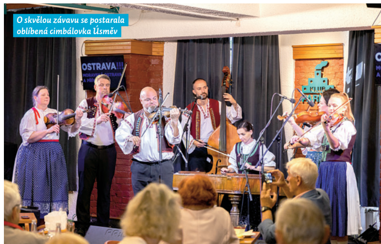
O skvělou zábavu se postarala oblíbená cimbálovka Úsměv

muziky. Její jádro tvoří muzikanti, kteří rádi připomínají, že společně před cimbálem stojí od nejtutějšího dětství, kdy se setkávali a hráli v cimbálových muzikách při základní umělecké škole v Ostravě-Hrabůvce. Svá školní léta zakončili v roce 2012 vítězstvím v národním kole soutěží mladých cimbálových muzik v Mikulově a následně se vydali na samostatnou cestu.