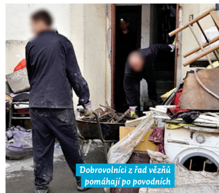
Dobrovolníci z řad vězňů pomáhají po povodních

pohromě trval mnohem déle. Letos 27. září se konala další dobrovolnická akce, tentokrát šlo o spolupráci při kosení trávnickových ploch a likvidaci křídlatky v lokalitě K Trojhalí za obchodním centrem Nová Karolina. Technické služby