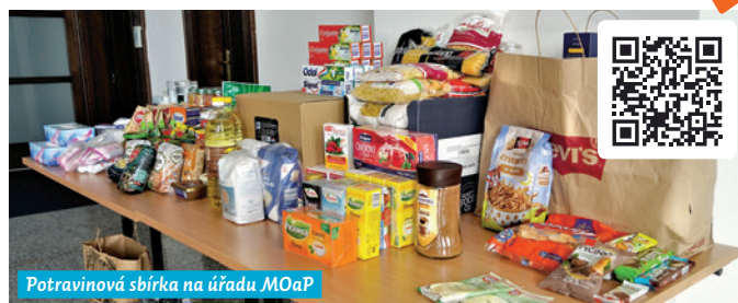
Potravinová sbírka na úřadě MOaP

Sbírka potravin bude probíhat také začátkem listopadu po celém Česku v kamenných i on-line prodejnách. Více na www.sbirkapotravin.cz