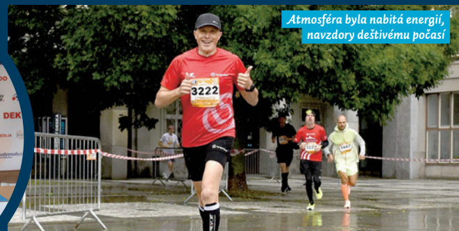
Atmosféra byla nabitá energií, navzdory deštivému počasí