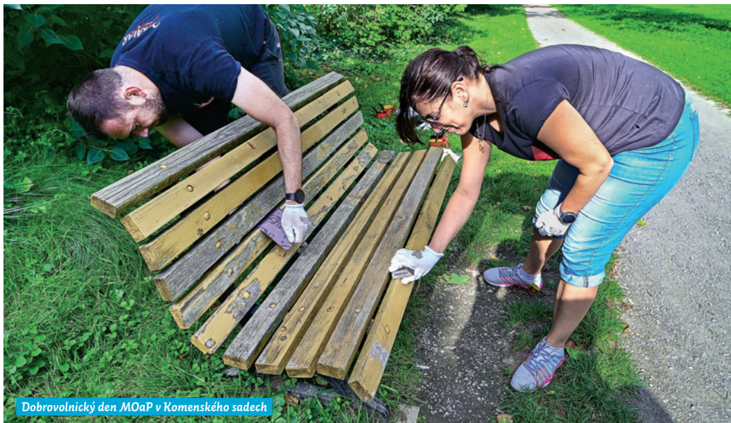
Dobrovolnický den MOaP v Komenského sadech

Radnice Moravské Ostravy a Přívozu každoročně organizuje dobrovolnické aktivity na zvelebení veřejného prostoru. O jaké akce jde, kdo se zapojuje a co se v této souvislosti v našem obvodu děje?