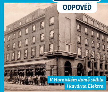
V Hornickém domě sídlila i kavárna Elektra

Werichem. V mezipatře (galerii) byly kromě kavárenských stolů také kulečníky a klubovny. V suterénu se pak nacházel bar Cristall-Pavilon a kabaret. V současné době se v budově nachází banka, hotel a také kavárna. Kino Elektra bylo vedle Vesmíru nejvýznamnějším ostravským premiérovým kinem, beze změny názvu fungovalo do roku 1991, kdy bylo uzavřeno.