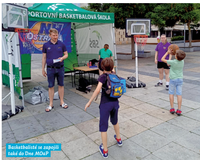
Basketbalisté se zapojili také do Dne MOaP

Od nové sezóny vznikne v Ostravě historicky první Moravskoslezská basketbalová akademie (MS Academy). Cílem tohoto projektu je zajistit nejtalentovanějším basketbalistům regionu top sportovní prostředí a připravit je na profesionální angažmá. Základna basketbalu v Ostravě bude nově ve sportovním areálu Haly mládeže v Gajdošově ulici.