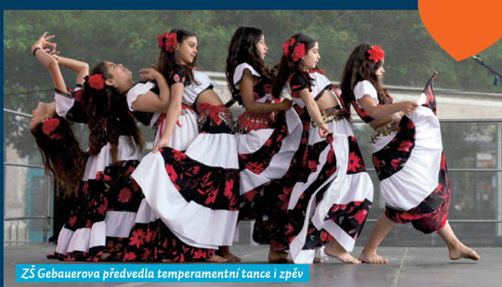
ZŠ Gebauerova předvedla temperamentní tance i zpěv