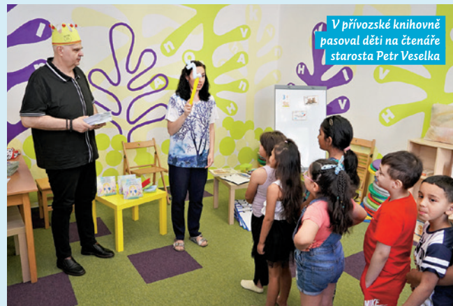
V přívozké knihovně pasoval děti na čtenáře starosta Petr Veselka

přívozké pobočky Knihovny města Ostravy, která pořádá spoustu akcí pro děti a jejich rodiče. V květnu zde otevřeli klub pro nejmenší děti Khomoro/Sluníčko, pravidelně se zúčastňují také akcí MoaP s workshopy,“ uvedl starosta Petr Veselka.