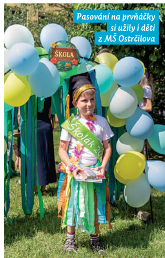
Pasování na prvňáčky si užily i děti z MŠ Ostrčilova

V červnu se již tradičně loučí předškoláci s mateřskými školami. A mateřinky pro děti i jejich rodiče připravují pasování předškoláků, což je odpoledne plné smíchu i dojetí.