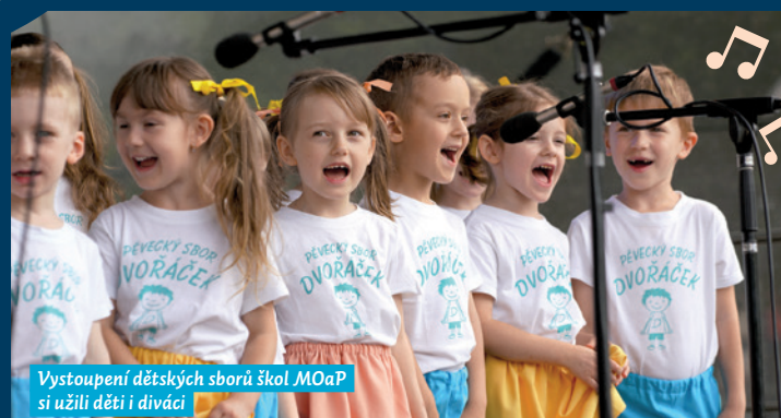
Vystoupení dětských sborů škol MOaP si užili děti i diváci