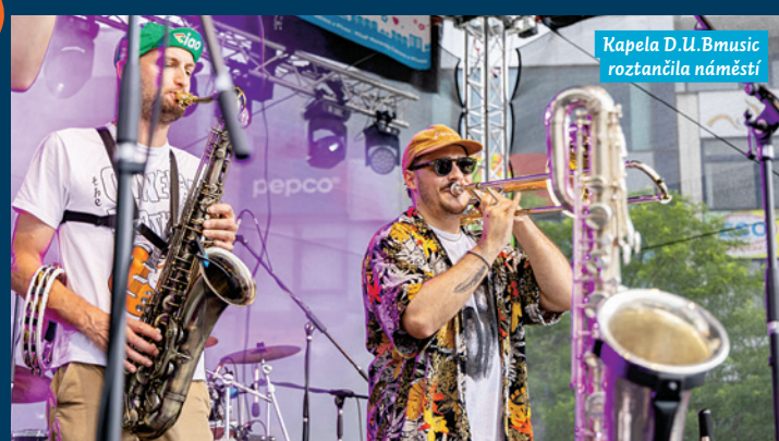
Kapela D.U. Bmusic roztančila náměstí