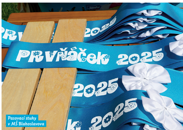
Pasovací stuhy v MŠ Blahoslavova