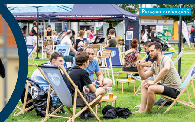
Posezení v relax zóně