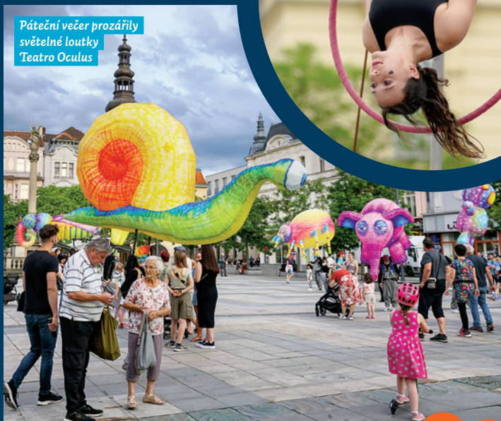
Páteční večer prozářily světelné loutky Teatro Oculus