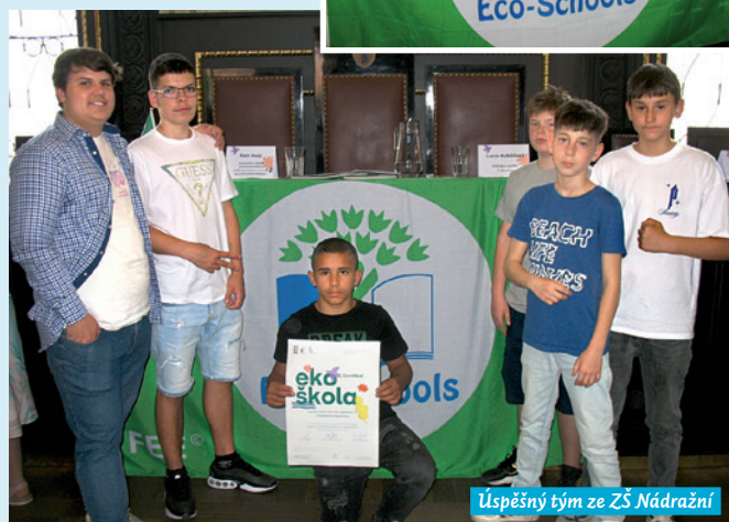
Úspěšný tým ze ZŠ Nádražní