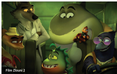
Film Zlouni 2