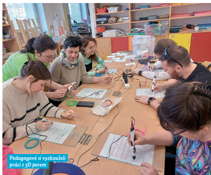
Pedagogové si vyzkoušeli práci s 3D perem

V květnu se uskutečnila další z klíčových aktivit s názvem Tvořivé dílny. Byl uspořádán workshop ve Středisku volného času Ostrava-Zábřeh, zaměřený na polytechnické vzdělávací