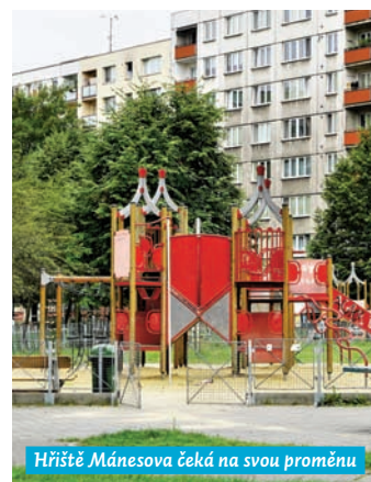
Hřiště Mánesova čeká na svou proměnu

izolovaných akcí, se vždy naplánuje proměna pouze vítězné lokality na základě připomínek a názorů občanů, kteří zde žijí a pracují,“ uvádí místostarosta a dodává: „Tímto dokazujeme, že naším cílem je především kvalita, ne kvantita. Investujeme do jednoho většího projektu, který poslouží obyvatelům daného místa. Další výhodou zmíněného nového způsobu je určitě také spolupráce s Ostravskou univerzitou, s akademiky a odborníky, kteří se podílejí na přípravě projektu.“