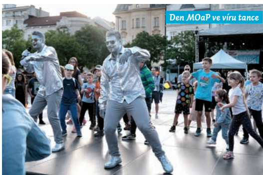
Den MOaP ve víru tance

můžete k přepravě využít zdarma. Tématem letošního ročníku jsou SIGNÁLY, tak je vysílejte a sdílejte své zážitky na sociálních sítích pod Ostravská muzejní noc. Podrobný program na www.ostravskamuzejninoc.cz .