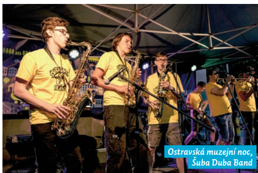
Ostravská muzejní noc, Šuba Duba Band