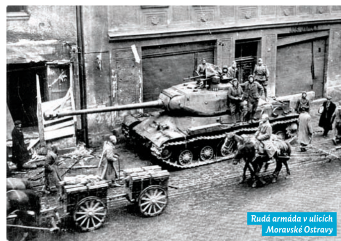
Rudá armáda v ulicích Moravské Ostravy

Boje o Ostravu si vyžádaly životy 1407 rudoarmějců, 2 československých tankistů a 449 občanů města. Těla padlých byla pohřbena před Novou radnicí a na různých místech jednotlivých městských částí. Na konci roku 1945 byla ale většina těl exhumována a zpopelněna v městském krematoriu. Urny s popelem pak byly při příležitosti prvního výročí osvobození města 30. dubna 1946 uloženy do nově budovaného mauzolea v Komenského sadech.