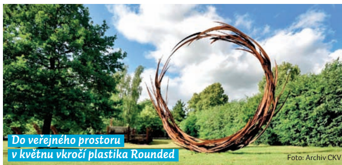
Do veřejného prostoru v květnu vkročí plastika Rounded

„Dílo sochaře Jana Dostála se už krátce po jeho studiích dostalo na prestižní evropské výstavy a nemá u nás ani za hranicemi obdoby. Třeba jeho monumentální Mrak bodoval na výstavě EXPO v Dubaji. Charakteristickým materiálem tohoto umělce je ocel: tvoří z různé dlouhých plechů a trubek, které kroutí, proplétá, ohýbá a spojuje. V Ostravě bylo už v Komenského sadech k vidě-