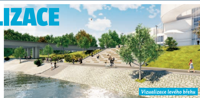
Vizualizace levého břehu

vou oblastí kolem řeky. Tuto revitalizaci, financovanou městem Ostrava, obvod MOaP velmi přivítal. „Druhá etapa prací obsáhne opravu komunikace v délce 530 metrů, navazující na komunikaci Havlíčkovo nábřeží a samostatný sjezd