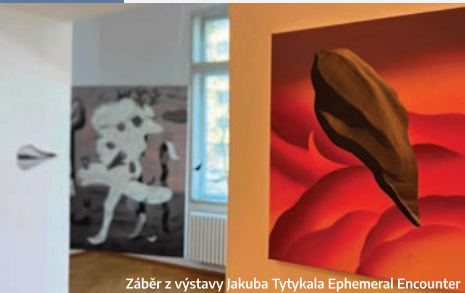
Záběr z výstavy Jakuba Tytykala Ephemeral Encounter