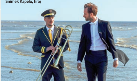
Snímek Kapelo, hraj