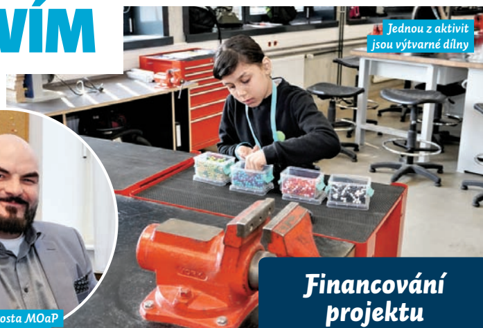
Jednou z aktivit jsou výtvarné dílny

do divadelních dílen, výtvarných a sportovních aktivit. V rámci divadelních dílen využili společné kulturní a historické kořeny vycházející z legendy o založení Ratiboře. Workshopy byly zaměřené třeba na pohybové hry, improvizaci cvičení či pantomimu,