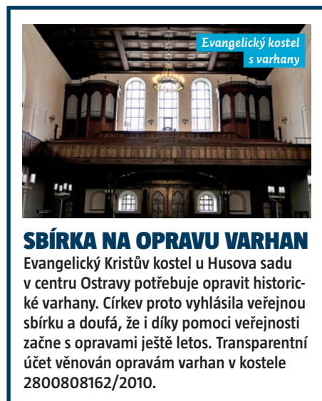
Evangelický kostel s varhany