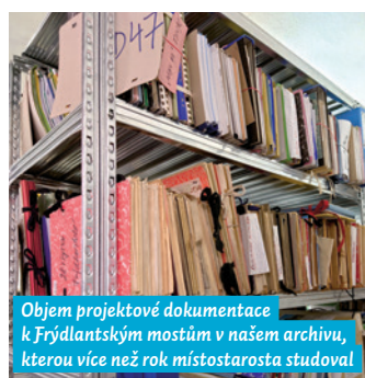
Objem projektové dokumentace k Frýdlantským mostům v našem archivu, kterou více než rok místostarosta studoval

Při výstavbě mostů byl dopravní provoz a celková vytiženost místa zcela jiná než dnes. Místem procházelo, projíždělo za den až 250 tisíc osob, byl to ústřední dopravní uzel města. Na provoz dnešní doby jsou však mosty předimenzované. Tehdy počítali s mnohem větší vytižeností, než jaké nyní mosty doopravdy dosahují. Například v další zprávě