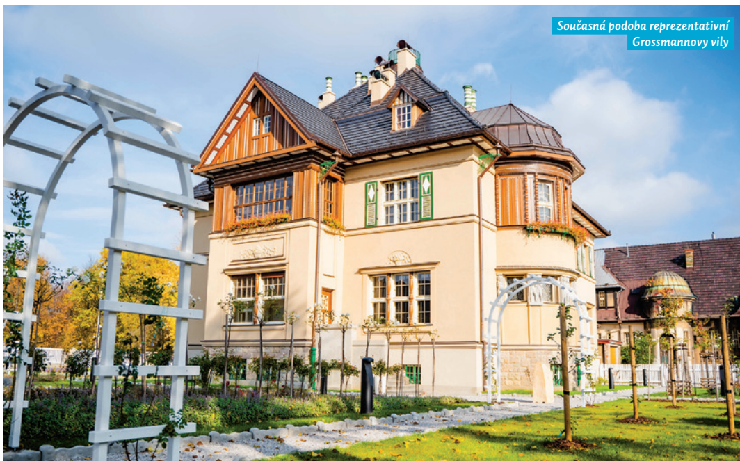
Současná podoba reprezentativní Grossmannovy vily