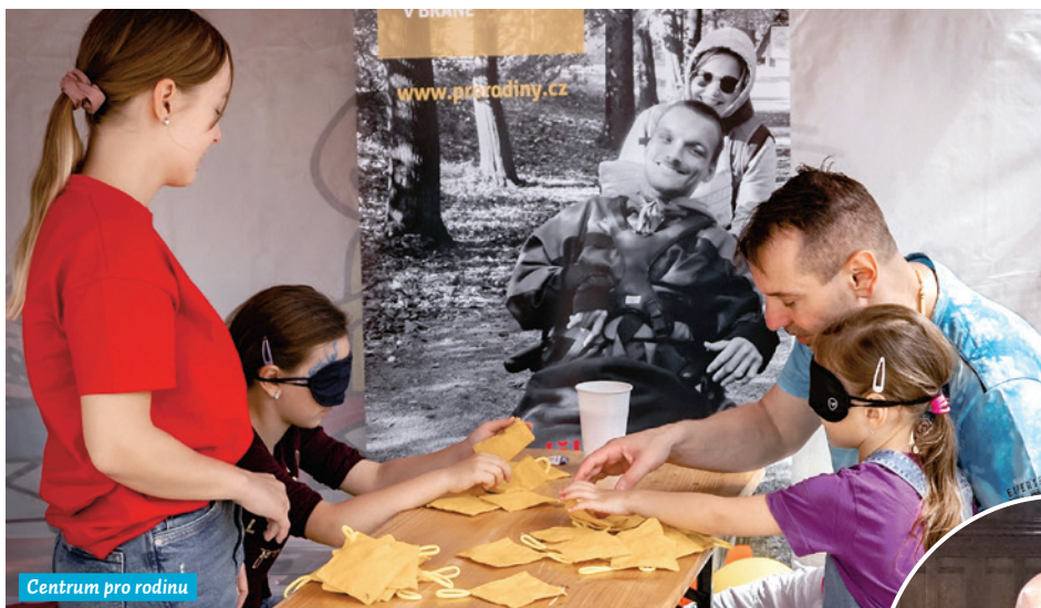
Centrum pro rodinu

Radnice městského obvodu Moravská Ostrava a Přívoz pravidelně podporuje nejrůznější charitativní projekty a akce místních neziskových organizací, které přispívají na dobrou věc. Kde se tato spolupráce projevuje nejvýrazněji?