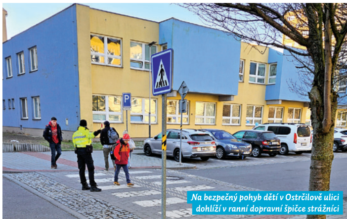
Na bezpečný pohyb dětí v Ostrčilově ulici dohlíží v ranní dopravní špičce strážníci

Ke zklidnění dopravní situace na Ostrčilce by mohlo přispět parkoviště typu Kiss and Ride (Polib a jeď) na Nádražní ulici u Hotelového domu Jindřich. Zde mohou rodiče své dítě z auta vysadit i přes absenci tohoto parkoviště už nyní. „Nemusejí tak zajíždět do jednosměrky, otáčet se před školou a vystavovat se riziku, že uvíznou v zácpě. Děti se během pár chvil bezpečně dostanou po chodníku přes park Petra Bezruče do školy, musí pouze přejít přes přechod u Střediska volného času,“ vysvětluje Roman Tietz.