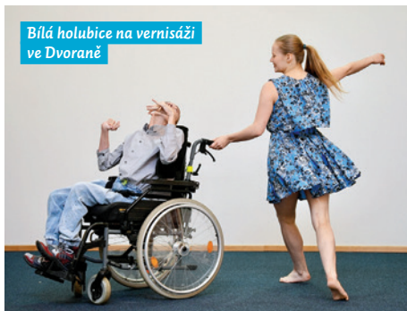
Bílá holubice na vernisáži ve Dvoraně

K hojně spolupráci dochází na akcích pořádaných radnicí MOaP, jako jsou adventní Andělé ve Dvoraně nebo letní Den MOaP. Jde nejčastěji o workshopy, které dávají prostor různým neziskovým organizacím a sociálním podnikům. Tak například dárky, ozdoby a jiné výrobky z papíru nabízí sociální podnik Krabičky z Přívozu. Podnik zaměstnává osoby s duševním onemocněním nebo jinak znevýhodněné lidi na trhu práce. Na akcích obvodu rozdává úsměv Prajzulka, vozíčkářka, jejíž šikovné ruce dokáží z drátků vykouzlit krásné