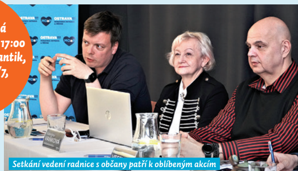
Setkání vedení radnice s občany patří k oblíbeným akcím

První setkání se koná 29. dubna 2025 od 17:00 hodin v Klubu Atlantik, Čs. Legii 3058/7, Moravská Ostrava.