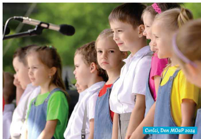
Cvrčci, Den MOaP 2024

motivací, když mohou nejen rodičům zazpívat na vánoční besídce či ke Dni matek. Velmi si oblíbily také pěvecké vystoupení pro děti v MŠ nebo v domech pro seniory. Děvčata a chlápci z pěveckého sboru Gajdošík absolvovali například i svou malou koncertní šňůru Vánoční zpívání. Jeden z koncertů se v prosinci konal v ALZHEIMER HOME Ostrava. Děti zpívaly pro klienty i zaměstnance tohoto domova a velkou odměnou pro dětské zpěváčky bylo společné zpívání koled s dědečky a babičkami. A zasloužený potlesk vždy