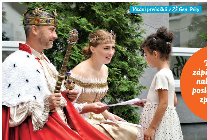
Vítání prvňáčků v ZŠ Gen. Píky

Termíny zápisů v MOaP naleznete na poslední straně zpravodaje