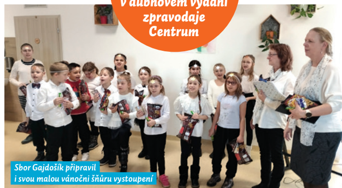
Sbor Gajdošík připravil i svou malou vánoční šňůru vystoupení

Další dětské hudební sbory našich škol představíme v dubnovém vydání zpravodaje Centrum