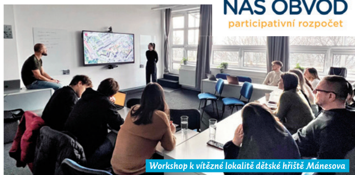
Workshop k vítězné lokalitě dětské hřiště Mánesova