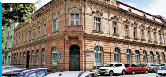
Dům na náměstí Svatopuka Čecha