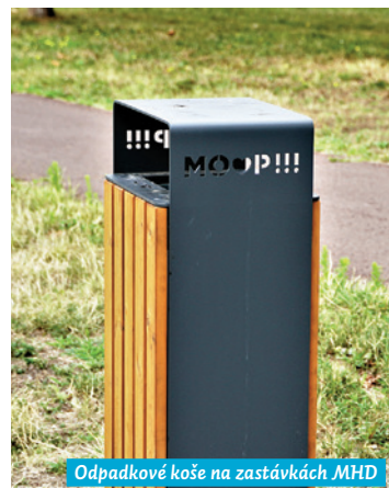
Odpadkové koše na zastávkách MHD