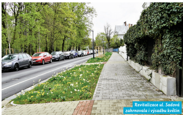
Revitalizace ul. Sadová zahrnovala i výsadbu květin