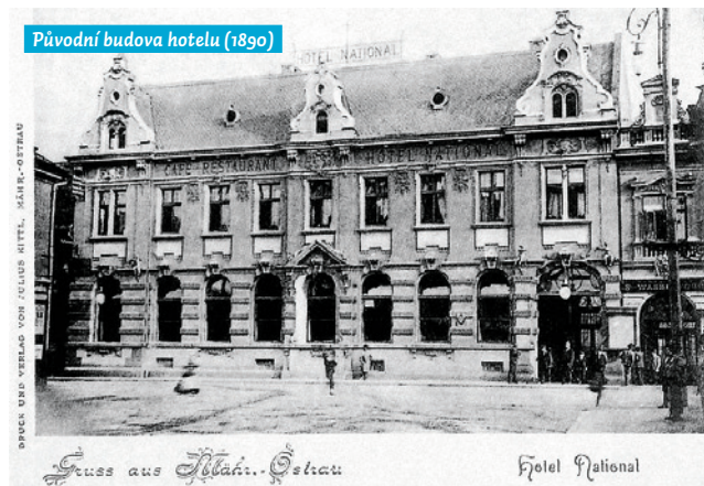
Původní budova hotelu (1890)