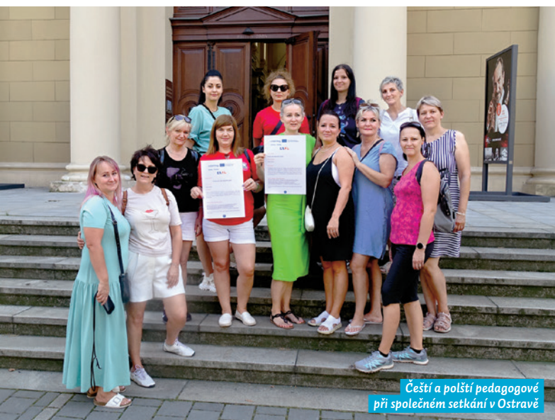
Čeští a polští pedagogové při společném setkání v Ostravě

Městský obvod Moravská Ostrava a Přívoz realizuje v rámci česko-polské spolupráce projekt „Putování do starých časů“, který je zaměřen na děti a pedagogy mateřských škol. Do projektu se zapojily dvě ostravské mateřinky, a to MŠ Šafaříkova, MŠ Lechowiczova a jedna polská – Przedszkole Marii Konopnickiej z Glubczyc.