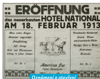
Oznámení o otevření hotelu (Ostrauer Zeitung)