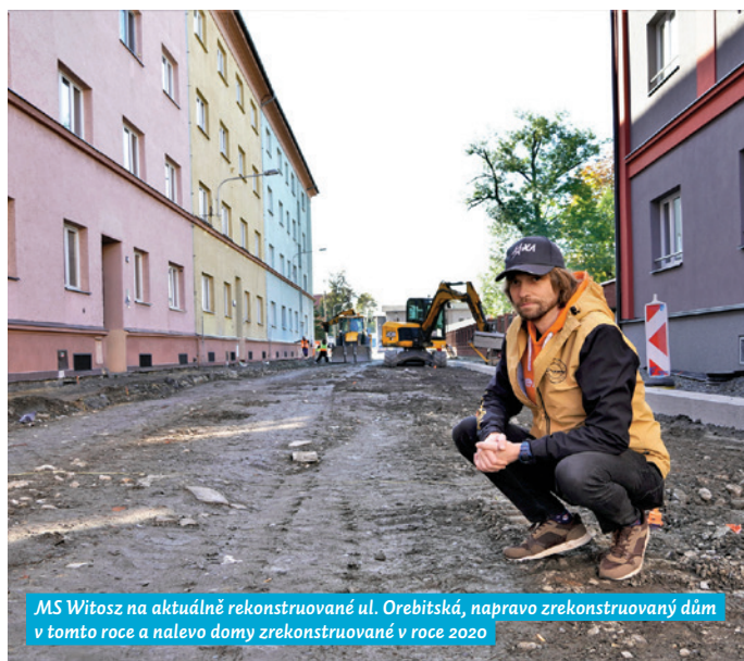
MS Witosz na aktuálně rekonstruované ul. Orebitská, napravo zrekonstruovaný dům v tomto roce a nalevo domy zrekonstruované v roce 2020

Předmětem právě probíhajících stavebních prací jsou opravy tras stávajících chodníků, místních komunikací, zpevněných ploch včetně jejich šířkových a výškových úprav a parkovacích ploch na ul. Orebitská od Sokolské třídy k ul. Teslova. „Rekonstrukce ulice Orebitská byla koordinována spolu se sítěři. Podařilo se nám sladit samotnou rekonstrukci spolu s opravou inženýrských sítí, což