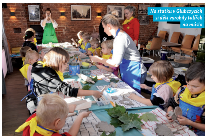
Na statku v Glubczycích si děti vyrobit talířek na maslo

Zahrály si na jejich obyvatel, kteří vykonávají různé práce spojené například s péčí o domácí zvířata. Setkaly se s venkovskou hospodyní a hospodářem, zapojily se do zhotovení másla, pozorovaly, jak se brousí kosa a seče tráva, hněte těsto na chleba, stlouká maslo v máselnici. Každé dítě si zhotovilo z keramické hlíny talířek na maslo. Poté se všichni zúčastnili společného oběda venkovského typu (ochutnávaly se například pečené brambory s máslem a solí). Program si děti mohly zpestřit volnou hrou v areálu statku.