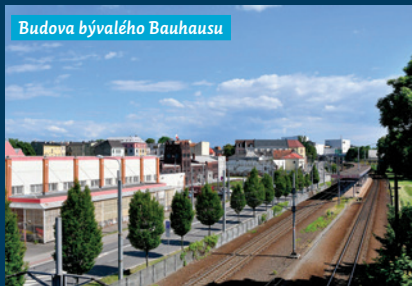
Budova bývalého Bauhausu