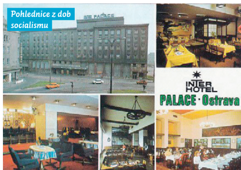
Pohlednice z dob socialismu