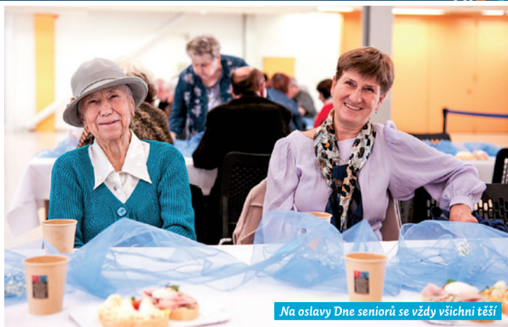
Na oslavy Dne seniorů se vždy všichni těší!