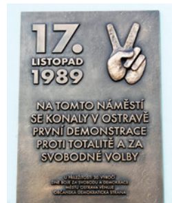
Pamětní deska k 17. listopadu je na Masarykově náměstí, kde v roce 1989 probíhaly první demonstrace

Oslavili jsme významné výročí, Den vzniku samostatného československého státu, což připadá na 28. října. Vedení našeho obvodu si připomnělo tento svátek při vzpomínkovém aktu u památníku v Husově sadu. V listopadu si pak připomeneme 35. výročí sametové revoluce – 17. listopad – Den boje za svobodu a demokracii a Mezinárodní den studentstva.