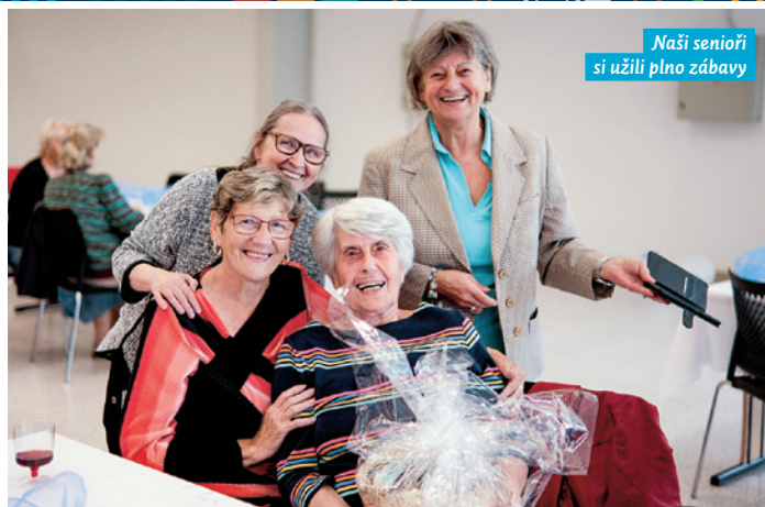
Naši senioři si užili plno zábavy