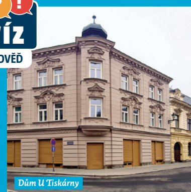
Dům U Tiskárny