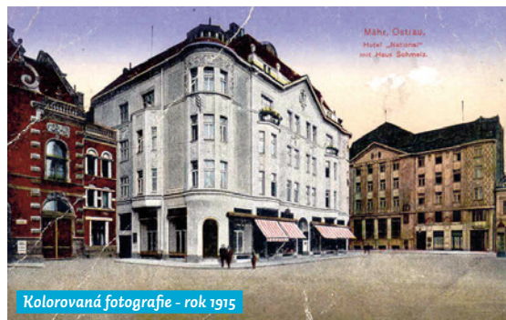
Kolorovaná fotografie - rok 1915