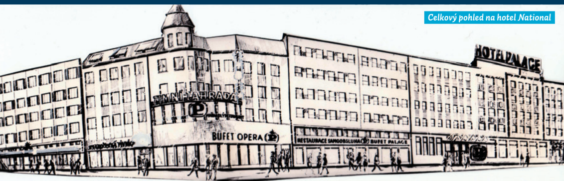
Celkový pohled na hotel National