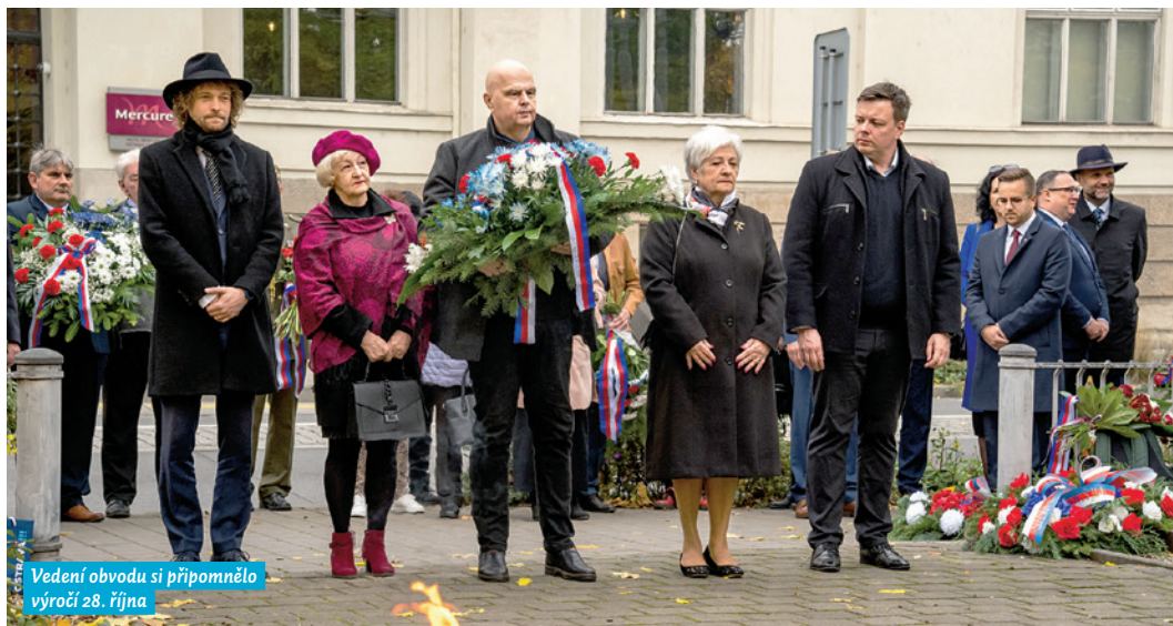
Vedení obvodu si připomnělo výročí 28. října

„Občas si kladu otázku, co spojuje 28. říjen Den vzniku samostatného československého státu (1918) a 17. listopad Mezinárodní den studentstva (rok 1939) a Den za svobodu a demokracii (rok 1989). Data, která od sebe dělí mnoho let, a přece mají tolik společného. Jsou to symbolické dny našeho národa, které nám připomínají význam slov svoboda, nezávislost a demokracie. Určitě by nám měly připomínat, že žijeme ve svobodném demokratickém státě a že bychom si této svobody měli více vážit. 17. listopad 1989 jsem prožívala stejně jako mnoho jiných Ostravanů. Teprve následující dny a týdny byly velmi hektické a plně očekávání.