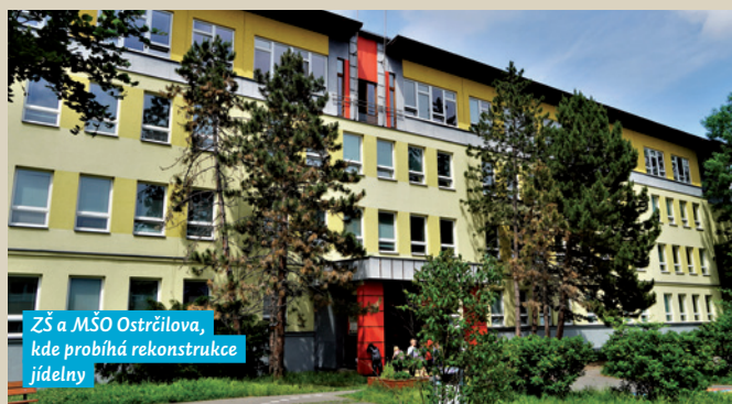
ZŠ a MŠO Ostrčilova, kde probíhá rekonstrukce jídelny