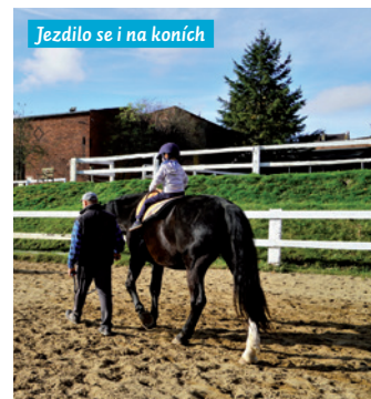
Ježdilo se i na koních

Začátkem října (10. 10. 2024) se děti ze všech mateřských škol sešly na zámku v Raduni na aktivitu nazvanou „V zámku“. Pro děti byla připravena zážitková prohlídka zámeckého interiéru v dobovém kostýmu s výkladem o životě rodiny na zámeckém sídle a prohlídka oranžerie. Děti také mohly využít výhody zámeckého komplexu, rozsáhlého anglického parku, kde si na travnaté ploše užily piknik i hry. Tato aktivita umožnila vtáhnout