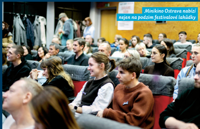
Minikino Ostrava nabízí nejen na podzim festivalové lahůdky

V loňském roce se Minikino Ostrava zapojilo i do celorepublikového konceptu karlovarského filmového festivalu s názvem Tady Vary a pro velký zájem ze strany diváků pokračuje i letos. Jde o koncept filmové sezóny se zvýhodněným předplatným. Zájemci si mohou vybrat z nabídky deseti předpremiér nejvýraznějších světových filmů a až do června příštího roku je mohou sledovat vždy jednu středu v měsíci spolu s diváky dalších zapojených kin v České republice. Mezi snímky patří například komediální drama Anora Seana Bakera nebo novinka oscarového Paola Sorrentina s názvem Parthenopé.