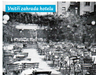
Vnitřní zahrada hotelu

Po roce 1945 byl hotel znárodněn a stal se součástí státního podniku Interhotely Čedok. V druhé polovině 60. let 20. století došlo k unifikující přestavbě celého hotelu, budova byla hrubě deklasována (typizovaná okna, břizolitová fasáda, zničení všech prvků a detailů).