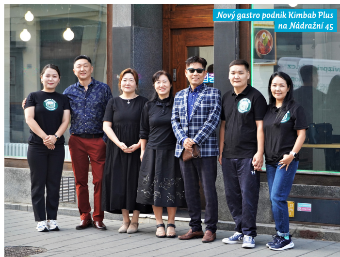
Nový gastro podnik Kimbab Plus na Nádražní 45

Úpravy a investování do nebytového fondu jsou patrné i u dalších prostor. Jedná se např. o nedávno vyměněné výkladce na ulici 28. října 18, kde vznikne kavárna, či zcela nově zrekonstruovaný prostor pro kanceláře na ulici 30. dubna 4, 6. V průběhu října bude zveřejněn na webu www.nemovitostimoap.cz také katalog služeb s veškerou nabídkou nebytových prostorů v našem obvodu.