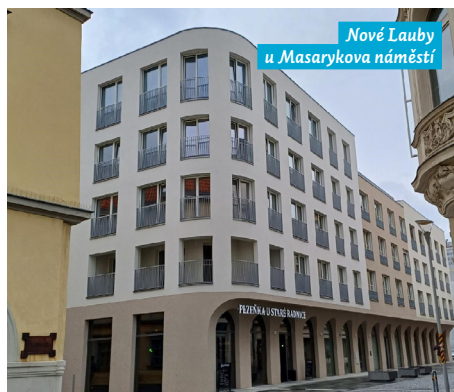
Nové Lauby u Masarykova náměstí

„Projekt parkovacího domu u krajského úřadu ukazuje, že i ryze účelová stavba může zaujmout kvalitní architekturou.“