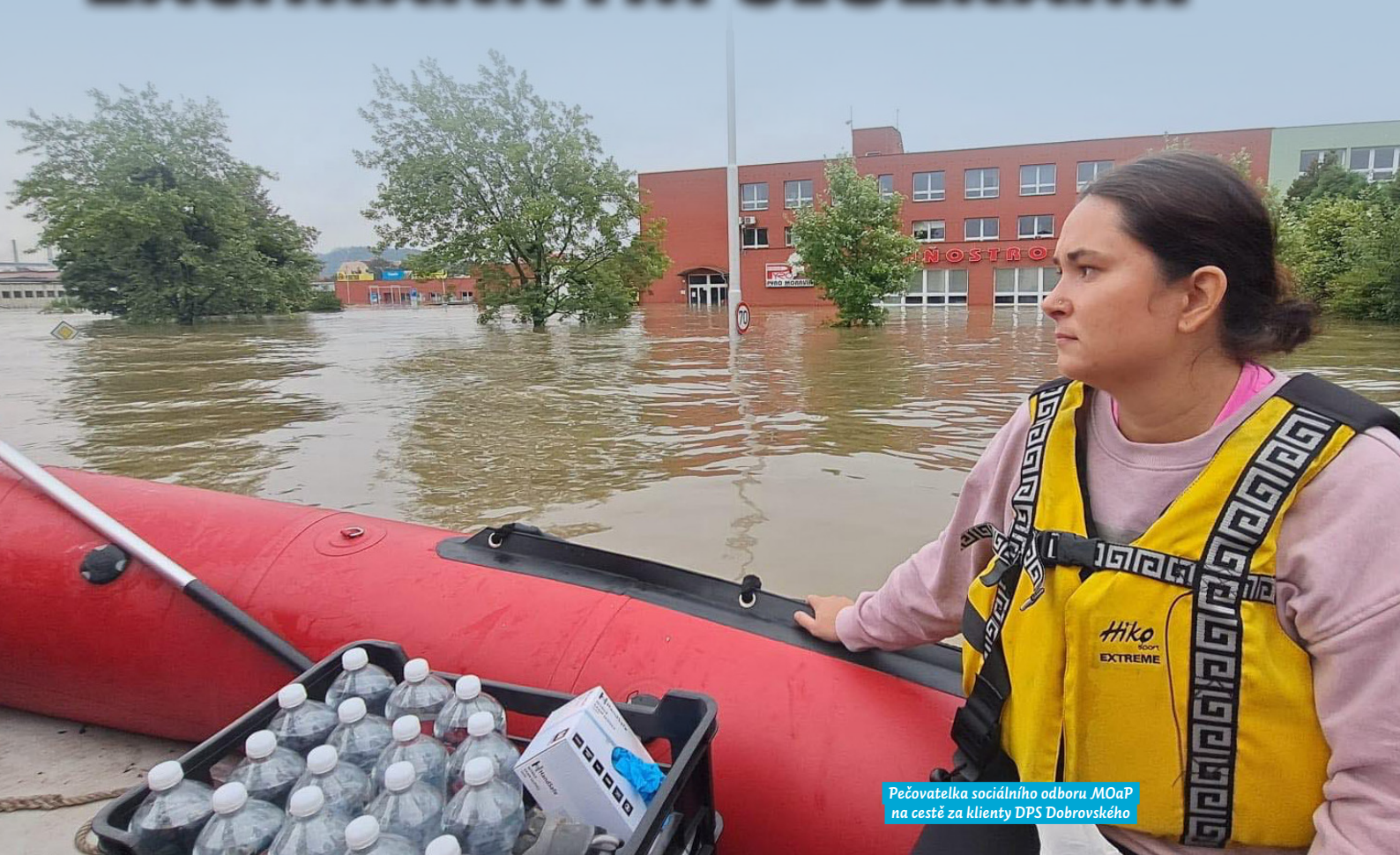
Pečovatelka sociálního odboru MOaP na cestě za klienty DPS Dobrovského