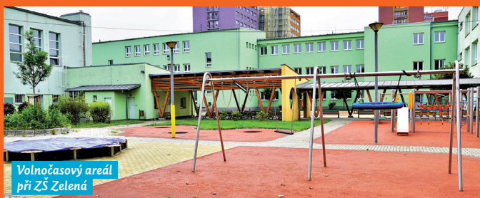
Volnočasový areál při ZŠ Zelená

volného času. Vznikl tak projekt komunitní zahrady, byl vybudován venkovní multifunkční sportovní a volnočasový areál s herními prvky a odpočinkovou zahradní zónou. Osvědčil se například i projekt Chytrá svačinka, kterým škola podpořila zaměstnávání sociálně a zdravotně znevýhodněných a zároveň poskytla možnost zdravých a cenově dostupných svačinek žákům i zaměstnancům. Pod