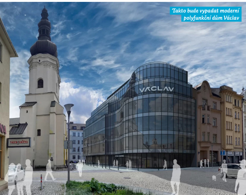
Takto bude vypadat moderní polyfunkční dům Václav

V centru Ostravy, a tedy v našem obvodě, se staví a staví... Budíme za to rádi, nejen centrum, ale celá Ostrava se tak dalšími krůčky posouvá k moderní metropoli. I když jsou některé stavby zatím jen na papíře, probíhající proměnu centra díky těm, které už stojí, nebo jsou těsně před realizací, nelze nezaznamenat. Zde je několik příkladů.