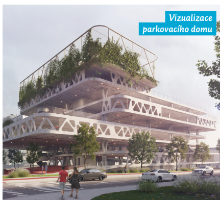
Vizualizace parkovacího domu