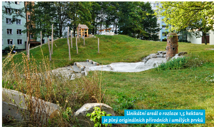
Unikátní areál o rozloze 1,5 hektaru je plný originálních přírodních i umělých prvků