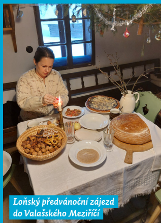
Loňský předvánoční zájezd do Valašského Meziříčí

Naši senioři se mohou těšit na dva poslední letošní zájezdy, kdy budou mít možnost zavítat do slezského pohraničí a do Olomouce.