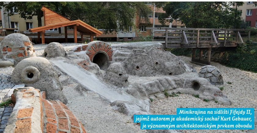
Minikrajina na sídlšti Fifejdy II, jejímž autorem je akademický sochař Kurt Gebauer, je významným architektonickým prvkem obvodu