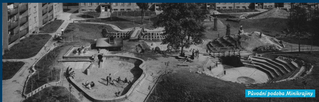
Původní podoba Minikrajiny

Oprava díla „Minikrajina Fifejdy II“ – 2. etapa – část B předpokládaná cena díla s DPH 700 tisíc Kč. Jedná se o opravu kopce se stožárem, položený suchý strom, u travnatého hřiště nátěr branek, vyspravení cihlových sloupů u houpaček, vyspravení lanového kolotoče, doplnění infoce dule.