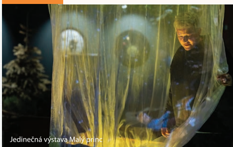
Jedinečná výstava Malý princ

SOCHY!!! vol. 2... yummy yummy Exteriérová instalace soch předních českých autorů v Komenského sadech na promenádě od mostu Pionýrů po Dětský ráj. Vstup zdarma.