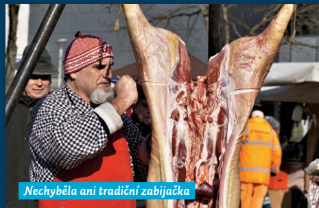
Nechyběla ani tradiční zabijačka