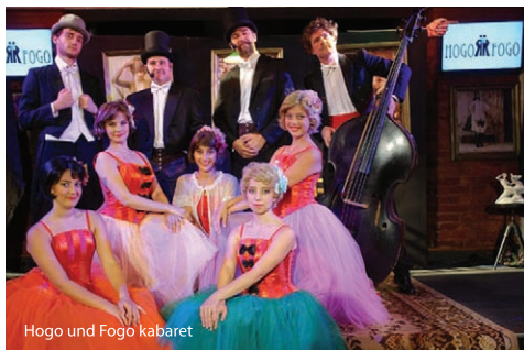
Hogo und Fogo kabaret