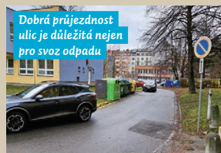
Dobrá průjezdnost ulic je důležitá nejen pro svoz odpadu

Špatně zaparkovaná auta mohou nejen ohrozit plynulost či bezpečnost provozu, ale bývají i příčinou toho, že vám sběrný vůz OZO neodveze odpad. Prostě proto, že daná ulice se díky vaší parkovací bezohlednosti stane pro „popelářské auto“ příliš úzkou, a to se tak nedostane k vašim plným kontejnerům.