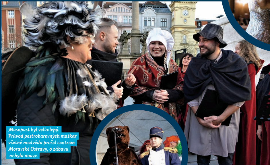
Masopust byl velkolepý. Průvod pestrobarevných maškar včetně medvěda prošel centrem Moravské Ostravy, o zábavu nebyla nouze