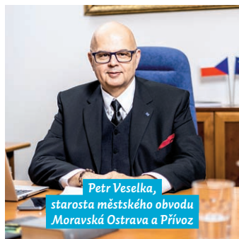
Petr Veselka, starosta městského obvodu Moravská Ostrava a Přívoz