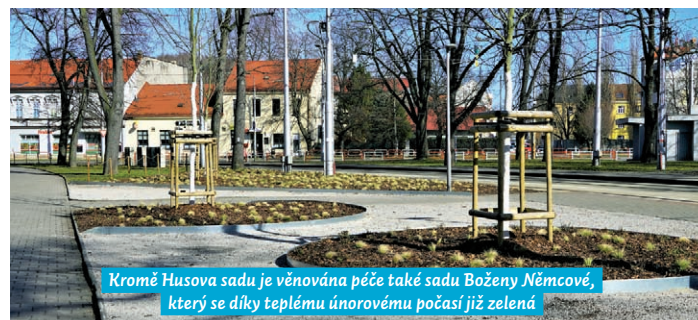
Kromě Husova sadu je věnována péče také sadu Boženy Němcové, který se díky teplému únorovému počasí již zelená

V letošním roce je naplánována revitalizace další části zeleně tohoto centrálního městského parku. Na podzim 2023 již došlo k bezpečnostním a zdravotním ořezům stromů, bude následovat kácení osmi stromů se zjištěným špatným zdravotním stavem