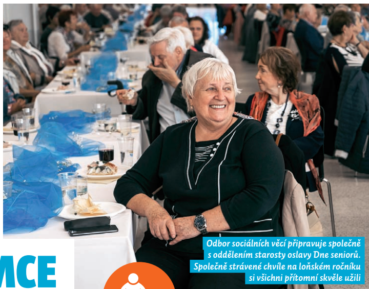
Odbor sociálních věcí připravuje společně s oddělením starosty oslavu Dne seniorů. Společně strávené chvíle na loňském ročníku si všichni přítomní skvěle užili

Nemůžete vy nebo rodinný příslušník přijímat starobní, vdovský, vdovecký, invalidní nebo sirotčí důchod ze zdravotních důvodů? Například se po mozkové příhodě nejste schopni podepsat? Nebo máte příbuzného, který neumí s důchodem hospodařit, neplatí nájem, půjčuje peníze známým, kteří je nevracejí? Požádejte o ustanovení zvláštního příjemce dávky důchodového pojištění.