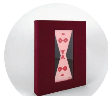
Toyen, Débris de rêves [Střepy snů] , Paříž, 1967, GVUO