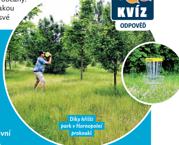
Díky hřišti park Hornopolní prokoukl

obvod 2021 a jeho cílem bylo toto místo vyčistit a zatraktivnit. A to se bezesbýtku povedlo! Hřiště se tak stalo další lokalitou v MOaP, kde je možné trávit aktivní odpočinek v příjemném prostředí parku.