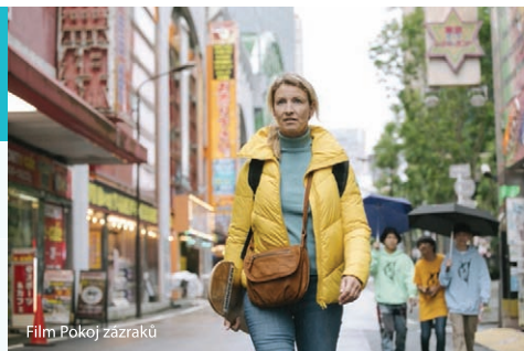
Film Pokoj zázraků

Výstava: Zbigniew Bajek Výstava děl polského umělce. Vernisáž se bude konat 11. 4. v 17:00 hodin.