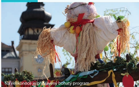
Na Velikonoce je připravený bohatý program

18:00 Tanec modrých andělů Cestopisný pořad Jiřího Kráčalíka.