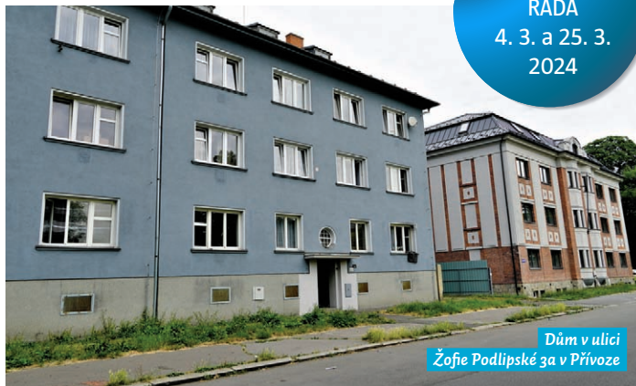
Dům v ulici Žofie Podlipské 3a v Přívoze