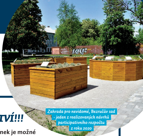
Zahrada pro nevidomé, Bezručův sad - jeden z realizovaných návrhů participativního rozpočtu z roku 2020

Loni poprvé se změnilly podmínky participativního rozpočtu. „Lidé nenavrhovali konkrétní projekty, ale lokalitu, která má projít komplexní proměnou. Tento koncept se nám osvědčil - místo několika roztříštěných, izolovaných akcí, chystáme proměnu vítězné lokality i na základě připomínek a názorů občanů, kteří zde žijí a pracují,“ uvádí