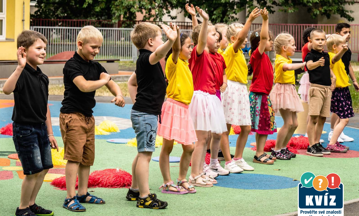
Pasování předškoláků MŠ Šafaříkova