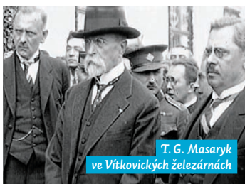
T. G. Masaryk ve Vítkovicích železárnách