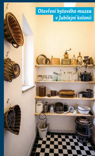
Otevření bytového muzea v Jubilejní kolonii

je Důl Jeremenko, téma Výstavba ve Vítkovicích po roce 1920. Sraz je v 15:00 na tramvajové zastávce Důl Jeremenko.