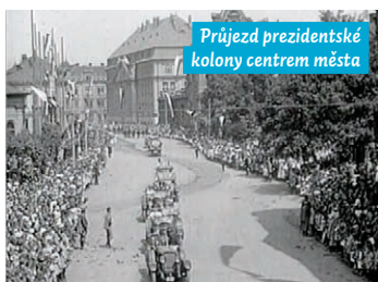
Průjezd prezidentské kolony centrem města