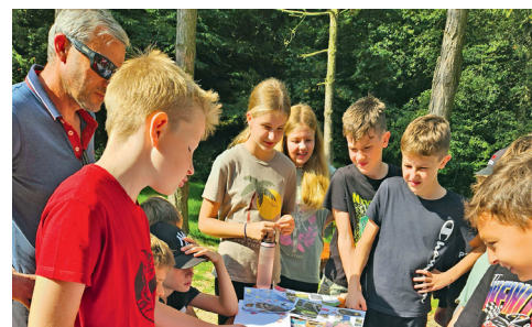
Žáci 6. ročníků ZŠ Matiční na adaptáku.

Žáci 6. ročníků ZŠ Matiční nedávno zažili nezapomenutelný adaptační pobyt, který je připravil na další důležitou etapu jejich školního života. Tento nezbytný krok na jejich vzdělávací cestě byl plný dobrodružství, učení se a budo-