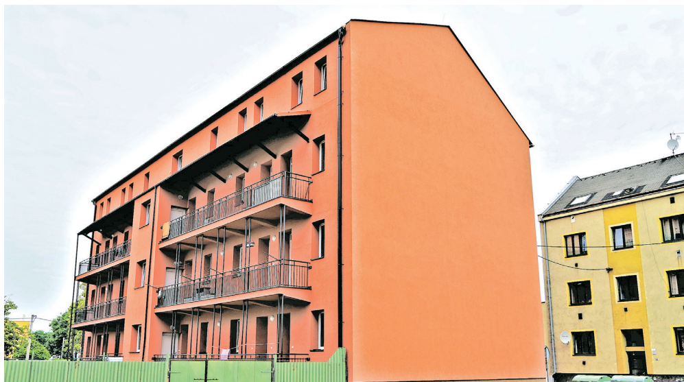
Dům v ulici Úprkova 11 prošel v rámci energetických úspor celkovou rekonstrukcí.

V letošním roce proběhla rekonstrukce Waldorfská ZŠ a MŠ, kde pokračovala další etapa opravy zahrady i oplocení. V budově byly také rekonstruovány zdravotně technické instalace (ZTI) a obnoveny zařizovací předměty, včetně přidružených stavebních úprav, a opravy přípojovacích a svislých odpadů kanalizace a nových rozvodů vody a topení. Na to navázala také kompletní rekonstrukce elektroinstalace v tomto objektu a výměna osvětlení. Změna způsobu vytápění, výměna dveří, elektroinstalace, kanalizace, rozvodů vody a zateplení objektu čeká ještě letos také bytový dům v ulici Jungmannova 7, kde budou rekonstruovány i stávající bytové jednotky. Kromě toho v současné době probíhá také oprava chodníků v ulicích Arbesova, Zákrejsova a Šafaříkova.