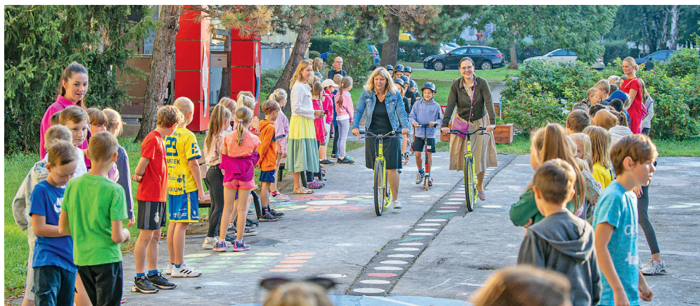
Děti ze ZŠ Ostrčilova před svou školou.