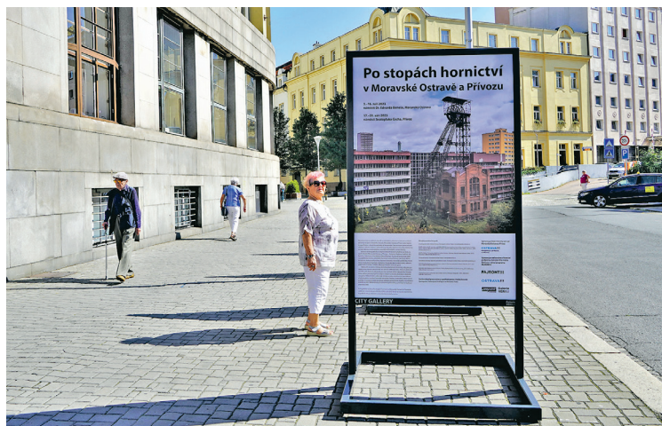
Výstavu Po stopách hornictví v MOaP si lidé mohli prohlédnout před radnicí.