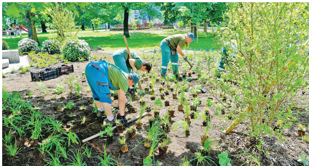
Pracovníci Technických služeb Moravská Ostrava a Přívoz už v roce 2021 začali podle plánu s výsadbou cibulovin a trvalek v Husově sadu.

V této aktuálně připravované fázi revitalizace budou upraveny záhony v centrální části parku, tj. kolem kašny směrem ke křížení ulic Dvořáková a Přívozká. Práce budou realizovány pracovníky Technických služeb Moravská Ostrava a Přívoz. Další fáze obnovy zeleně bude postupovat etapově v dalších letech dle finančních možností.