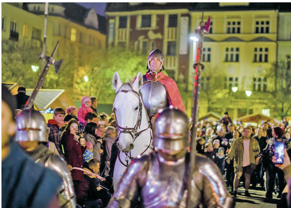
Slavnost svatého Martina se letos přesune do vily Hanse Ulricha a jejího okolí.

Návštěvníci se mohou těšit na pestrý program - bubeníky, šermířské souboje, zbrojnici nebo vojenské ležení. Pro děti jsou pak připraveny ukázky řemesel. Mohou třeba spřádat nitě a česat vlnu nebo si v tiskařské dílně na replice knihtisku z 15. století vytvořit obrázek a pomocí barvy a štočku ho přenést na papír.