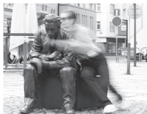
I takto může ve fotografii vypadat socha Leoše Janáčka v Ostravě.

Minikino pak nabídlo režisérovi fotografickou prezentaci „Tajemství přemyslovských artefaktů,“ ve které se zájemci dozvěděli o unikátních historických předmětech. Odkryli, kam za druhé světové války zmizel slavný ceremoniální meč a co na něm bylo vyryto, kdo před zničením zachránil unikátní hvězdný glóbus a proč se s Přemyslovým denárem, nalezeným v křížáckém Akkonu, nejspíše neplatilo. Zkrát-