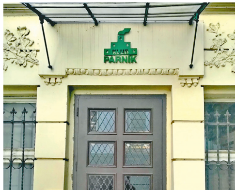
Parník najdete nade dveřmi hned u vstupu.