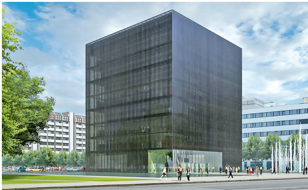
Vizualizace Černé kostky, z níž je patrné, že již po zahájení stavby přijdou řidiči o současné parkoviště. To nahradí nový parkovací dům u městské nemocnice.

Černá kostka by měla být nejen knihovnou, ale především veřejným prostorem pro obyvatele, ale i návštěvníky Ostravy. Ten by měl sloužit nejen ke studiu, ale také k práci (např. akademické), ke vzdělávání (od dětských návštěvníků, přes matky na rodičovské až po autory vysoce specializovaných publikací), k diskusi, pochopení, a především k inspiraci. Do plochy více než 16 tisíc metrů čtverečních se vejde nejenom rozsáhlý knižní fond vědecké knihovny, ale také konferenční sál, více než 20 samostatných a skupinových stu-