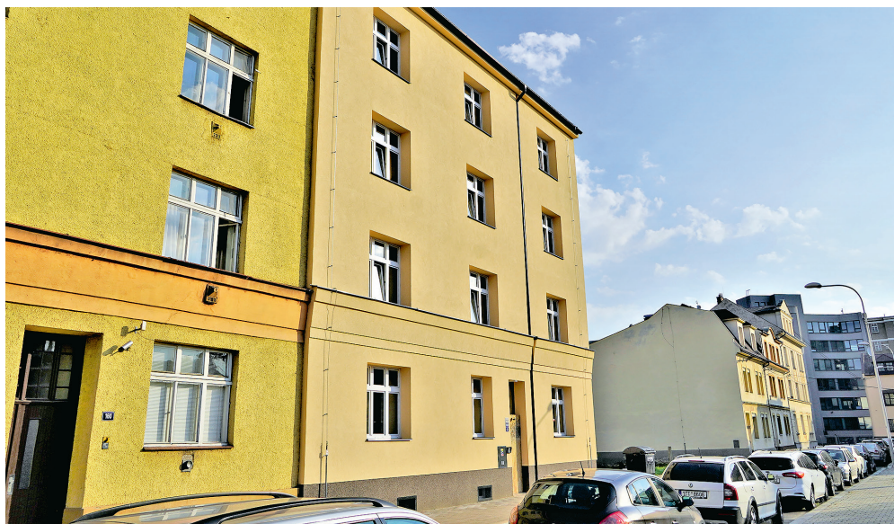
Do nových bytů v ulici Tolstého 12 se postupně stěhují noví nájemníci.

Investice 17,9 mil. Kč Téměř vybydlený dům v ulici Tolstého 12 prošel celkovou rekonstrukcí stávajících bytových jednotek. Objekt byl zateplen, získal nová okna, dveře, změnil se způsob vytápění, vyměněny byly i vnitřní rozvody vody, kanalizace a plynu. Dům má novou elektroinstalaci a kompletně opravenou střechu, včetně krovů. V poslední fázi oprav byla nahrazena původní zpevněná plocha kolem domu zcela novým chodníkem. Největším bonusem celé akce je celkem 9 zcela nově zrekonstruovaných bytů. Jedná se o pět bytů 1+1 a čtyři větší byty 3+kk. Byt č. 9 se navíc zvětšil o jeden pokoj v půdním prostoru. Nyní se již budou noví nájemníci do nabízených bytů postupně stěhovat.