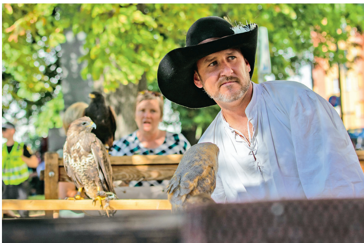
Sokolníci na Svatováclavském jarmarku.