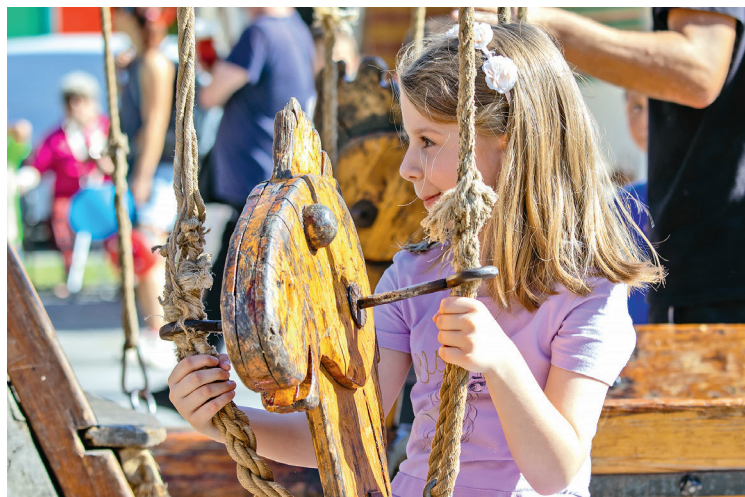
Na Svatováclavském jarmarku byla spousta atrakcí i pro ty nejmenší.