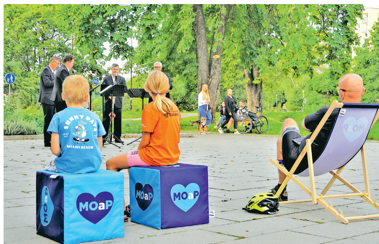
Stadlerovo klarinetové kvarteto zpříjemnilo Festivalový den MOaP.