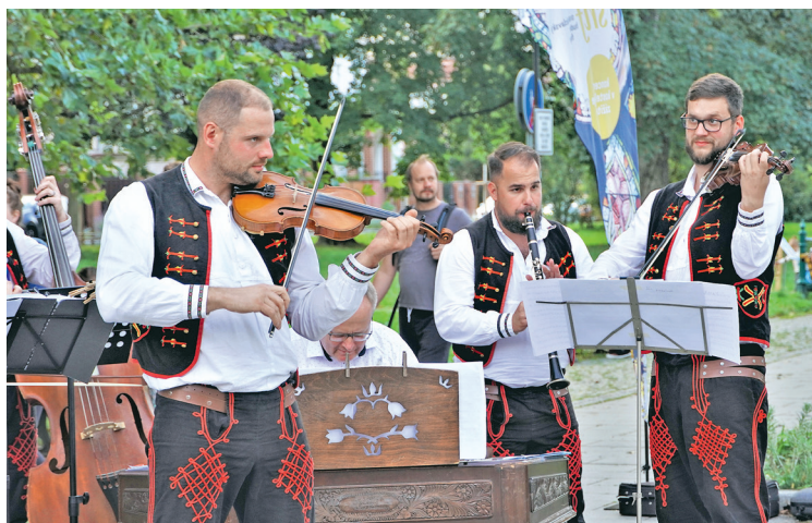
V rámci Festivalového dne MOaP vystoupila i cimbálovka Jagár.