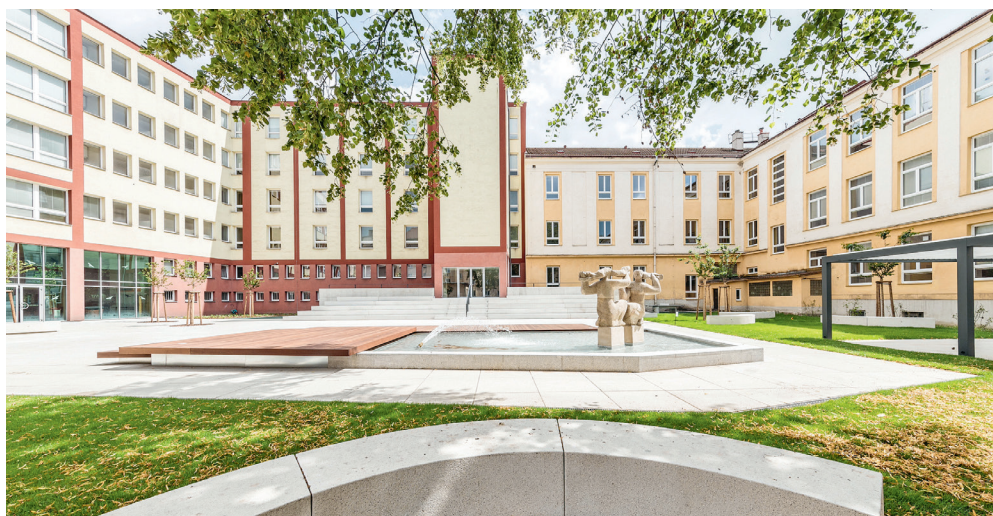
Rekonstruovaný školní dvůr je mezi 110 stavbami, které se ucházejí o cenu veřejnosti v soutěži Stavba roku 2023. Hlasovat lze až do 23. listopadu.

Investorem byl Moravskoslezský kraj jako zřizovatel gymnázia. „U zrodu myšlenky přizpůsobit školní dvůr potřebám moderní vzdělávací instituce a získat pro žáky víceúčelový