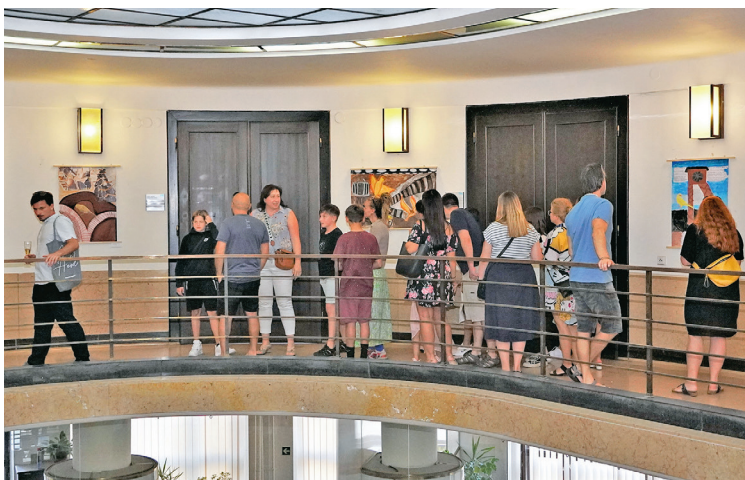
Vernisáž výstav Kanárek v dole a Po stopách hornictví v Moravské Ostravě a Přívozu na radnici centrálního obvodu.