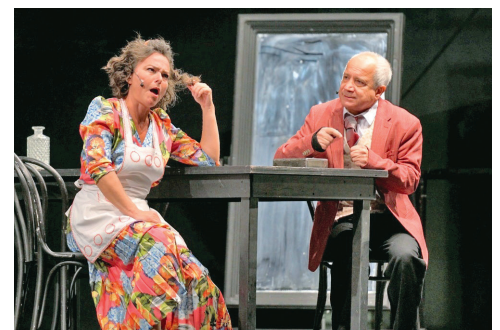
Divadlo Aréna zahájilo svou sezónu na Kuřím rynku .