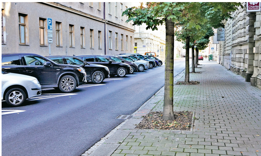
Ulice Kratochvílova po letošní rekonstrukci.

Investice 5,6 mil. Kč Ulice Kratochvílova v centru města, která vede od Havlíčkova nábřeží kolem Krajského soudu v Ostravě k Sokolské třídě, byla během prázdninových měsíců v letošním roce kompletně rekonstruována. Předmětem této akce byla havarijní oprava povrchu vozovky a sanace zmíněné frekventované ulice. V průběhu akce byly také opraveny uliční vpusti a obruby podél předmětné vozovky byly upraveny do patřičné výše. Zhotovitelem všech prací byly Ostravské komunikace a stavební dozor převzaly Technické služby Moravská Ostrava a Přívoz.