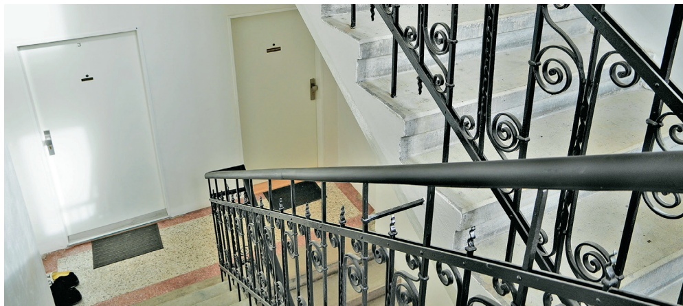
Pohled na chodbu bytového domu Jungmannova 8, kde je krásné původní zábradlí.

O rok později bylo investováno několik milionů korun do ZŠ Gebauerova, odloučeného pracoviště Ibsenova. „Šlo o jednu z největších investičních akcí v oblasti škol v našem obvodu. Začalo se náročnou sanací suterénu a pokračovalo energetickými úsporami. Budova byla kompletně zateplena, byla zde vyměněna okna i dveře a instalovány rekuperační jednotky na výměnu vzduchu. Nevyhovující plynové kotle byly vyměněny za moderní a úsporné plynové kondenzační kotle a přibýlo i tepelné čerpadlo. Provedena byla i regulace otopné soustavy po