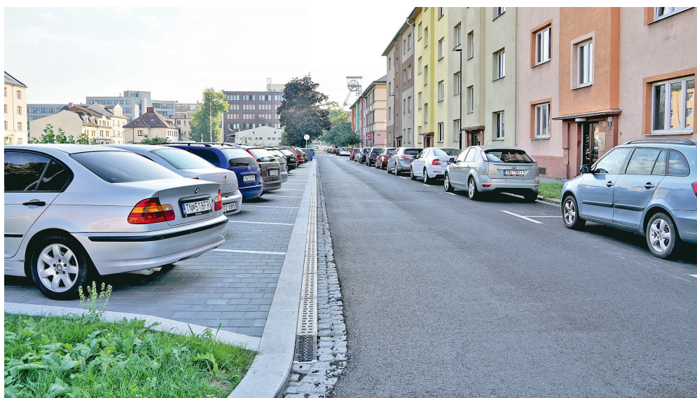
Pohled na nová parkovací místa v ulici Gorkého.

Investice 4,5 mil. Kč V ulici Gorkého bylo postaveno nové parkoviště a přibyla zde také nová místa pro kontejnery v zeleném pásu podél vozovky, a to ve vymezeném úseku, který začíná v místě napojení na ulici Poděbradovu a končí u ulice Valchařská. Součástí akce bylo rovněž provedení nového krytu vozovky, modernizace veřejného osvětlení v ulici a odvedení dešťových vod. Při rekonstrukci bohužel nebylo možné vysázet v ulici stromy kvůli hustým inženýrským sítím, které jsou vedeny pod jejím povrchem, což je bohužel častý problém při výsadbě nových stromů v centru města. Současné normy jsou přísnější než v minulosti.