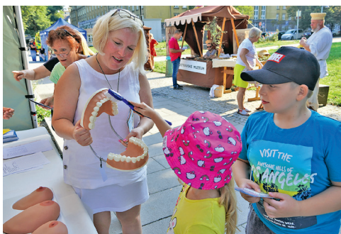
Den zdraví nabízel spoustu aktivit pro děti i dospělé.