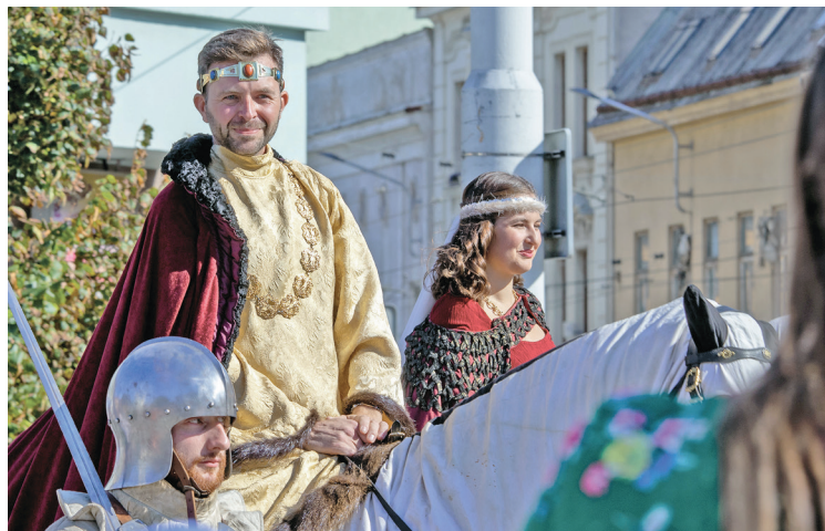
Svatý Václav s manželkou přijíždí na náměstí v Přívozu.