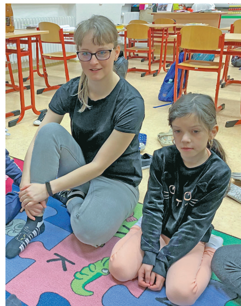
Děti v ZŠ Gajdošova při výuce.

Mottem této organizace je „Škola, do které