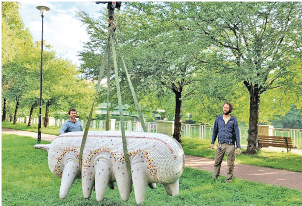
Instalace jednoho z děl Michala Trpáka.