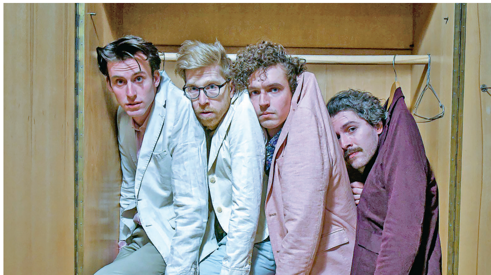
Návštěvníci letošního festivalu se mohou těšit například na hru Šmejdění od pražského souboru My kluci, co spolu chodíme .