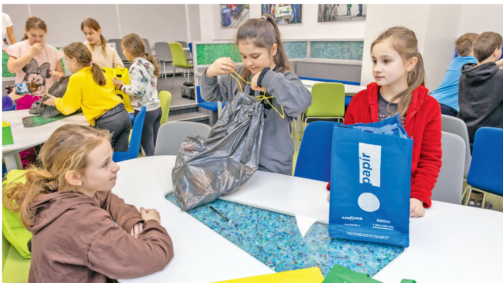
Děti se učí třdit odpady.

V souvislosti s 20. výročím založení Centra odpadové výchovy společnost OZO Ostrava nyní vyhlašuje soutěž s názvem Víme, co s odpady! pro žáky a studenty základních a středních škol ve své svazové oblasti. Pravidla soutěže najdou zájemci na webu společnosti v sekci Vzdělávání ( https://www.ozoostrava.cz/vzdelavani/soutez ).