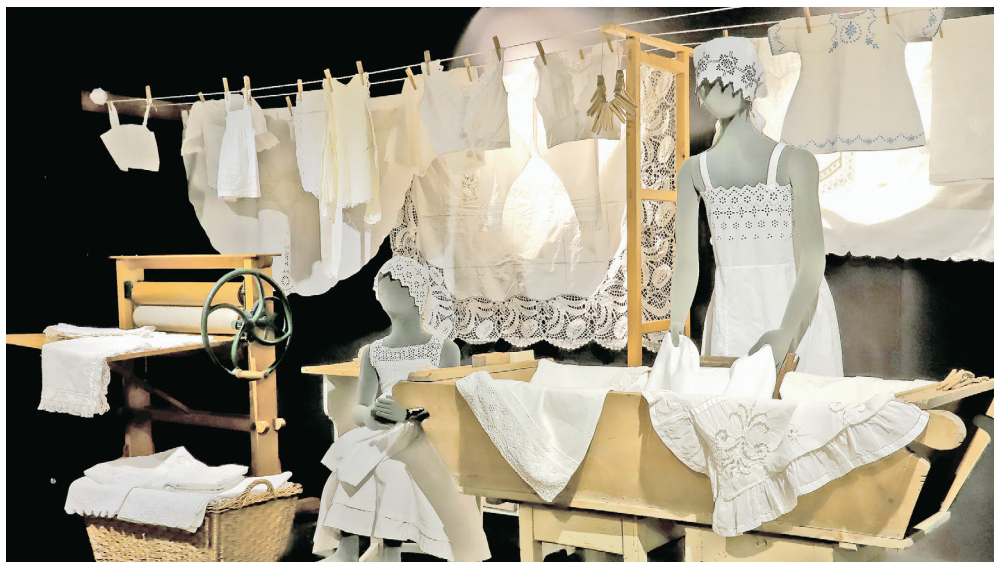
Víte, jak vypadala historická prádelna? Přijďte se na ni podívat do Ostravského muzea.