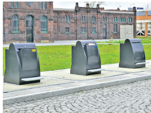
Podzemní kontejnery na ul. Masná

Obyvatelům přilehlých rodinných domů nelze bránit odkládat tříděný odpad do nádob u blízkých domů na sídlištních. V případě odkládání odpadu mimo nádoby lze tuto situaci řešit prostřednictvím městské policie nebo úřadu městského obvodu.