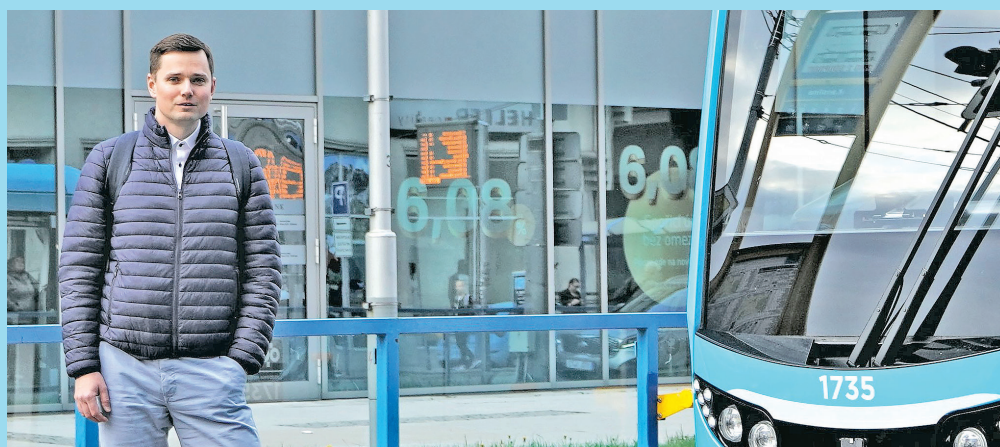
„Zastávka Karolina bude přestupním uzlem v centru,“ říká Roman Tietz.

„Připravované změny v tramvajové dopravě vyvolávají velké emoce především u cestujících, kteří jsou omezeni pohybově, nebo u maminek cestujících s kočárky,“ říká Roman Tietz, radní městského obvodu Moravská Ostrava a Přívoz pro oblast dopravy. „Obávají se většího počtu přestupů a delší doby jízdy. Podle informací, které máme z dopravního podniku, se paradoxně cestování pro tyto skupiny pasažérů zjednoduší,“ pokračuje Roman Tietz. „Jak je to možné? Tramvaje, které budou jezdit v denním provozu, budou nízkopodlažní, cestující tak nebudou muset hledat v jízdním řádu, v kolik hodin jim pojedou bezbariérový spoj. Zatímco nyní byl mezi takovými spoji rozestup často více než dvacet minut, v novém modelu by se doba čekání měla zkrátit na maximálně 5 minut. Bezbariérové budou i přestupní zastávky,“ dodává Roman Tietz. „Navrhované změny ale samozřejmě diskutujeme a připomínky našich občanů předáme kompetentním osobám v DPO.“