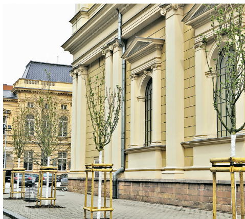
Javori na náměstí Msgre Šrámka.

„Pracovníci našich technických služeb pokáceli v lokalitě Šalamouna, v zadním Přívozu, v parku Milady Horákové a Komenského sadech loni 34 stromů. Šlo převážně o zcela suché stromy nebo stromy s výrazně sníženým zdravotním stavem. Na podzim tito pracovníci také ořezávali suché větve stromů převážně v parku Milady Horákové a Komenského sadech. Obnovou zeleně prošla i ulice Sadová, kde byly původní přestárlé a nemocné stromy a jiné dřeviny v době vegetačního klidu v loňském roce pokáceny. Hned v listopadu 2022 zde však bylo jen v úseku od Dětského ráje po ulici Na Bělidle vysazeno celkem 31 nových stromů, a to díky evropskému projektu. Ještě na podzim se podařilo vysadit také 21 nových stromů v ulicích Bachmačská a Zahradní a v Bezručově sadu. Další 9 nových javorů bylo vysazeno teď na jaře na náměstí Msgre Šrámka a 4 nové stromy přibudou také v sadu Boženy Němcové. Pokácení však v brzké době čeká ještě jírovec v ulici 30. dubna v parku Československých letců. U opakované tahové zkoušky byla zjištěna nestabilita kořenového systému vůči vývratu i vůči zlomu v místě měření. V lednu jsme proto zažádali o povolení kácení.“