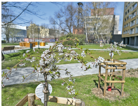
Stromy v Bezručově sadu.

„Jsou situace, kdy se kácení nevyhneme, jde například o nemocné nebo staré stromy. Ty mohou být pro své okolí nebezpečné. Uschlý strom se může zlomit i při relativně slabém větru a poškodit majetek nebo dokonce zdraví lidí. Ale i v těchto případech, pokud nehrozí akutní ohrožení okolí, musíme postupovat podle jasně definovaných podmínek. V žádném případě nemůžeme jen tak poslat pracovníky s pilami strom pokácet. V první řadě musíme zažádat o povolení, které schvaluje hned několik institucí a jeho vyřízení trvá i několik měsíců. Teprve po schválení můžeme kácet. Většinou se snažíme pokácený strom nahradit jiným mladým stromem.“