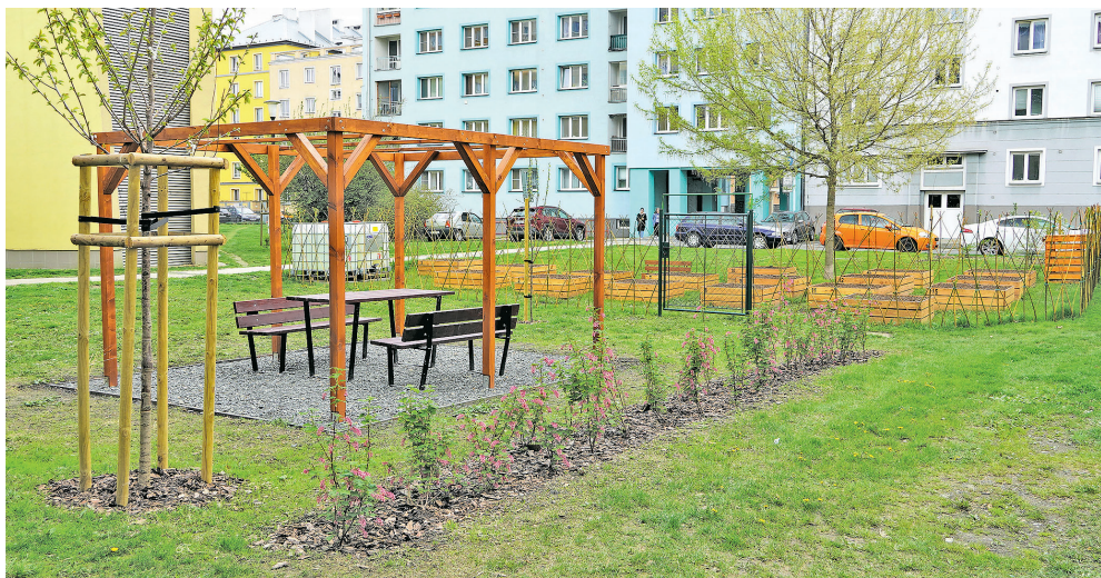
Proměnou prošel i komunitní park Jindřich.

„V uplynulých ročnících lidé navrhovali projekty v různých lokalitách obvodu, v některých případech jsme museli dokonce vhodné umístění hledat. Po důkladném zvážení jsme se proto rozhodli, že nyní budou občané moci rozhodnout o tom, která část území městského obvodu, ať již ulice, vnitroblok, náměstí či park, bude proměněna. Nemusí již sami navrhovat konkrétní projekty, ale budou moci vybrat konkrétní lokalitu. Navíc se mohou zapojit do veřejného pojednávání a promítnout své představy