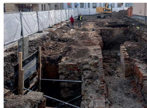
V listopadu loňského roku zde byly zahájeny přípravné práce a archeologický výzkum. Stavební práce by měly započít v roce 2024.

strana mince je pro nás velmi podstatná, protože centrum je výkladní skříň našeho města,“ pokračuje místostarostka. „Polyfunkční domy a další stavby přinášejí významnou přidanou hodnotu všem Ostravanům: nové možnosti bydlení, nové služby v komerčních částech budovy, parkovací místa pro jejich obyvatele a uživatele... A u větších investic, kdy jsou součástí objektu třeba právě malé obchůdky, v neposlední řadě také nová pracovní místa. Privátní investice hrají při rozvoji centra nezastupitelnou roli.“