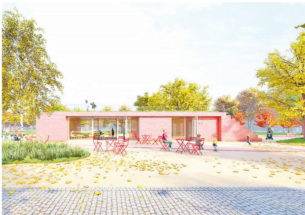
Sad nabídne spoustu místa k hrám a k posezení.

Předpokládané náklady na realizaci proměny parku jsou 250 mil. Kč bez DPH . Začátek realizace se odhaduje na rok 2026. Nejbližšími kroky jsou nyní podpis smlouvy s vítězem soutěže a příprava projektové dokumentace. S novou podobou sadu se veřejnost může blíže seznámit na výstavě soutěžních návrhů, kterou pořádá ateliér MAPPA ve svém prostoru Za výlohou od 30. 3. do 24. 5. Zahájena bude vernisáží 29. 3. v 17 hodin. Na květen pak ateliér k výstavě plánuje doprovodné akce.