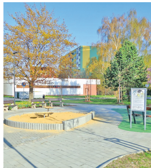
Regenerace sídliště Fifejdy II - XII. Etapa.

pořádku nejen silnice a chodníky, ale provádíme i sadové úpravy, budujeme nová parkovací místa, obnovujeme veřejné osvětlení, lavičky, odpadkové koše a další mobiliář.