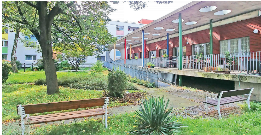
O zahradu klienti pravidelně pečují a zvelebují ji. Slouží nejen k odpočinku a relaxaci, ale konají se zde i grilovačky a různá setkání.

Cítíte, že nemáte dostatek sil se o sebe postarat? Nebo víte o člověku ve vašem okolí, domě nebo v rodině, jehož zdravotní stav či věk ho omezují natolik, že je odtržen od světa a je závislý na pomoci zvenčí? Neváhejte a zavolejte na 599 442 644 nebo 724 067 385. Případně nás navštivte v ulici Nádražní 110/970.