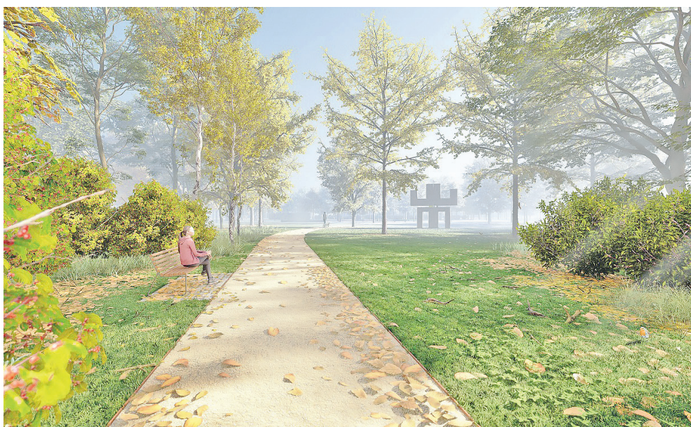
Nebudou chybět ani klidná místa určená k relaxaci.