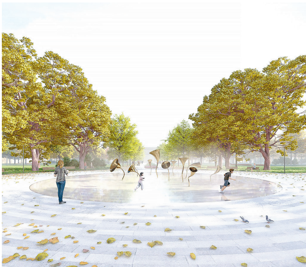
Přibude zde ovocný sad, promenáda a obnoven bude i vodní prvek.

Jedním z porotců soutěže byl i místostarosta