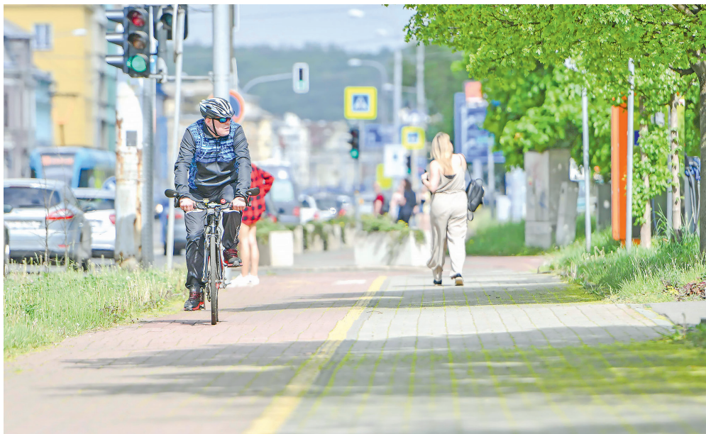
Koncepce navrhuje opatřit 261,7 km ostravských ulic, kde automobily jezdí 50 km/h, oddělenými, stavebně řešenými cyklostezkami.