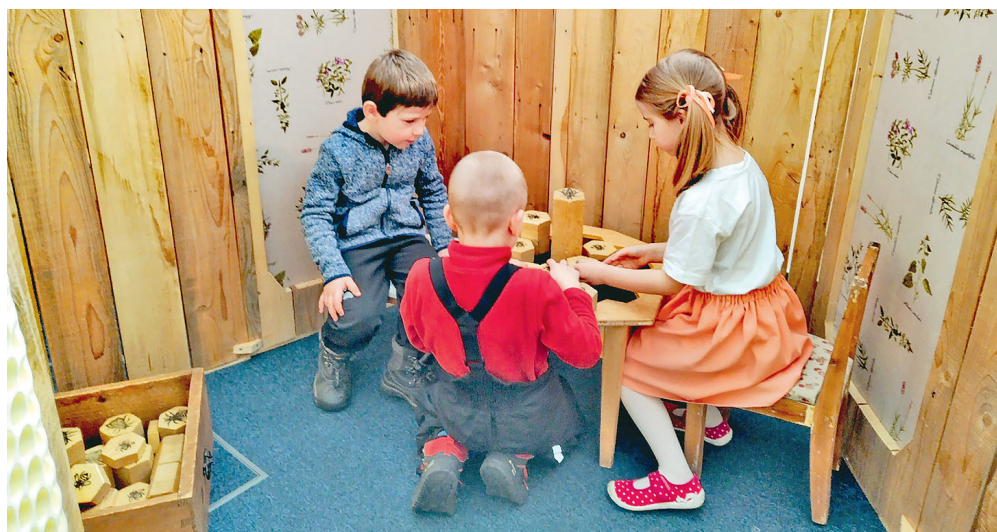
Děti z okolních mateřských škol, které se zúčastnily slavnostního otevření výstavy, včelí město naprosto zaujalo.

Výstavu, která zde bude až do 31. srpna 2023, můžete navštívit od úterý do pátku od 15 do 19 hodin, v sobotu od 10 do 18 hodin, v neděli pak od 14 do 18 hodin. V dopoledních hodinách pracovního týdne je vyhrazena školám. Ty se mohou objednávat prostřednictvím tel. č. 602 525 566 nebo e-mailu: produkce@ckv-ostava.cz .