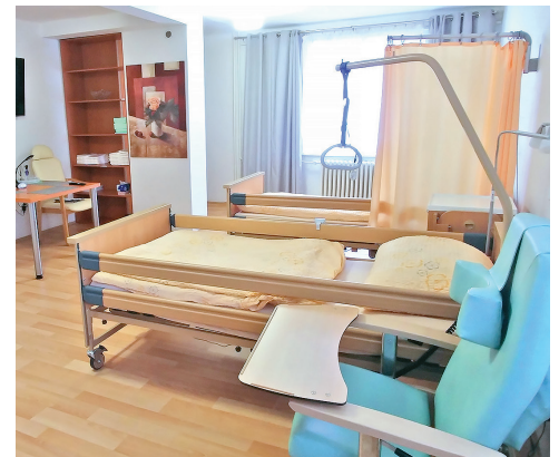
Odlehčovací služba v ulici Gajdošova 39 nabízí čtyři dvoulůžkové a dva jednolůžkové pokoje.

Rezervujte si termíny pobytu na odlehčovací službě telefonicky: 599 442 643, 724 305 639 nebo nás navštivte osobně v ulici Nádražní 110/970.