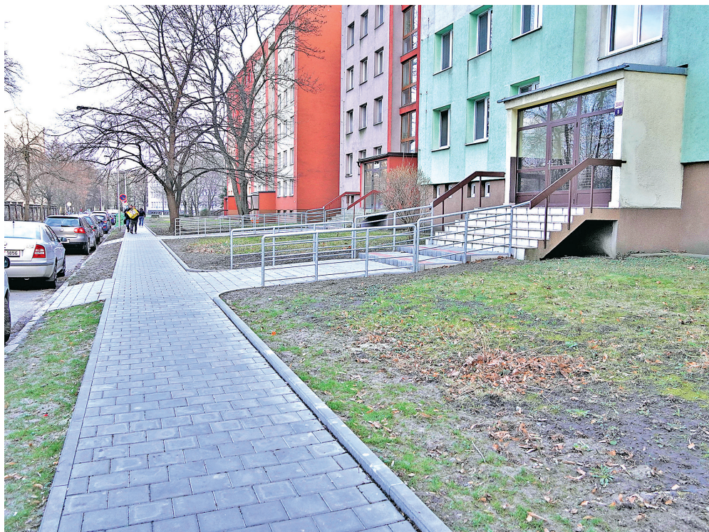
Zrekonstruovaná ulice Křížikova včetně chodníku. Akce původně v plánu rekonstrukcí nebyla, ovšem díky dobrému hospodaření v roce 2022 se jí podařilo zrealizovat.