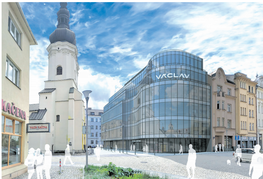
Pohled na polyfunkční dům Václav z ulice Zeyerovy.

„Vzhledem k okolní zástavbě bude celý polyfunkční objekt členěný do menších a výškově odstupňovaných částí tak, aby jeho vzhled odpovídal přirozené různorodosti okolní zástavby