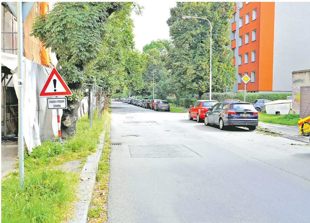
Původní stav na ulici Křížikova před rekonstrukcí.

Fifejdy a Šalamouna jsme v letech 2019–2022 proinvestovali 89,1 mil. Kč,“ říká místostarostka Vaňková. Na sídlišťích dáváme do