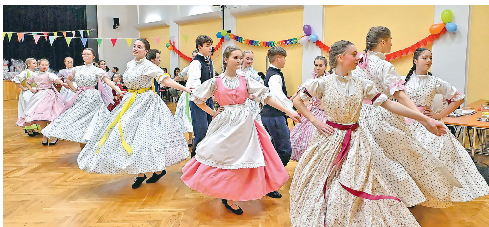
Krojovaný bál žáků tanečního oddělení Lidové konzervatoře.

době děti čeká několik vystoupení (Masopust Ostrava 2023, 10. Havířský bál, jarní Vynášební Mařeny, Zpěváček 2023). Více informací na www.lkms.cz .