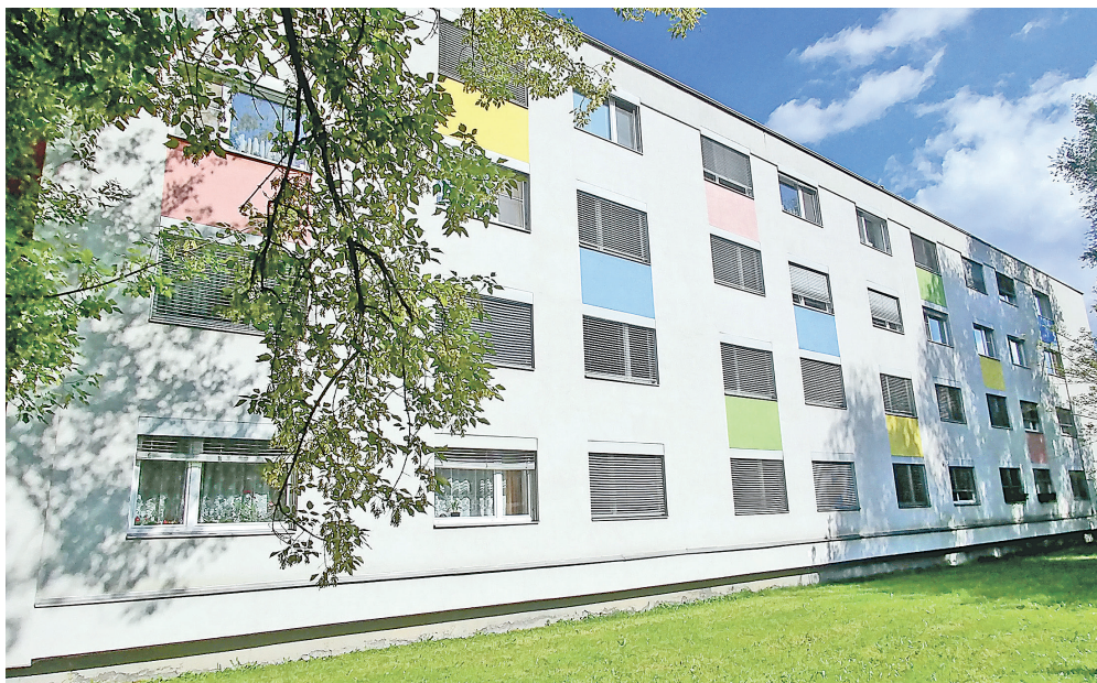
Pokud si klient domu s pečovatelskou službou objedná a zaplatí pomoc s nákupy, úklidem nebo osobní hygienou, docházejí pravidelně pečovatelky i sem.

Pečovatelská služba je určena pro klienty od 27 let s trvalým pobytem v městském obvodu Moravská Ostrava a Přívoz, kteří mají sníženou soběstačnost z důvodu věku, chronického onemocnění nebo zdravotního postižení. Celkem 17 pečovatelek pracuje 365 dnů v roce , a to od pondělí do pátku od 7 do 19 hodin a o víkendech a svátcích od 7 do 15.30 hodin. Jen v roce 2022 poskytly služby klientům v hodnotě zhruba 2,1 mil. korun.