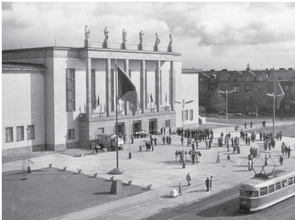
Dům kultury města Ostravy v roce 1963.

„Vzhledem k současné situaci jsme museli upustit od oslav, které jsme na letošek připravovali,