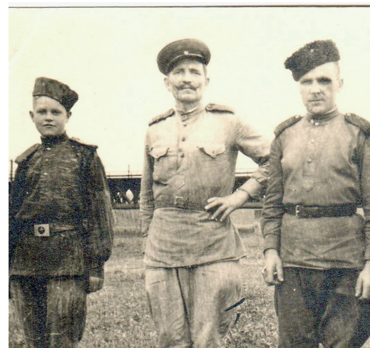
Príslušníci sovětského zásobovacího oddílu na Ostravsku