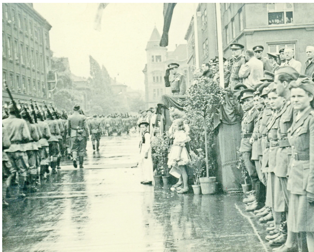
Přehlídka československé tankové brigády po osvobození

K dramatickým událostem došlo také před budovou pošty na rohu dnešní Přívozké a Dvořákovy ulice. Němečtí ženisté dostali úkol před ústupem vyhodit budovu do povětří a zničit tak tamní telefonní a telegrafní ústřednu, aby ji nemohli používat rudoarmějci. Poštovní zaměstnanci i obyvatelé okolních domů, kteří se obávali následků výbuchu, začali s vojáky diskutovat. Postarší paní Grünwaldová, snacha prvního českého starosty Moravské Ostravy Konstantina Grünwalda (1831–1918) se snažila Němce přesvědčit, aby zbytečně neriskovali životy obyvatel. Zatímco vojáci byli zaneprázdňeni dohoda- váním s Ostravany, několika mužům se podařilo využít nepozornosti Němců a odstranit nálože. Mezitím se od Masarykova náměstí přiblížil československý tank s podporou pěchoty, před kterým se ženisté dali na útěk. Z domu na protější straně Husova sadu bylo