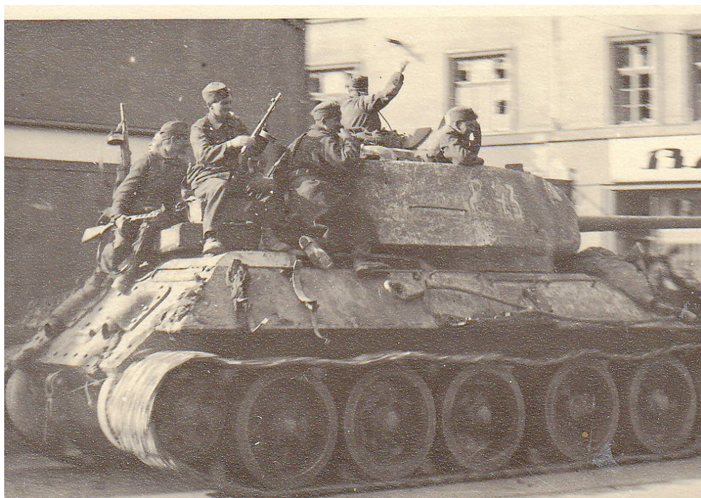
Sovětský tank se samopalníky přijíždí do centra města

Oddíly Rudé armády poslední dubnový den vstoupily do Moravské Ostravy ze dvou směrů. Hlavní útok byl veden od Zábřehu, kde se Sověti probili přes Odru. V odpoledních hodinách se pak přes Vítkovice dostali do centra města. Tohoto útoku se účastnili i příslušníci 1. československé samostatné tankové brigády v SSSR. V podvečer pak od Přívozu dorazily další sovětské jednotky přes narychlo opravený most u Petřkovic. Ten němečtí ženisté před ústupem pouze poškodili. Obecně Němci v této době již trpěli nedostatkem trhavin a armáda navíc čelila úpadku morálky a dezercím. Díky tomu byly některé mosty a průmyslové závody uchráněny před zničením.