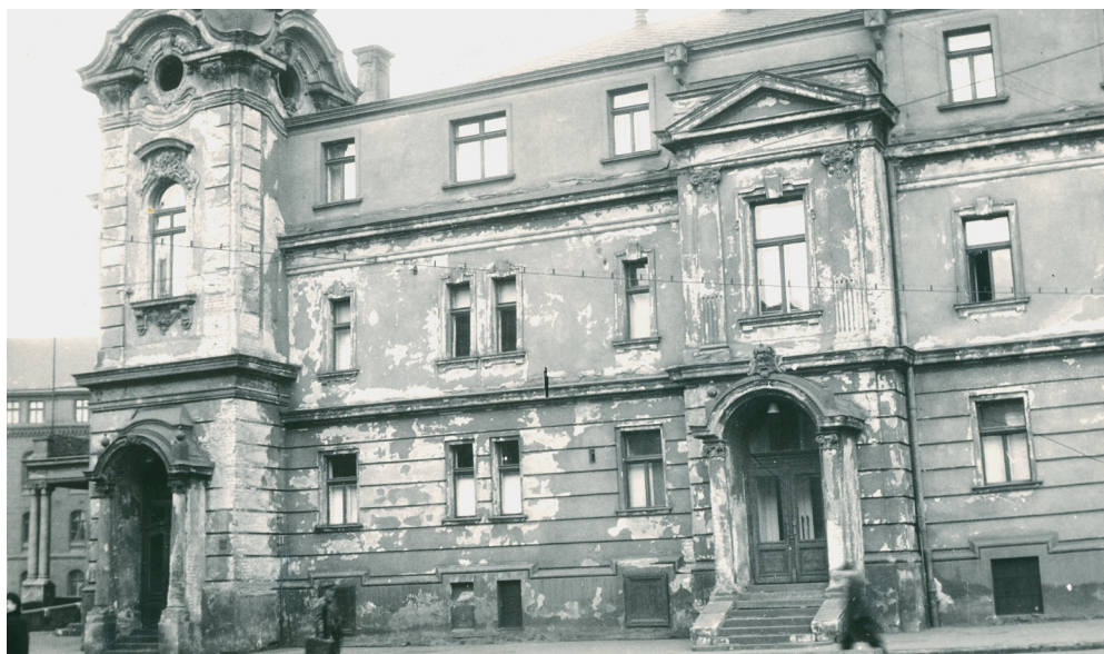
Divadlo bylo během války značně poškozeno.

Vraťme se ale zpátky do poválečných let, kdy se hned po osvobození začalo s rekonstrukcí. Kromě oprav budovy zvnějšku byla značná péče věnována i interiéru. Velkou proměnou prošlo především hlediště, které dostalo nové lustry a původní červená sedadla byla vyměně-