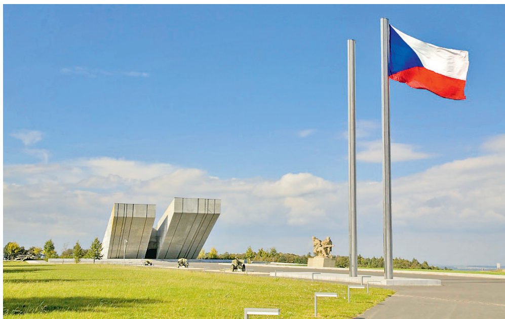
Památník ostravské operace, současný Národní památník II. světové války, byl otevřen v roce 1980.

Areál památníku se skládá z objektu samotného památníku, kolem něhož se nachází symbolický hřbitov, z bojového parku a ze správní budovy. Na symbolickém hřbitově je umístěno více než 13 000 destiček se jmény těch, kteří zemřeli v období 2. světové války. Jména patří jak vojákům 4. ukrajinského frontu, tak účastníkům domácího a zahraničního odboje ze severní Moravy a Slezska, příslušníkům 1. čs. armádního sboru či americkým pilotům nebo rumunským vojákům bojujícím v rámci 4. ukrajinského frontu. V bojovém parku se nachází vojenská technika používaná v daném období a ve správní budově se mimo návštěvnického zázemí (pokladna, toalety, dětský kou-