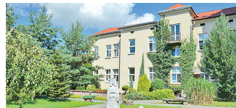
Na území městského obvodu Moravská Ostrava a Přívoz se nachází Domov Slunovrat v ulici Mlýnské 203/5.

Cílovou skupinou „Domovů se zvláštním režimem“ jsou osoby se sníženou soběstačností, zejména z důvodu stařecké demence, Alzheimerovy demence a dalších vážných zdravotních problémů.