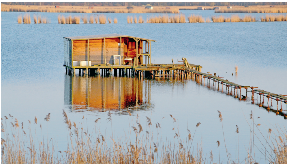
Snímek nepochází z jihovýchodní Asie, ale od Heřmanického rybníka, vzdáleného jen pár kilometrů od centra Ostravy. Dobrý tip na výlet...

Ludmila Kadrnková