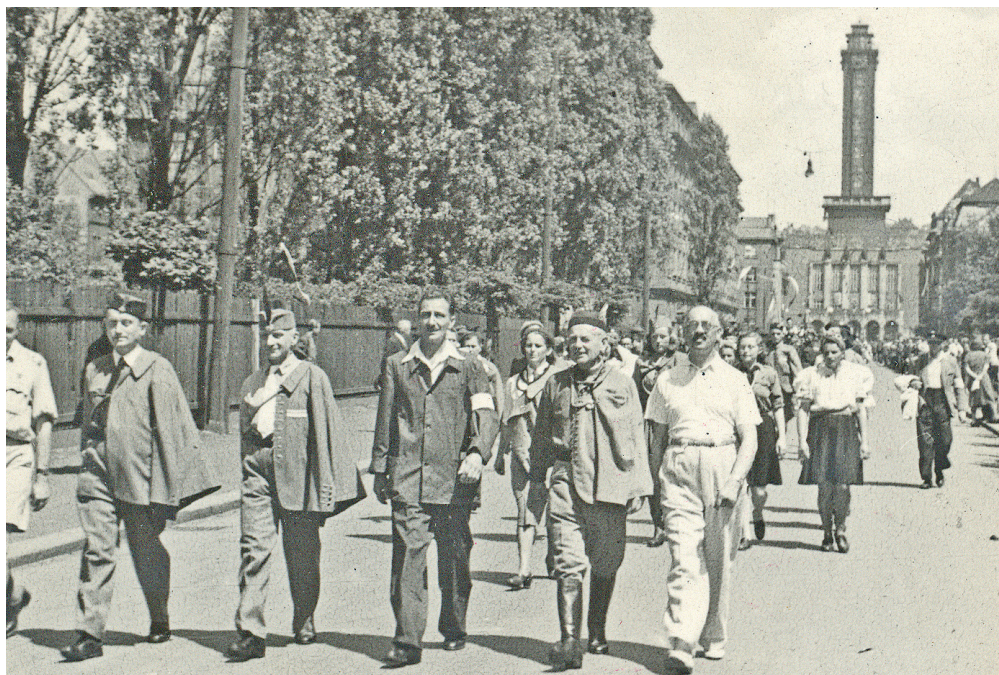
Prvomájový průvod v osvobozené Ostravě

vystřeleno několik ran, ale poté Němci rychle ustoupili.