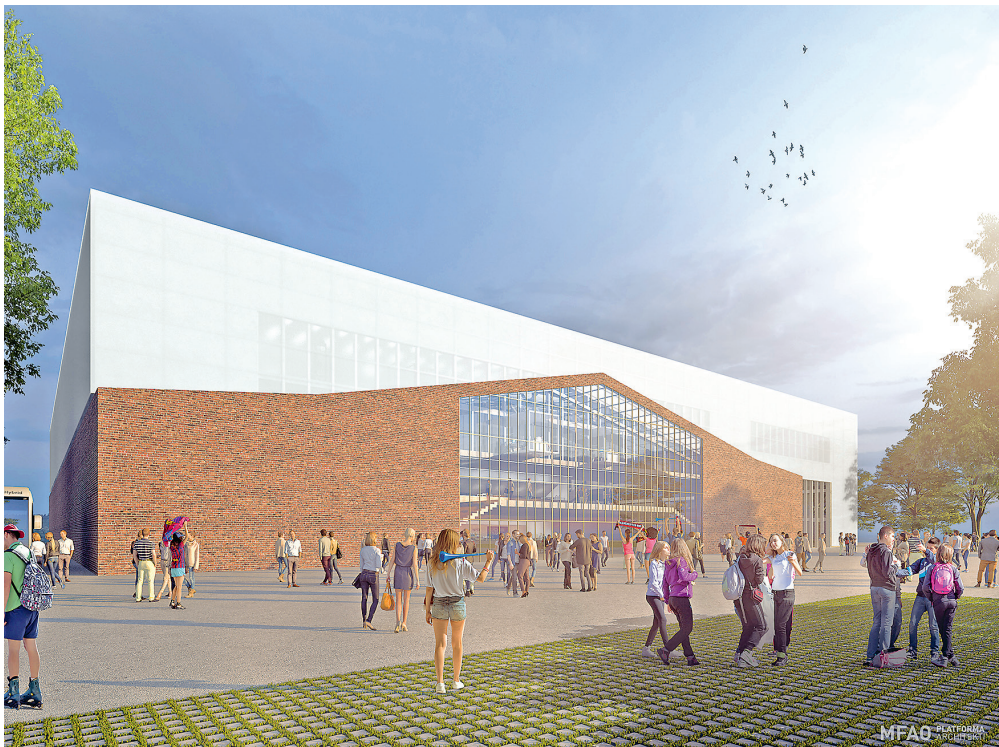
Vizualizace nové multifunkční haly.

V centru Ostravy by mohla zanedlouho vyrůst nová multifunkční sportovní hala s kapacitou až 3 tisíce diváckých míst pro pořádání větších jednorázových sportovních i kulturních akcí. Ta by měla jen těsně sousedit se sportovním areálem ZŠ Gen. Píky, který by rovněž měl v následujících letech projít velkou rekonstrukcí. Oba areály by tak synergicky na sebe navazovaly a poskytovaly velmi kvalitní zázemí pro celou škálu malých i velkých sportovních akcí.