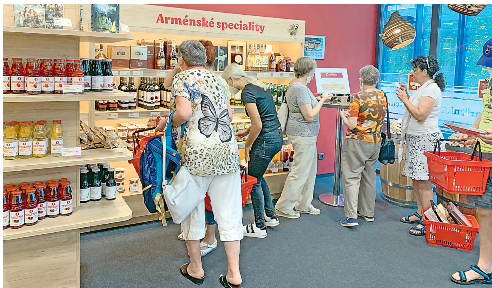
První zájezd do výrobního závodu Marlenka si všichni užili.