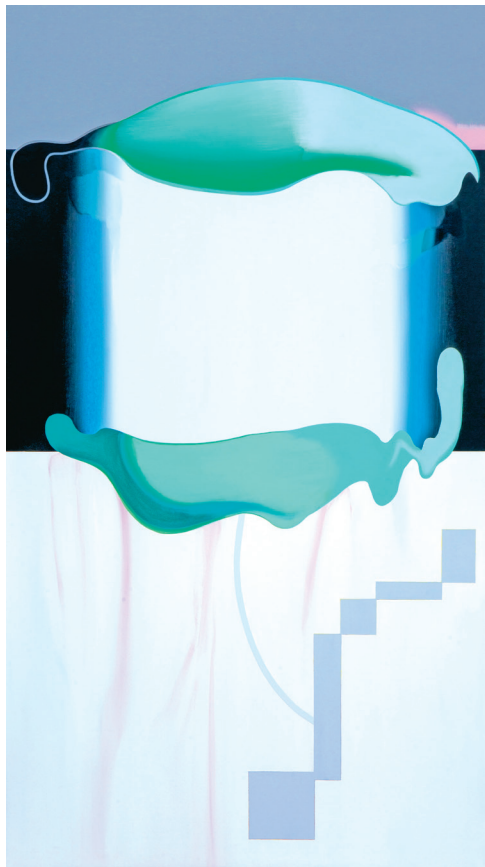
Multitasking 7, 200x110, akryl na plátně.