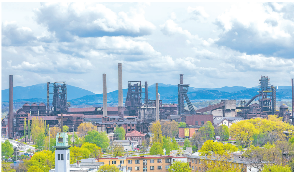
Panorama Dolních Vítkovic – národní kulturní památky.

Areál Dolní Vítkovice (DOV) zaujímá jedno z předních míst v žebříčku nejatraktivnějších turistických cílů v České republice. V roce 2019 přijelo na vlastní oči spatřit a zažít jedinečné industriální dědictví rekordních více než 1,6 milionu návštěvníků, ať už z Česka či z různých koutů světa. Z centra to máme do Dolních Vítkovic jen „pár“ minut pěšky nebo několik málo zastávek tramvají: značná část 20hektarového památkového komplexu totiž leží na území našeho obvodu.