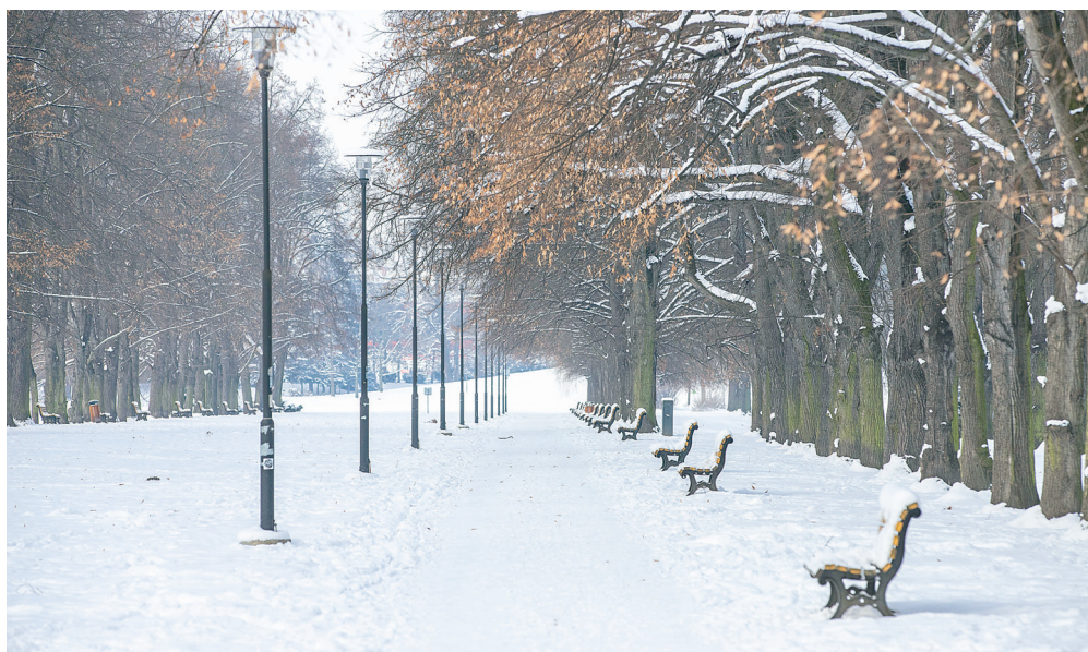
I do Ostravy dorazila na pár dnů paní Zima, celé město zpomalilo a utichlo. Sněhová peřina pokrývala domy, cesty, chodníky i parky. Takto zachytil zimní atmosféru v našem obvodu Adolf Horsinka.