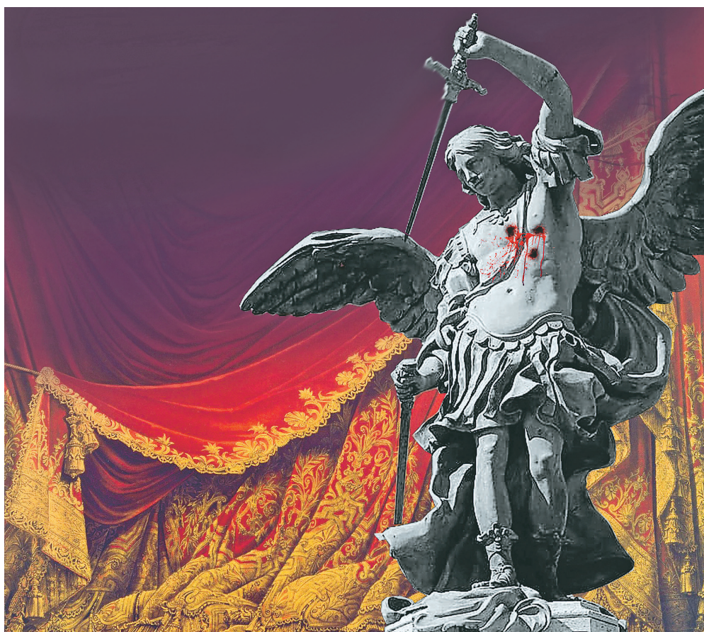
Autorem návrhu vizuálu i scény k operě je přímo scénograf Daniel Dvořák. Scéna symbolizuje oponu pařížské opery s jedním z andělů z Andělského hradu v Římě, kde děj opery vrcholí. © Daniel Dvořák

Všechna představení začínají vždy v 17 hodin na Youtube kanále DLO a jsou zdarma. Odkazy na zhlédnutí najdete na webu www.dlo-ostrava.cz .