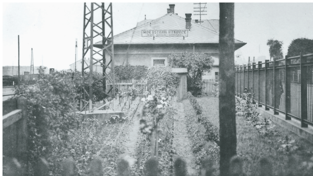
Okrasná zahrada u výpravní budovy, Moravská Ostrava Vítkovice, 30. léta 20. století.

Koncesní listina, kromě podmínky zahájení provozu od 1. ledna 1871, měla i ustanovení, že dráha může být prozatímně vybudována „o jedné koleji s nutně výhybnými kolejemi“. Dráha nezískala státní garanci, neboť byla považována za dráhu průmyslovou. Trasa dráhy byla projektována údolím řeky Ostravice, která v té době tvořila zhruba (tok řeky se proti geodetic-