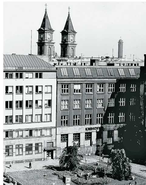
Bývalá budova knihovny na nám. Dr. E. Beneše.