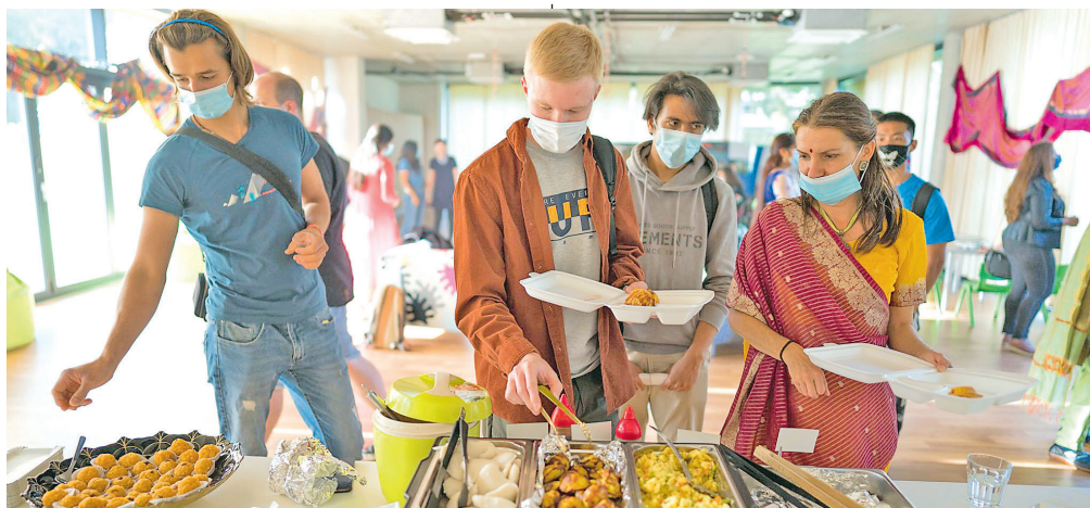
Ostrava Expat centrum pořádá nejrůznější komunitní akce, některé i s ochutnávkou tradiční kuchyně dané země.

Hlavní cílovou skupinou ostravského Expat centra, kterému městský obvod Moravská Ostrava a Přívoz poskytuje prostory za výhodných podmínek, jsou zahraniční odborníci kreativních, manažerských, výzkumných, a akademických profesí, jichž je v našem regionu nedostatek. Centrum je také klíčovým partnerem místních zahraničních firem.