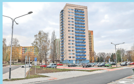
Sídliště Fifejdy čeká další etapa regenerace.

Více informací naleznete na webových stránkách obvodu www.moap.cz , informovat budeme také prostřednictvím Facebooku a Mobilním rozhlasem.