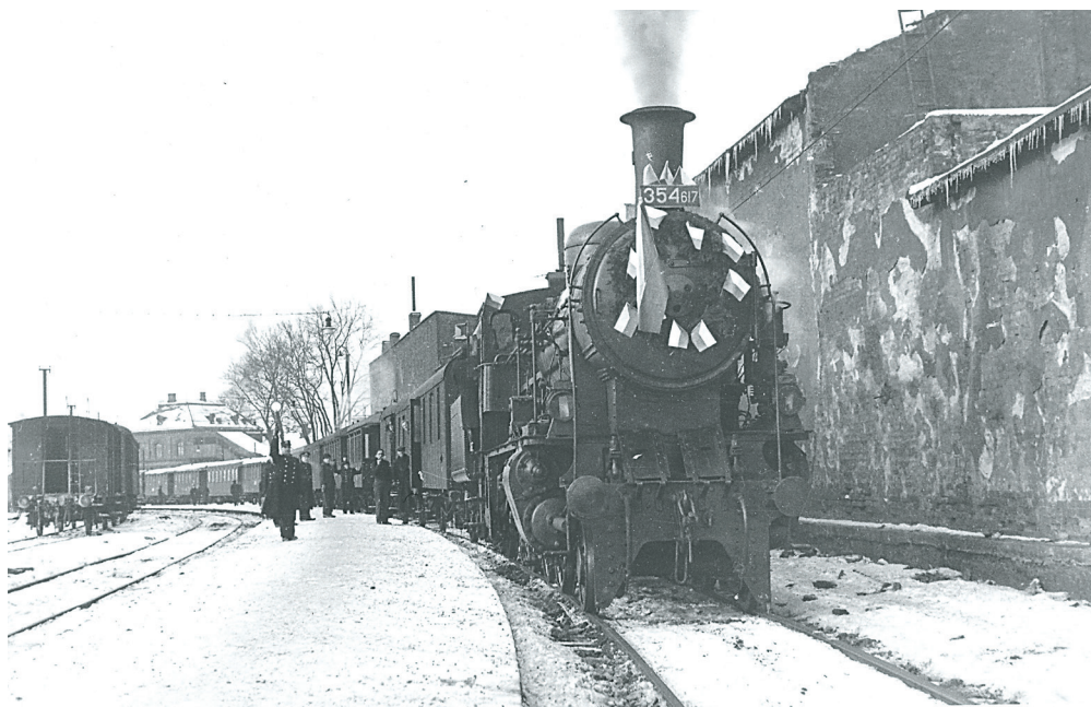
Slavnostní vlak do Frýdlantu nad Ostravicí k 75. výročí Ostravsko-frýdlantské dráhy, Ostrava hlavní nádraží, 17. ledna 1946.

Třicet čtyři kilometrů dlouhá trasa z Moravské Ostravy a Přívozu do Frýdlantu nad Ostravicí slaví 150 let od svého vzniku. Důležitou roli při jejím vzniku sehrál koncesní zákon z roku 1854, kterým se rakouská vláda vracela k podpoře soukromého podnikání v Rakousko-Uhersku. Dokonce císař František Josef I. osobním listem projevil přání, aby stavby drah přispěly k zaměstnanosti a oživily válkou zpustošenou krajinu. Podporu vlády tak získaly i méně výnosné projekty, mezi něž se zařadila i Ostravsko-frýdlantská dráha. Podařilo se to ještě před krizovým obdobím v roce 1873.