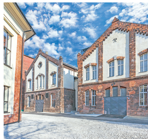
Rekonstruované budovy areálu Dolu Hlubina.