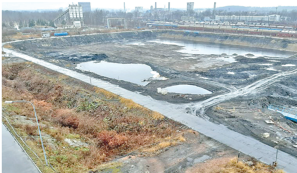
Laguna R3 po dokončení prací.

Ukládané odpady z rafinerské výroby a odpa-