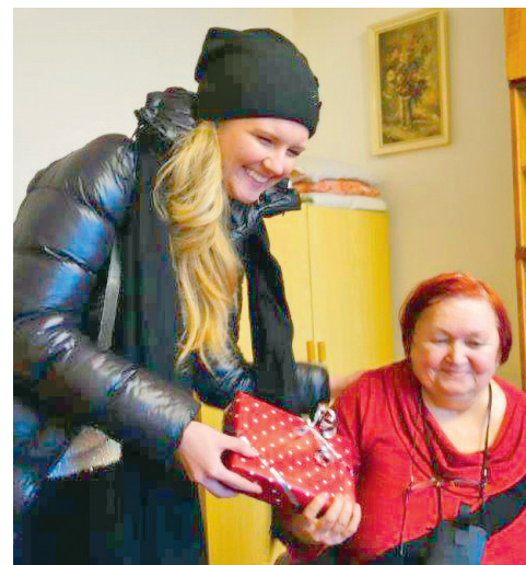
V loňském roce Ježíškova vnoúčata udělala radost také seniorům v našem obvodu.

Tento úžasný projekt opět maže veškeré hranice, Ježíškovými vnoúčaty jsou lidé napříč republikou. I přesto, že se setkávají naprosto cizí lidé, jedno společné téma – Vánoce – je vždy spojí. V našem obvodu jsme letos vytypovali šest osamělých seniorů, jejichž přání jsou zveřejněna na webových stránkách Ježíškových vnoúčat. Přání jsou různorodá – od zdravých balíčků, mixů čajů, přes povlečení, historický román nebo radiopřehrávač. Dárky naše seniory neskutečně potěší. Pro paní Jiřinu, která žije sama, děti již nemá a se vzdálenou rodinou se nestýká, bude dárek v podobě