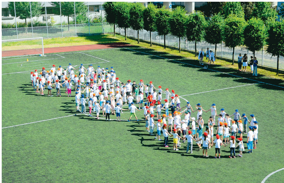
Děti ze ZŠ Zelená při společném projektu se Světem Techniky s názvem Tvoříme DNA.

„Dlouhodobě se snažíme být univerzální školou pro všechny. Ač to může znít jako fráze, jde o dost náročný koncept, protože musíme pokrýt široké spektrum potřeb společnosti tak, aby současně nedocházelo k poklesu kvality. V základních předmětech máme například posílenou dotaci matematiky a češtiny, angličtinu vyučujeme od 1. třídy a sportovního ducha dětí rozvíjíme v rámci projektu Sportuj v škole. Zároveň jsme byli první školou, která otevřela hřiště veřejnosti již v roce 2003. Pro podporu uměleckých směrů jsme přímo ve škole zřídili pobočku Základní umělecké školy Eduarda Marhuly s výtvarnými a hudebními obory. Snažíme se také neustále rozvíjet jazykové kompetence našich pedagogů v zahraničí, již šest let jsme úspěšnými žadateli programu Erasmus+. Novinkou je také to, že ZŠ Zelená byla vybrána jako pilotní škola MŠMT k ověřování modernizace předmětu Člověk a technika, pro rozvoj talentů jsme zapojeni do programu Talentmanagement, z čehož máme velkou radost. Cíleně pomáháme žákům i prostřednictvím kariérového poradenství a máme zde rovněž pracoviště se speciálním pedagogem a školní psycholožkou. Na škole působí aktivně školní parlament, který vydává školní časopis Řev parlamentu. Máme