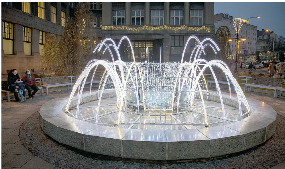
I letos se centrum města krásně rozzáří.

Výzdoby ale neubude. Pracovníci technických služeb ozdobí centrální obvod tisíci žárovkami, kilometry světelných řetězů a desítkami speciálních dekorů. K několika změnám ale přece jen dojde i ve výzdobě. „Loňské barevné blikající slavnostní osvětlení stromů po obvodu Masarykova náměstí bude letos vyměněno za čisté bílé. Změna také čeká i nasvícení vánočního stromu na Masarykově náměstí, a to s ohledem