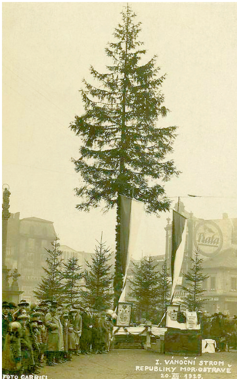
První vánoční strom republiky na Masarykově náměstí, 1925.