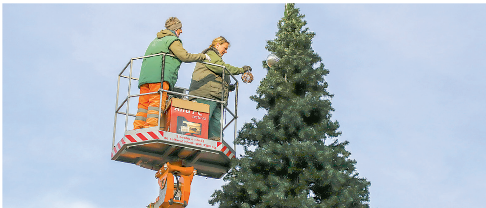
Pracovníci technických služeb při výzdobě vánočního stromu na Masarykově náměstí.

V průměru 90 pracovníků Technických služeb Moravská Ostrava a Přívoz udržuje v zimě denně jen na ranní směně zhruba 150 km chodníků, 60 km cest, 205 přechodů pro chodce a 60 čekáren a další veřejné plochy v našem obvodu.