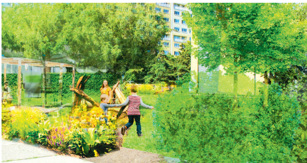
V návrhu komunitního parku Jindřich nechybí dětská dřevěná průlezka, pískoviště, kompostér, ovocné stromy ani vyvýšené záhony.

Od 20. května, kdy byl projekt participativního rozpočtu „Náš obvod“ oficiálně spuštěn, až do 21. července mohl kdokoli z vás poslat svůj návrh. Nakonec se sešlo celkem 16 různorodých a velmi kvalitních projektů. V těch drobnějších lidé navrhovali například nové lavičky, květinový záhon, basketbalové koše, pingpongové stoly nebo pískoviště. Přišly ale i rozsáhlejší projekty, které se pohybovaly ve vyšším cenovém rozpětí, jako je například sauna u Ostravice, veřejný záchod v Komenského sadech, komunitní zahrádky, pétanquová dráha, tančírna v parku a další. Nejvíce návrhů lidé směřovali do Komenského sadů, další pak byly