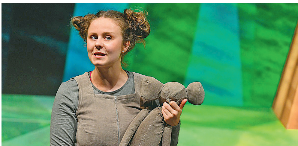
Premiéra pohádky Utíkej, myško, utíkej! byla již třikrát přeložena. Snad se jí v prosinci již všichni dočkáme.

V předvánočním čase budou moci diváci zhlédnout inscenaci Štědrý den malého Jakuba , a to hned dvakrát – 6. a 20. prosince vždy v 17 hodin. V plánu je také online premiéra pohádky Utíkej, myško, utíkej! , která se měla odehrát původně v dubnu, poté v červnu a nakonec v září, bohužel ani v jednom termínu to z důvodů platných opatření nebylo možné. Pokud budou autory