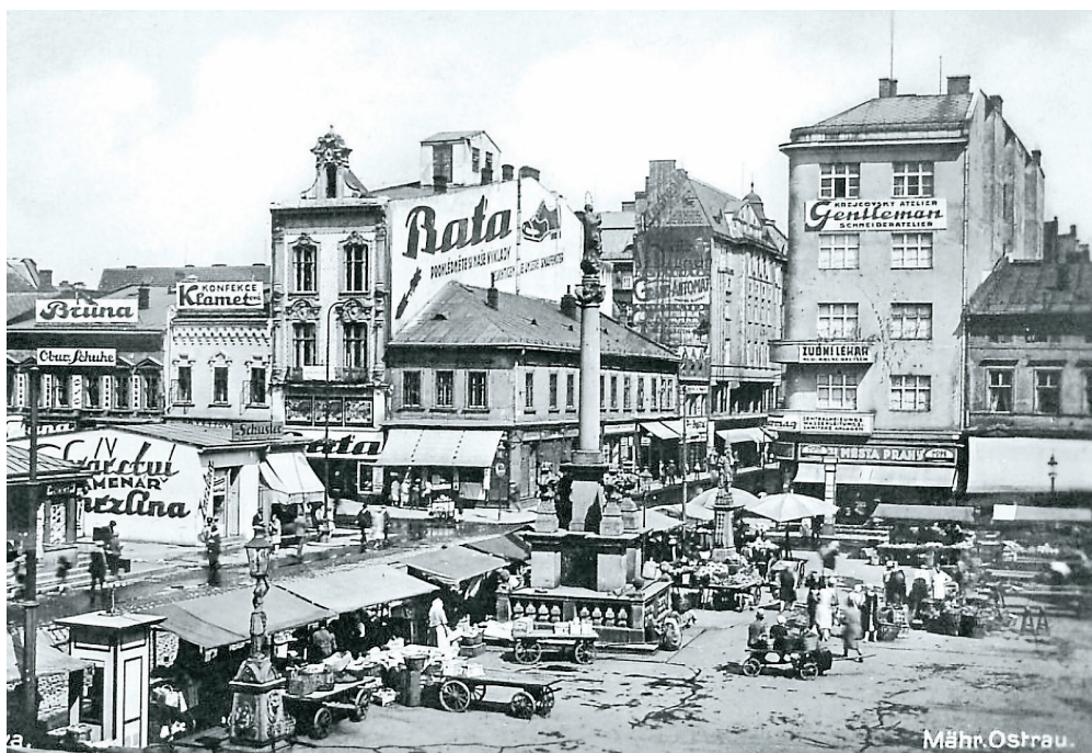
Za první republiky bývalo Masarykovo náměstí plné stánků, a to i v době předvánoční.

nán roku 1812. Ředitel pražského Stavovského divadla Jan Karel Liebich jej vztyčil na svém libeňském zámku Šilboch. Zpočátku byly stromečky zdobeny výhradně přírodními materiály – sušeným ovocem, ořechovými plody, slamenými ozdobami, šiškami apod. Okolo roku 1860 si movitější měšťané začali zdobit stromky svíčkami a také se na větvíčkách začaly objevovat perníčky a první skleněné ozdoby. Ve 2. polovině 20. století se pak uplatnily nejen ručně, ale již i sériově vyráběné skleněné ozdoby, trýpytivé řetězky apod. V posledních desetiletích pronikla na stromečky plastová výzdoba.