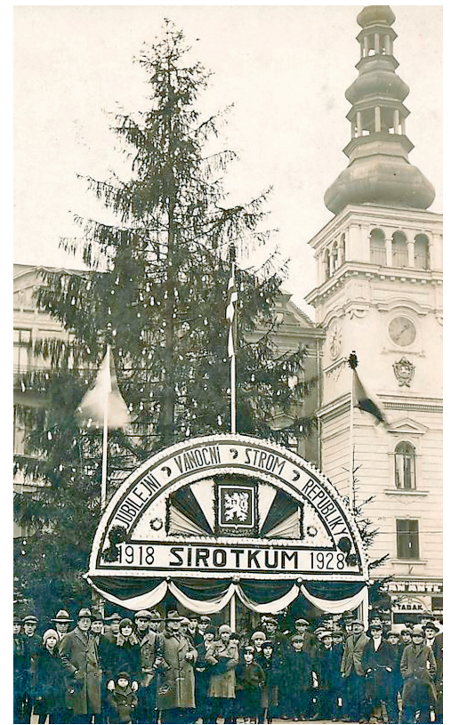
Jubilejní strom republiky v roce 1928.

S nejkrásnějšími svátky v roce je odedávna