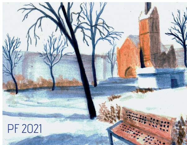
ilustrace Štěpán Wilkus

Spokojené prožít Vánoc, mnoho zdraví a štěstí v novém roce přeje vedení městského obvodu