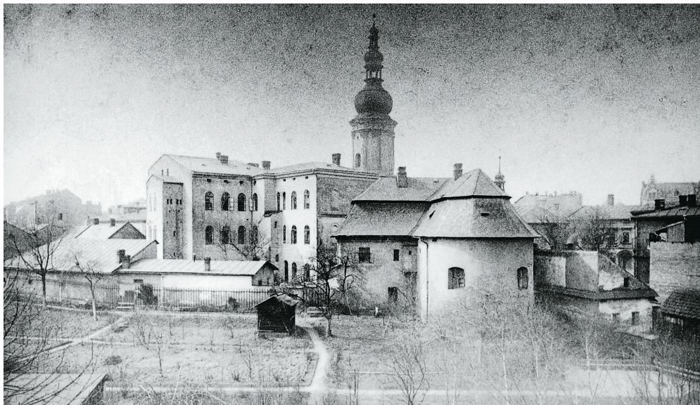
Z bývalé bašty, která byla součástí hradeb, se v průběhu let stala fara, která dala tomuto místu název Farská zahrada.