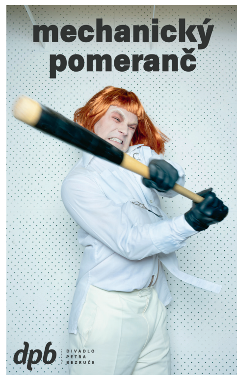
Kultovka Mechanický pomeranč měla svou premiéru v září.

hře nazvané Špinarka se zaměří na pozoruhodný osud této známé ostravské rodačky. Intimní portrét i epický příběh o nezávislosti, intrikách, odvaze a nezapomenutelné přítomnosti opravdové lásky bude mít premiéru v květnu 2021.