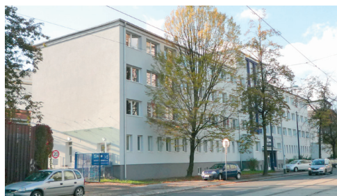
Sídlo firmy v ulici 1. máje v Moravské Ostravě

V našem obvodu působí firma, jejíž tradice sahá až do počátku minulého století. Výrobu kolejových vozidel zahájila už v roce 1900 v Butovicích u Studénky a před dvaceti lety se přestěhovala do Ostravy. Současný název Škoda Vagonka získala společnost v roce 2008, letos přidává ke svému jménu stále častěji neoficiální označení „nová“: během následujících dvou let totiž hodlá investovat do svého rozvoje jednu miliardu korun.