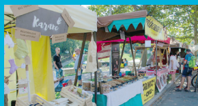
Pěší zóna Malá Kodaň