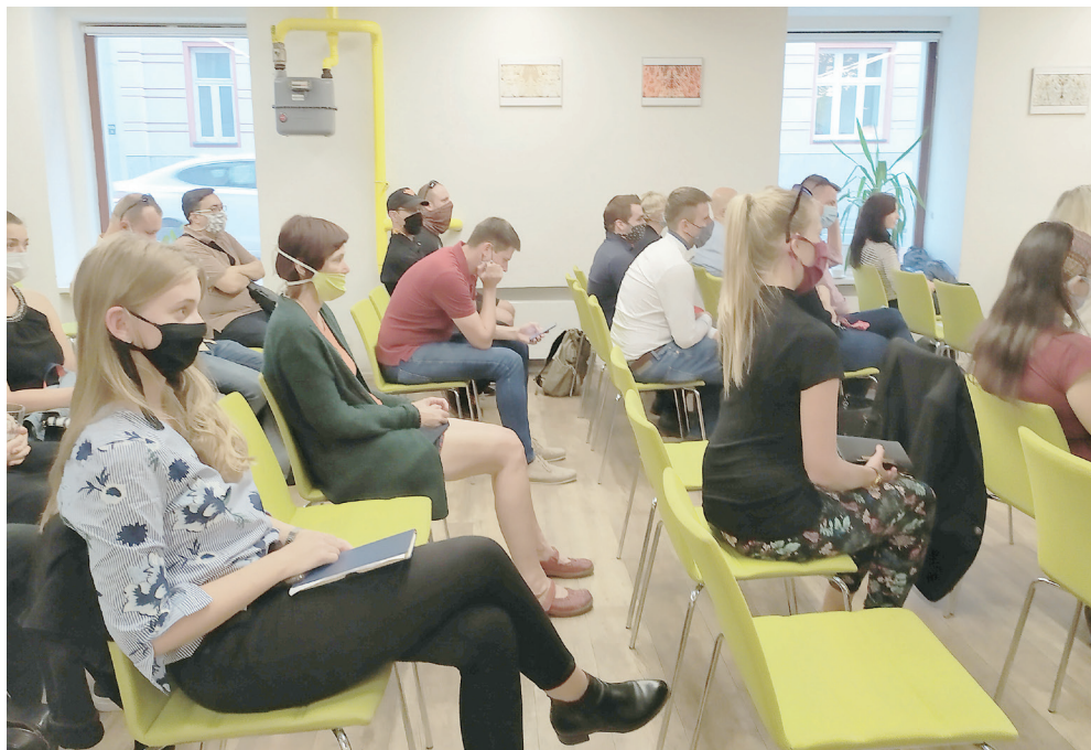
V Impact Hubu se ve středu 22. září sešli nejen autoři všech osmi vybraných projektů, ale i další příznivci. Ti mohli již v tento den dát svému vybranému projektu hlas.

Pítko by sloužilo k načerpání vody do lahve, k okamžitému osvěžení v letních dnech, k umytí rukou (Jiráskovo náměstí je blízko prodejny hranolek a dalšího občerstvení, které lidé jedí venku), a také k omytí zakoupeného ovoce či zeleniny, které si lidé mohou zakoupit v blízkém stánku s ovocem a zeleninou. Nové pítko