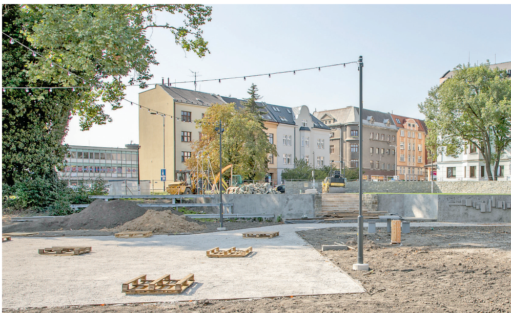
V druhé polovině září již byla pod platanem připravena ocelová konstrukce pro dřevěnou terasu se schody. Lidé si zde tak budou moci nejen posedět, ale třeba i zatančit.

stinných ploch. Půjde o připomínku původního sadu, který zde byl před mnoha lety. Jen jsme si trochu pohráli s geometrií výsadby. Pod stromy jsme umístili mlatovou plochu, která je sice náročnější na údržbu, ale jde o příjemný, světlý propustný, a hlavně přírodní povrch z místního kamene. Spojujícím prvkem obou úrovní je terasa, umístěná pod platanem, která chrání jeho kořenový systém a zároveň nabízí další možnosti využití. Tu jsme navázali na stávající opěrnou zídku schodiště, kterou jsme rovněž rekonstruovali. Její tvar nás inspiroval k vzniku malé vyhlídky.