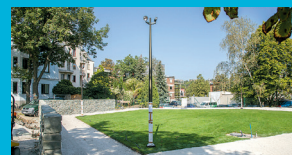
Rozhovor o nově zrekonstruované Farské zahradě