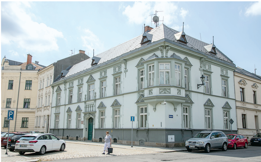
Budova Lidové konzervatoře a Múzické školy ve Wattově ulici v Ostravě-Přívozu.