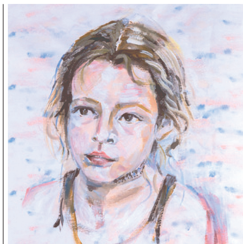
Jedna z kreseb žáků Lidové konzervatoře a Múzické školy.

menších dětí až po seniorský věk. Výuku umění u nás nabízíme všem, bez ohledu na zkoumání talentové způsobilosti, věku a zdravotního stavu. Důležitý je pro nás zájem člověka pracovat na sobě a touha rozvíjet se. Když je dobrá cesta, výsledek přijde. Jak se říká, talentu se stejně neubráníš. Někdy lidé ani netuší, jak kreativní a talentovaní jsou. Naši nejstarší studenti mívají i přes 90 let.“