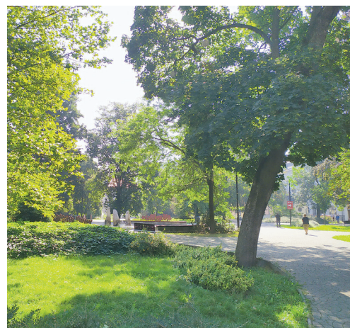
V první fázi obnovy zeleně v Husově sadu bude upravena část kolem Památníku bitvy u Zborova.

Celý projekt vyjde finančně na necelých 1,825 mil. Kč. Na revitalizaci Husova sadu a lokality kolem ZŠ Matiční poskytlo město Ostrava dotaci ve výši 250 tisíc Kč. Aktuálně je připravována také žádost o dotaci ze Státního fondu životního prostředí. Zbývající náklady hradí městský obvod.