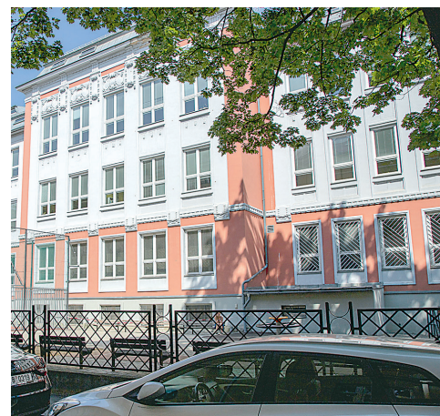
Budova v ulici 30. dubna 20 slouží žákům prvního stupně ZŠ Matiční.

Základní škola Matiční posílá pravidelně žáky třetího a sedmého ročníku na ozdravné pobyty, pořádá zájezdy do Anglie, spolupracuje s neziskovou organizací Moment, zapojila se do projektů Světová škola, Sportuj ve škole, Obědy do škol, Fajne školní bistro, Abeceda peněz a mnoha dalších. Žáci školy jsou úspěšní i v mnoha přírodovědných, matematických, jazykových, výtvarných i sportovních soutěžích, díky Technomatu také například i v soutěži Talenty pro firmy.