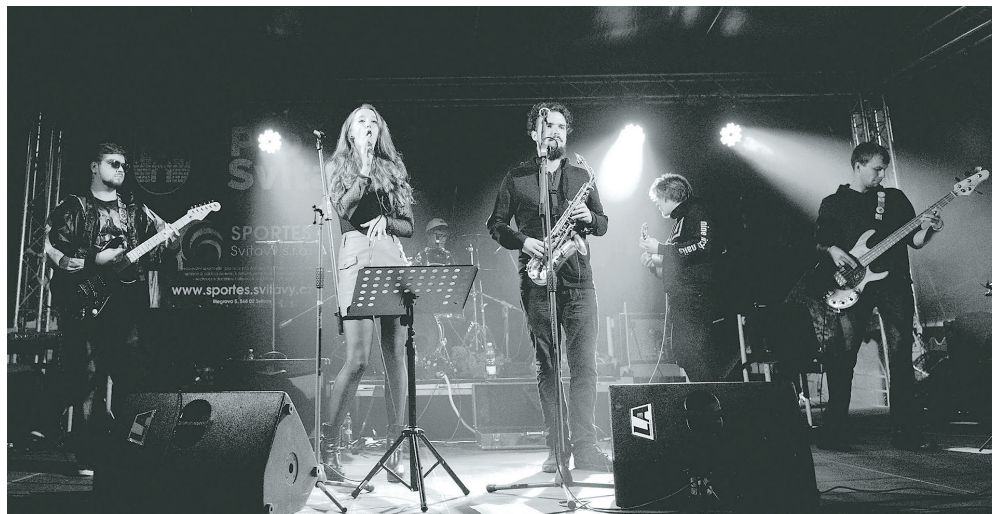
Kapela ze Svitav Dozing Brothers ukončí v neděli 20. září sérii promenádních koncertů pořádaných v Komenského sadech.