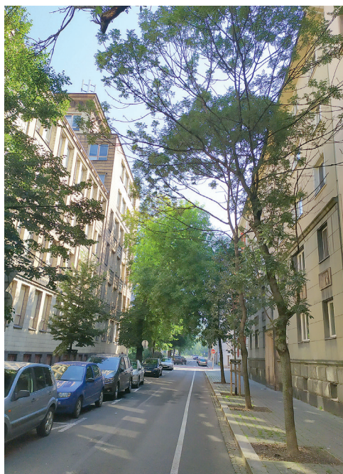
Kvetoucí stromy uchováme také v ulici Matiční, kde použijeme při výsadbě i speciální substrát.

Rada městského obvodu Moravská Ostrava a Přívoz schválila proto návrh na realizaci výsadby stromů hned v pěti lokalitách našeho obvodu. Obnova zeleně se týká ulic Husova, Herodova a Křížikova, ale i Husova sadu a okolí Základní školy Matiční. Revitalizace, kterou budou mít na starosti Technické služby Moravské Ostravy a Přívozu, začne v nejbližších podzimních dnech.