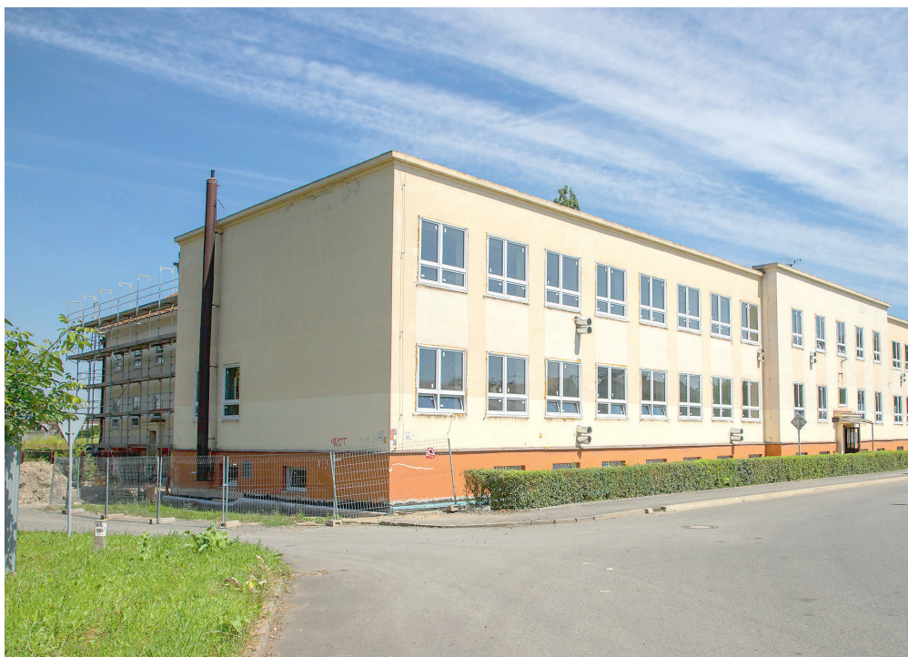
Hlavní budova odloučeného pracoviště Ibsenova 36 prochází celkovou rekonstrukcí. V době uzávěrky zde již byla vyměněna okna a připravovalo se zateplení objektu.