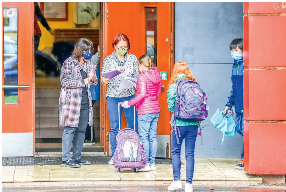
V polovině května se do škol vrátili devátáci a o dva týdny později i někteří žáci prvního stupně základních škol.