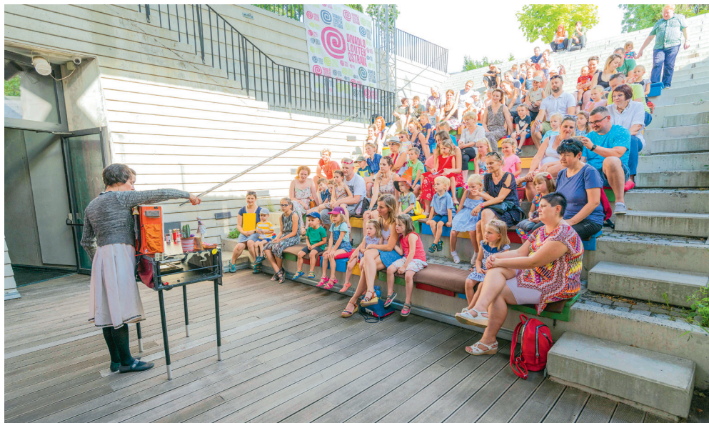
Herci z Divadla loutek Ostrava budou pro své diváky hrát ve venkovním amfiteátru.

Pro všechny příznivce loutkového divadla, tvořivé děti a jejich rodiče i prarodiče lektoři z DLO připravili cyklus tvořivých dílen s ná-