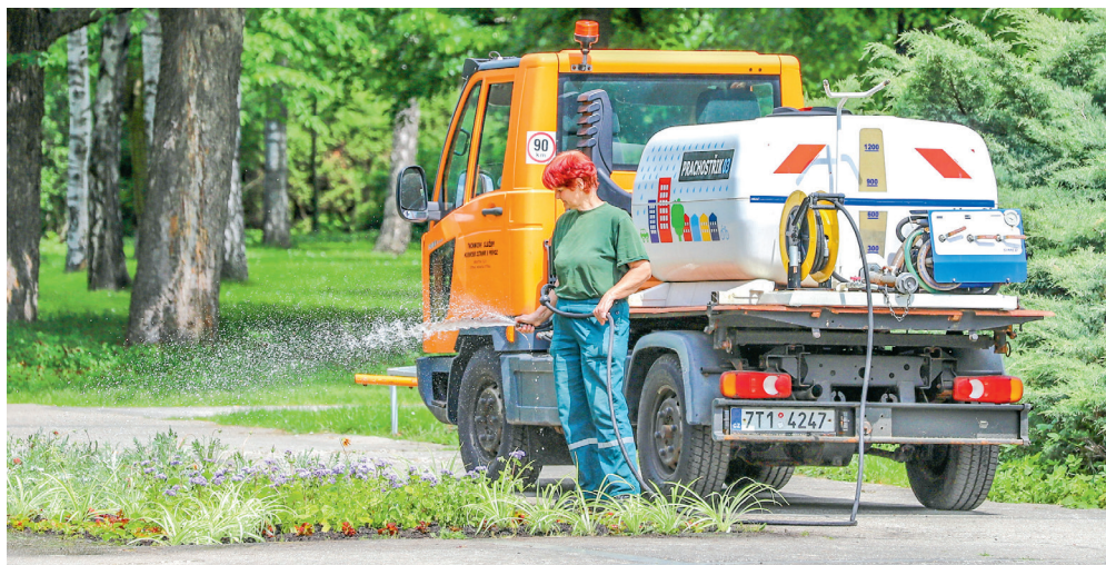
Pracovníci údržby zeleně Technických služeb Moravská Ostrava a Přívoz denně zalévají květiny, plejí záhony a provádějí další činnosti spojené s údržbou rostlin.