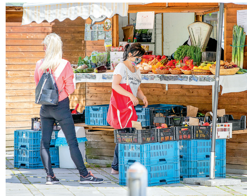
Nakupování regionálních potravin pod širým nebem je čím dál oblíbenější.

pódium a odehraje dvě představení Mandragory, jediné a nadčasové komedie z pera renesančního politika, filozofa a spisovatele Niccolò Machiavelliho. Představení začíná vždy ve 20.30 hodin a vstup je zdarma.