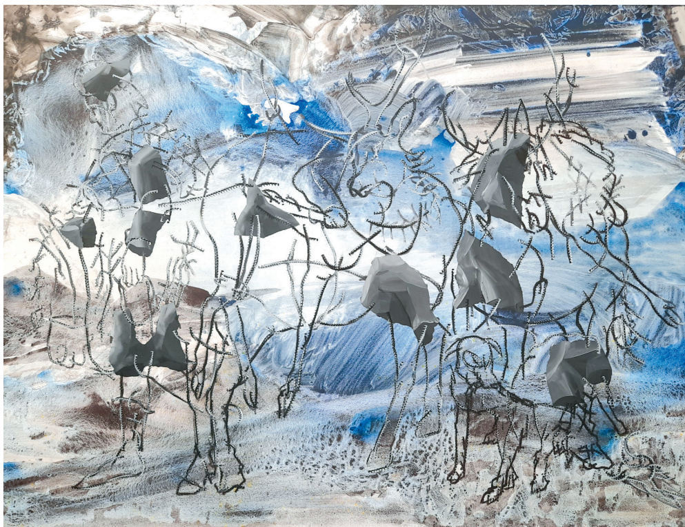
Deer Shibari, 2020, 181 x 260 cm, akryl, sololit