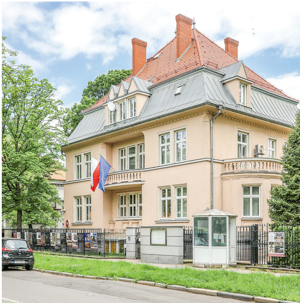
Polské velvyslanectví v Ostravě sídlí už dlouhá léta v nádherné historické budově v ulici Blahoslavo- vě v Moravské Ostravě.