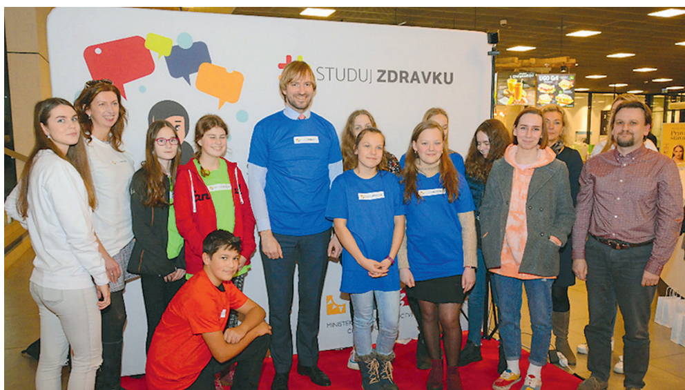
Ministr zdravotnictví ČR Adam Vojtěch (uprostřed) s žáky ZŠ Matiční v Ostravě.

Projekt Studuj zdravku realizuje ministerstvo zdravotnictví společně s Uníí zaměstnavatelských svazů ČR a ministerstva zdravotnictví za podpory odborových svazů. Jeho cílem je přilákat mladé lidi ke studiu na středních a vyšších zdravotnických odborných školách a k práci ve zdravotnictví vůbec.