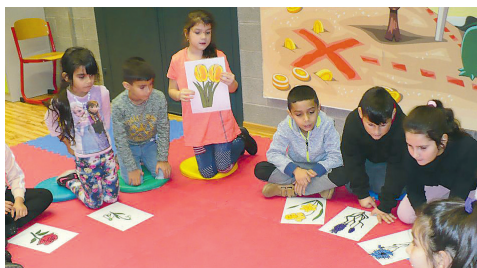
Děti při výukovém programu v ostravské zoologické zahradě.