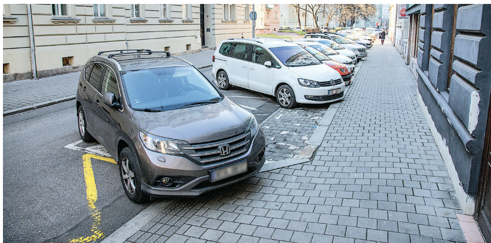
Nový parkovací systém bude řidiče navigovat k nejbližšímu volnému místu. Kromě toho by však měl detekovat také nevhodně stojící automobily.

Situace je tím složitější, že jde o relativně úzké a klikaté ulice a řidiči je projíždějí při hledání místa stále dokola a dokola. Mnoho netrpělivých řidičů pak parkuje na naprosto nevhodných místech, a to i za cenu pokuty. Už si však neuvědomují, že zablokováním průjezdu pro záchranné složky mohou způsobit nebezpečnou situaci.