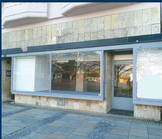
Masarykovo nám. 3/3 – prodejna – 166,17 m 2