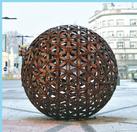
Koule rezavých květů je jedním ze tří uměleckých děl sochaře Čestmíra Sušky na území našeho obvodu.

Lukáš Jansa, radní pro oblast veřejného prostoru a architektury