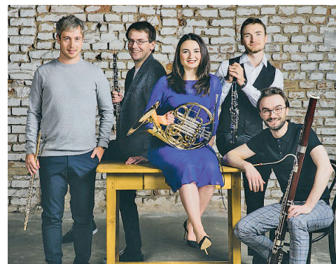
Dechový soubor Belfiato Quintet neboli Pěkný dech zahraje v únoru v Ostravě.

Dalším hostem řady komorních koncertů v Ostravě bude 17. února v Domě kultury města Ostravy dechový soubor Belfiato Quintet neboli Pěkný dech. Soubor vznikl v roce 2005 a tvoří ho spolužáci a nyní již absolventi hudební fakulty Akademie múzických umění v Praze. Perfektní zvládnutí nástrojů, tvořivost, čirá radost ze hry, to jsou atributy, kterými si tato pětice přátel získává publikum doma i v zahraničí.