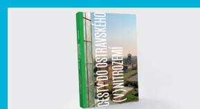
Cesty do ostravského (v)nitrozemí Strana VI