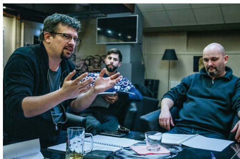
Herci Divadla Petra Bezruče při zkoušce strhujícího románu Dvorní šašci.

Na konci ledna nabídne Divadlo Petra Bezruče jednu exkluzivní českou premiéru – vůbec poprvé na českých jevištích ožije strhující román Viktora Fischla Dvorní šašci . Příběh čtyř vězňů a jednoho velitele tábora smrti okouzluje už Miloše Formana, který jej toužil natočit jako film. K tomu však nakonec nedošlo,