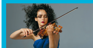
Ruská Vanessa Mae zahraje s JFO Strana III