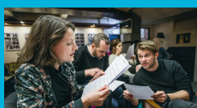
Premiéra u Bezručů Strana V