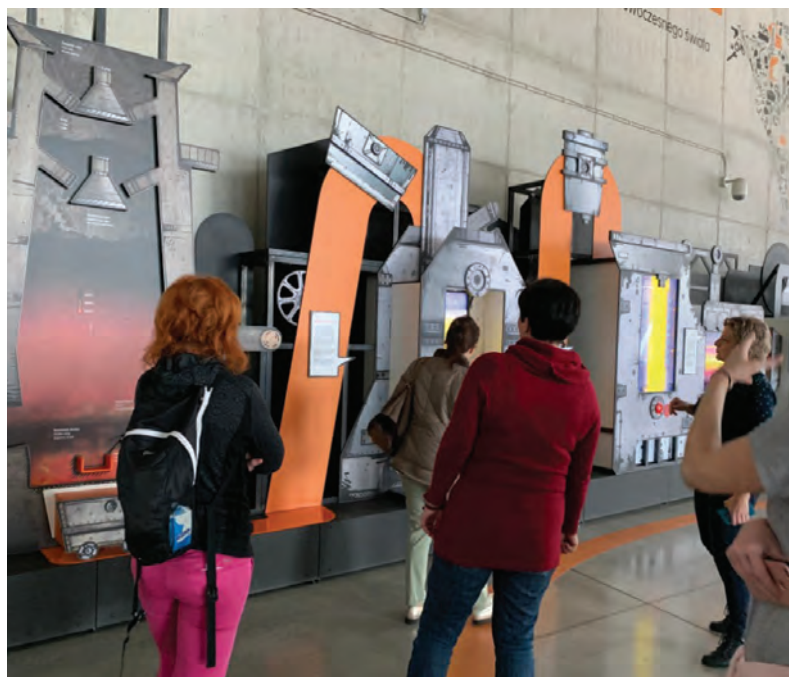
Projekt Technické vzdělávání v MŠ (CZ/FMP/11b/01/023) je podpořen dotací z Fondu malých projektů v rámci programu Interreg V-A Slovenská republika – Česká republika.