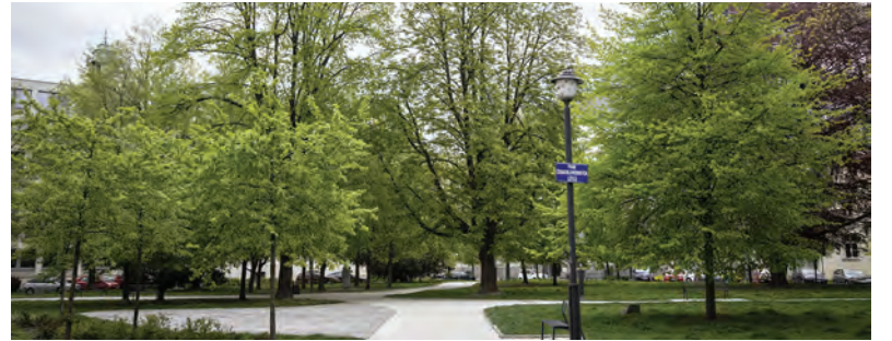
Park Čs. letců v Moravské Ostravě, v němž bude památník instalován, je vymezen ulicemi Na Desátém, 30. dubna, Přívozskou a Gregorovou. Na financování památníku se kromě města Ostravy a kraje bude podílet také náš městský obvod.