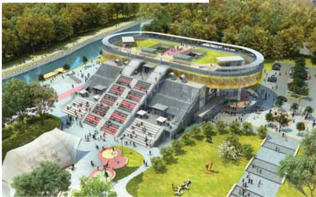
Součástí architektonického návrhu sportovní části areálu je mohutné schodiště i travnatá plocha na střeše, které budou nonstop přístupné veřejnosti.

Na území dnešní Černé louky kdysi stávaly ohrady a chlévy a pravidelně se zde konaly dobytčí trhy, kterými ročně prošly desítky tisíc prasat. Protože se tehdy veprům říkalo černý dobytek, dostala část Moravské Ostravy u řeky Ostravice název Černá louka