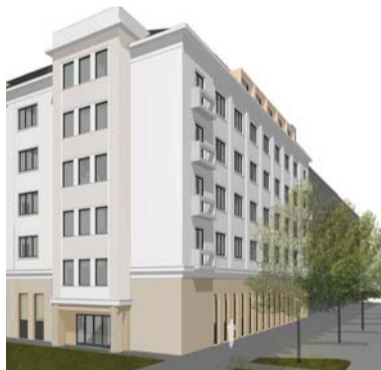
Vizualizace nové podoby objektu.

Vážení a milí čtenáři a čtenářky, existuje spousta různých vysvětlení, co je to fáma. Jedno však mají společné: je to nepravdivá zpráva, která vznikla na základě domněnek a čerpá z nekompletních či neověřených zdrojů. Jednu