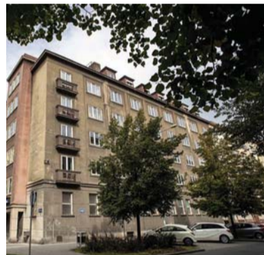
Současný stav budovy Českých drah.

Vážení a milí čtenáři a čtenářky, existuje spousta různých vysvětlení, co je to fáma. Jedno však mají společné: je to nepravdivá zpráva, která vznikla na základě domněnek a čerpá z nekompletních či neověřených zdrojů. Jednu