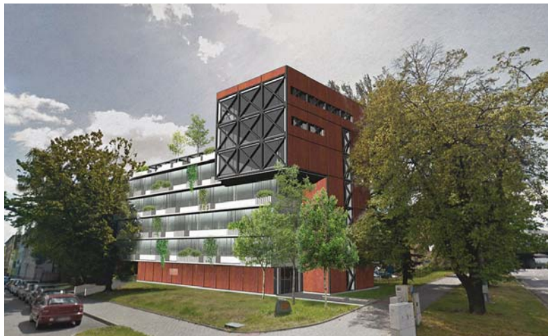
Koncept budovy nového sídla společnosti ette capital zpracovala architektonická kancelář Grido, architektura a design.

Část pozemku, která je určena ke stavbě, neumožňuje, aby investor dostavěl blok a navázal na zbylé torzo blokové zástavby. Budova je proto navržena jako solitér zasazený do zeleně. Na rohu je zakončena věží, která přesahuje zbývající část pětipodlažní budovy (s jedním podzemním podlažím) o další dvě podlaží. Pro podobu věže se staly volnou inspirací ostravské důlní těžební objekty.