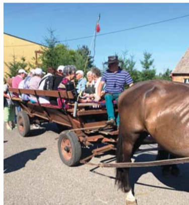
Projekt Se seniory od Ostravy po Čadcu je podpořen dotací z Fondu malých projektů v rámci programu Interreg V-A Slovenská republika – Česká republika.

531 tisíc korun, z dotace je hrazeno zhruba 451 tisíc korun, zbývající část hraří centrální obvod. Ten je také společně s městy Ostravou a Čadcou hlavním partnerem akce. První aktivitou, kterou navštívilo 250 českých a 50 slovenských zástupců, byl Den seniorů 1. října v Domě kultury města Ostravy. Další aktivity s názvy Kulturní den seniorů v Čadci, Senioři poznávají Ostravu a Senioři poznávají Čadcu budou navazovat.