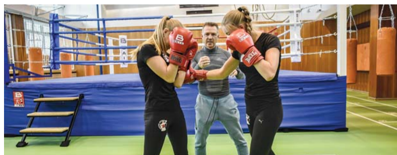
Nová Boxerská akademie má skvělé zázemí v ZŠ Nádražní.