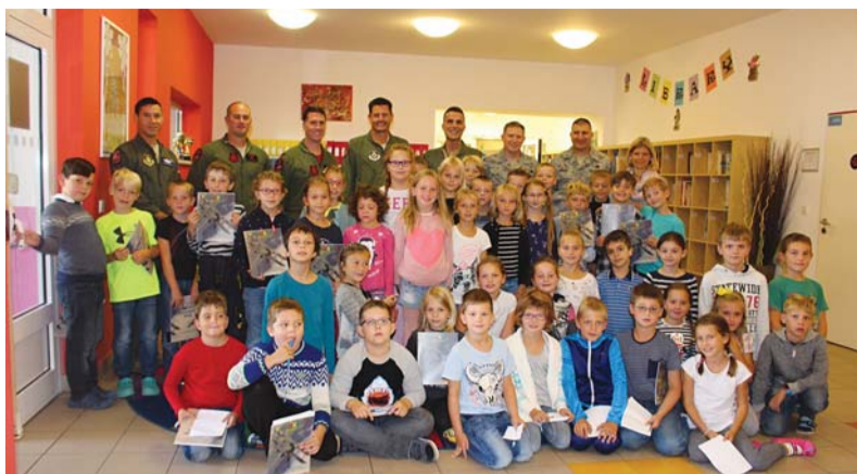
Žáci ZŠ Ostrčilova na společné fotografii s americkými piloty.

Dny NATO jsou významnou akcí Moravskoslezského kraje, kdy je k vidění největší středoevropská přehlídka vojenské a bezpečnostní techniky. Díky pilotům americké jednotky se část akce NATO přesunula i na Ostrčilku! Žáci z bilingvních tříd měli v pátek 15. září možnost setkat se přímo s piloty a navigátory letadel B1 a B52. Vznášeli spoustu dotazů, samozřejmě v angličtině, na jejich zajímavou práci. Za otázky by se nemusel stydět ani profesionální žurnalista! Po půlhodině strávené s výjimečnou návštěvou žáci odcházeli obohaceni o spoustu informací jak z pracovního, tak i soukromého života pilotů. Milují svíčkovou, guláš a většina z nich má rodiny a domácí mazlíčky. Pro nejstarší studenty ze 6. E si američtí piloti připravili prezentaci a ze zá-