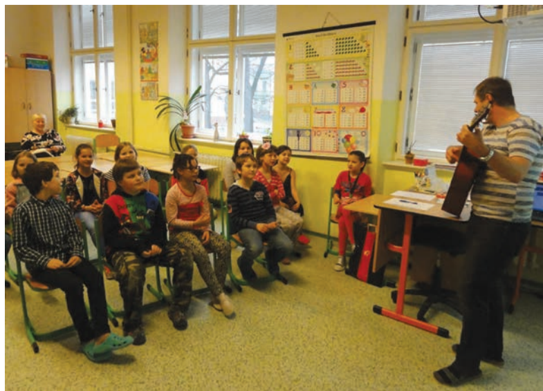
Žáci ZŠ Nádražní při výuce...