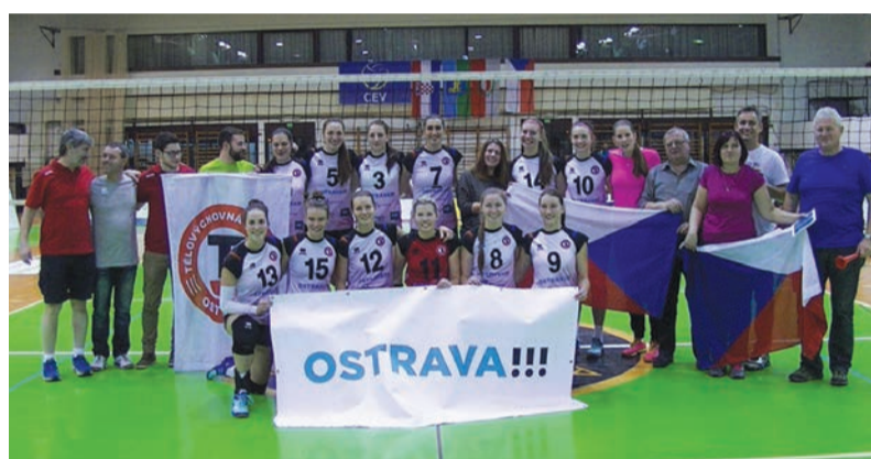
Extraligové volejbalistky TJ Ostrava.

Volejbalistky TJ Ostrava v extralize postupily ze třetího místa do prolínací části, ve které se utkají mezi sebou