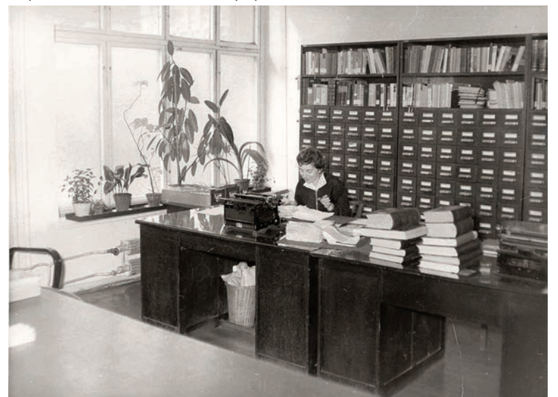
Rok 1956, poradna.