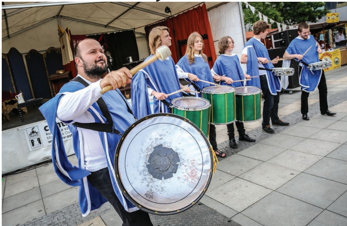
Loňská oslava Mezinárodního dne dětí soustředila pozornost na panovníka Karla IV., podobně nosné téma bude mít i letošní Den dětí.

Město ke zmiňnému jubileu připravilo také speciální webový stránky http://ostrava750.cz , kde jsou k dispozici informace o oslavách, pozvánky na