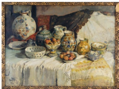
Oldřich Blažiček, Zátíší s lidovou keramikou, 1913, olej, plátno

Až do konce roku si mohou návštěvníci Galerie výtvarného umění v Ostravě prohlédnout dlouhodobou výstavu s názvem Tradice v proudu modernity. Výstava představuje jeden z proudů výtvarného umění, který byl v určitých obdobích přeceňován a v jiných bagatelizován, a tím je tradiční malba. Jedná se o díla zakladatelů generace české malby, jako byli Luděk Marold, Vojtěch Hynais nebo Václav Brožík, jejichž tvorba je představena především portrétními díly. Dále jsou zde zastoupeny obrazy malířů, kteří byli dlouhý čas neprávem spíše na okraji zájmu uměno- vědy, jako například Maxmilán Pirner nebo Beneš Knüpfer. A v neposlední řadě díla autorů, kteří se vymezili proti modernistickým proudům, ať již cíleně nebo nevědomky, v rovině formální či námětové. Přesto lze jejich tvorbu do jisté míry považovat za základnu pro následné avantgardní výboje. Často se jedná o autory, kteří byli střídavě ceněni a zavržováni, jako byli Julius Mařák, Alois Kalvoda, Václav Radimský a řada dalších. Na výstavě jsou dále prezentována díla malířů, jako jsou