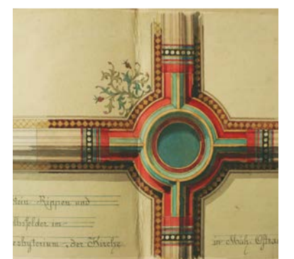
Návrh novogotické výmalby presbytáře.