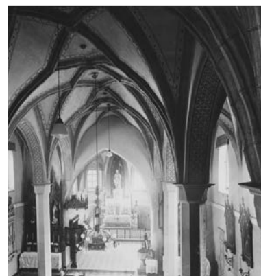
Klenba lodi kostela, foto, 1965.

li. Jistě ne zevnitř. V chrámu by totiž nespatrišli ani renesanční výmalbu ani barokní oltář a další stejně staré vybavení. Interiér kostela byl totiž koncem 19. století upraven do novogotické podoby podle návrhu arcibiskupského stavitele Richarda Völckela. Tak byl instalován boční oltář sv. Anny, nová kazatelna, nový hlavní oltář a zábradlí kruchty. Zdi a klenby vyzdobil malíř F. X. Schönbrunner. Také byla položena dlažba ze slezského mramoru. Úpravy interiéru uzavřela v roce 1899 instalace nových varhan z továrny bratří Riegrů v Krnově.