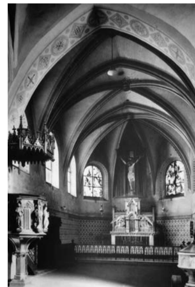
Presbytář kostela sv. Václava, 1. polovina 20. století

Kdybychom dostali možnost podívat se na Ostravu před sto lety, mnozí z nás by kostel sv. Václava ani nepoznali.