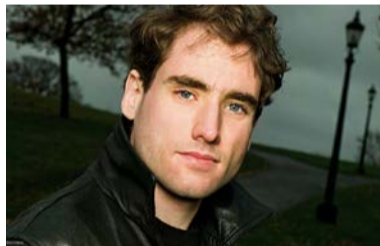
Fenomenální klavírista Boris Giltburg

Vstupenky pořídíte v Janáček pointu (vstupní prostor DKMO vlevo), online na www.jfo.cz nebo v pobočkách Ostravského informačního servisu.