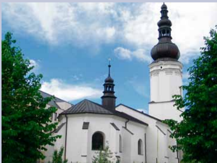
Kostel sv. Václava.

Lucie Augustinková Stavebně-historické průzkumy