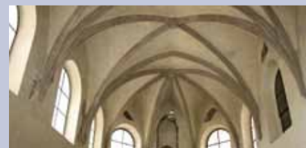
Žebrová klenba kostela sv. Václava.