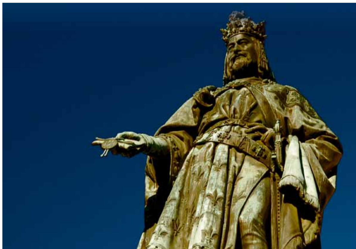
Den dětí je tentokrát inspirován 700. výročím narození Karla IV.

„Projekt letošních oslav Dne dětí, který připravilo Centrum kultury a vzdělávání Moravská Ostrava, se předchozím ročníkům vymyká úzkým spojením s významnou historickou osobností a s výročím jejího narození. Myslím, že je to ideální příležitost, jak nejen dětem, ale i dospělým hravou formou připomenout nejen osobnost Karla IV., ale také historické reálie doby, v níž žil,“ zve starostka městského obvo-