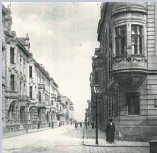
Ulice Sokolská v pohledu k severozápadu, foto, 1900–1918.