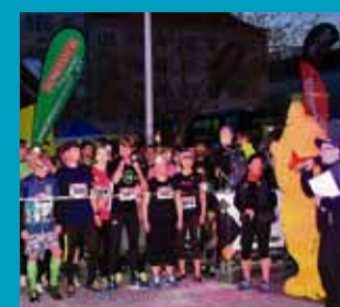
Night Run Ostrava