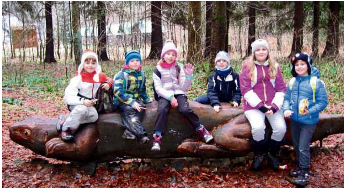
Žáci základních škol obvodu Moravská Ostrava a Přívoz ve Vernířovicích na Jesenicku.

Celkem 807 žáků ze sedmi základních škol obvodu Moravská Ostrava a Přívoz (ZŠ Gajdošova, Waldorfská ZŠ, ZŠ Gen. Píky, ZŠ Matiční, ZŠ Nádražní, ZŠ Ostrčilova a ZŠ Zelená) absolvovalo ozdravný pobyt v hotelu Reo Neo ve Vernířovicích na Jesenicku. Nedílnou součástí ozdravných pobytů, které byly zrealizovány v rámci programu Do přírody za zdravím I, bylo absolvování environmentálního programu, jehož cílem bylo zvýšit ekologické povědomí dětí a zlepšit jejich vztah k přírodě a krajině. Celkové náklady na projekt byly 3,179 milionu korun, z toho 2,525 milionu korun bylo hrazeno z dotace Státního fondu životního prostředí, městský obvod se podílel částkou 654 tisíc korun. „Koncem prosince 2015 si čistý horský vzduch užili žáci ZŠ Nádražní, dalších 547 žáků ze základních škol Ostrčilova, Zelená, Waldorfská a Gen. Píky absolvovalo