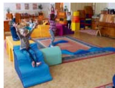
Mateřinky mají nové hrací prvky.

tělocvičen, pořízení horolezecké stěny nebo prvků na školní zahradu a dalších. V letošním roce si jednotlivé mateřské školy již pořídily například kout s horolezeckou stěnou, žebřinami a šplhadly, nejrůznější zahradní prvky - prohazovadlo, hrad, tělovýchovné vybavení -, letní lyže, minigolf, cvičební padáky, balanční pomůcky, dřevěnou skluzavku, cvičební kruhy, míče, boby, atletické sady pro děti, koloběžky, nebo z prostředků hradily pronájem tenisové haly, výuku plavání či lyžování. „Jelikož se podpora a rozvíjení pohybové aktivity dětí setkává s příznivým ohlasem jak ze strany ředitel mateřských škol, tak ze strany rodičů dětí, rozhodl se městský obvod