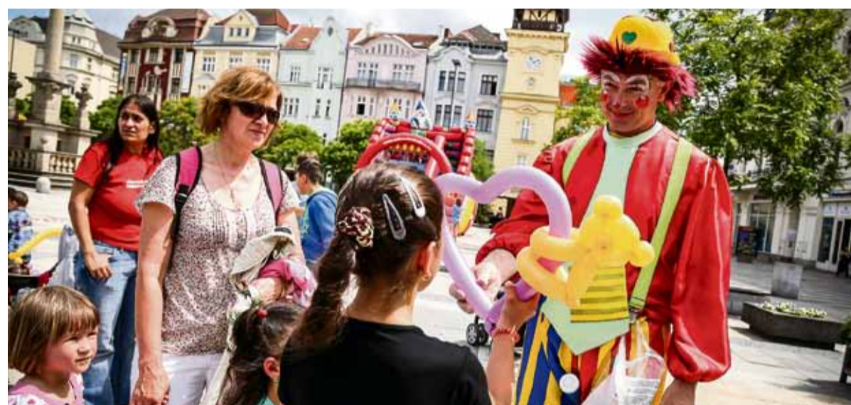
Stejně jako v loňském roce i letos pořádá centrální městský obvod oslavy Dne dětí. Více informací naleznete na titulní straně kulturní přílohy.