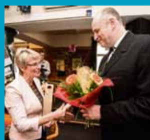
Setkání s řediteli