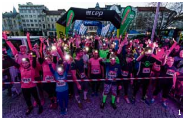
Třetí ročník Night Run Ostrava rozzářil nábreží Ostravice...