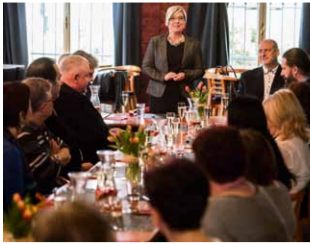
Tradiční setkání oživilo i vystoupení dětí z pěveckého sboru Dvořáček (foto vpravo).

Našli jste zatoulaného pejska, nebo naopak chcete pomoci zatoulané fence nebo pejskovi? Požádejte o bližší informace třebovický útulek pro psy prostřednictvím telefonního čísla 602 768 795 nebo e-mailem: útulek@ostrava.cz. Útulek je otevřen denně kromě pondělí od 10 do 17 hodin. www.utulekostrava.cz a na facebooku na https://www.facebook.com/utulekostrava.