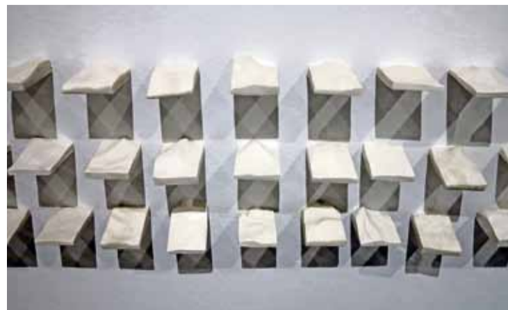
Výstava prací Iaina Pattersona potrvá v Domě umění do 20. března.