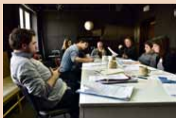
Herci Komorní scény Aréna při čtení zkušce.