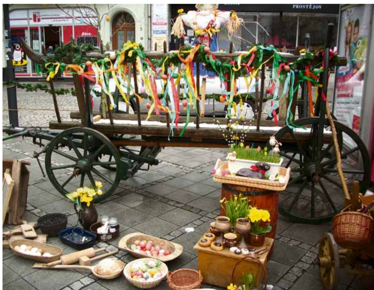
Užijte si pravou atmosféru lidových Velikonoc v centru města!

Do pašijového týdne – jednoho z nejvýznamnějších období křesťanského roku – návštěvníci na náměstí vstoupí branou ověšenou květinami. Velikonoce tu budou připomínat nejen dobové stojany s velikonočními symboly a informacemi o Veliko-