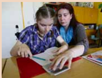
Všechny snímky Jindřicha Štreita zachycují nezměrnou práci rodičů, kteří se věnují svým postiženým dětem ve snaze maximálně zlepšit kvalitu jejich života.

Kolekci fotografií pořizoval Jindřich Štreit od loňského února do října ve spolupráci s Asociací rodičů dětí s dětskou mozkovou obrnou a přidruženými neurologickými onemocněními ČR. „Konečný výběr fotografií jsem dělal tak, abych potlačil informaci o handi-