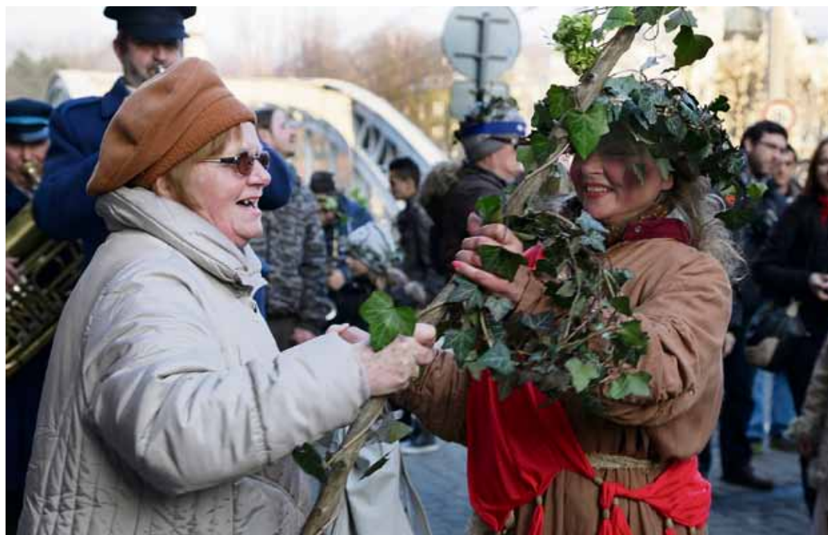
Průvod masek se vydává do ulic, aby do masopustního reje vtáhl kolemjdoucí.