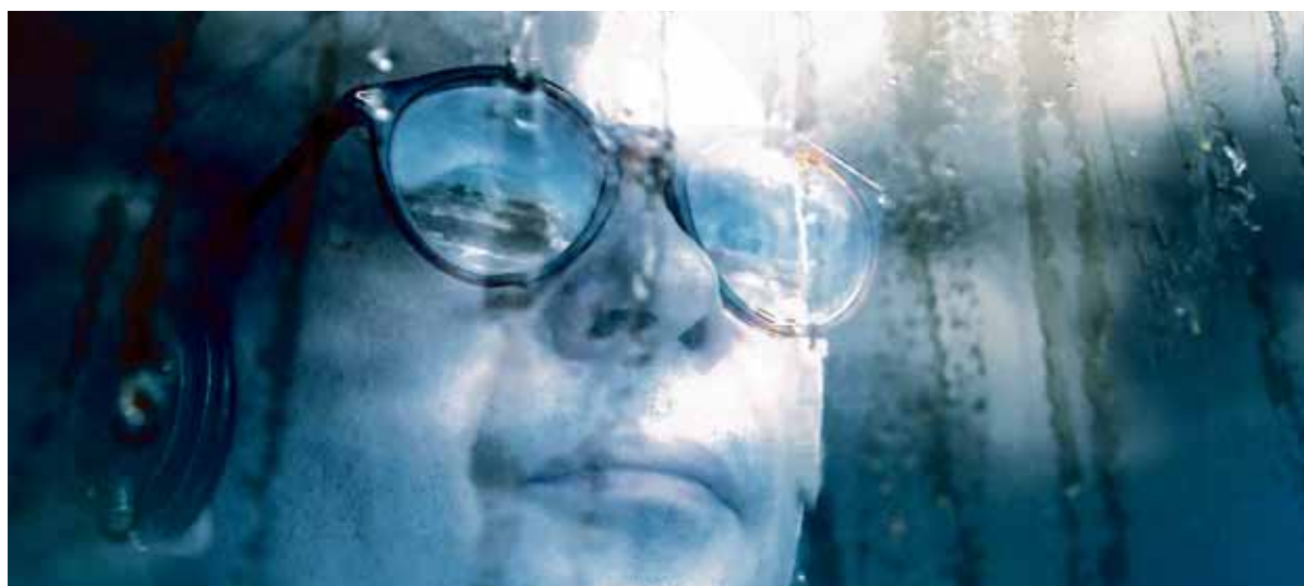
Slyšení mělo premiéru 28. února 2015.