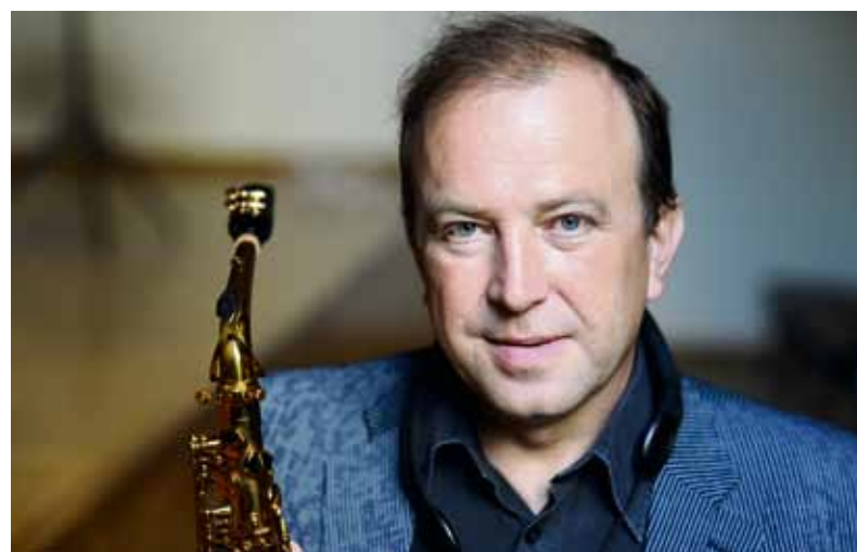
Philippe Portejoie je jedním z nejlepších saxofonistů své doby.

do 6. 3. Výstava k 65. výročí založení knihovny , historické dokumenty, dobové fotografie, knihovnické artefakty 24. 2. od 16 do 20 hod. Deskohraní aneb Kdo si hraje, nezlobí , odpoledne s deskovými hrami pro hráče od 10 let, oddělení speciálních fondů knihovny v levém křídle radnice na Prokešově nám. 7. Stálá nabídka: Výběr z více než 1,15 mil. titulů (on-line katalog), nabídka veškerých českých časopisů a periodik, výpůjčka audioknih, e-knih a e-čteček, speciální fond pro nevidomé a slabozraké, přístup do českých i zahraničních databází, informační a bibliografické služby, digitalizace regionálních knih, novin a časopisů.