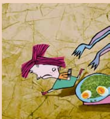
A toto je malá Mína...

Hru napsala a v divadle režíruje umělecká šéfkyně Divadla Petra Bezručová Janka