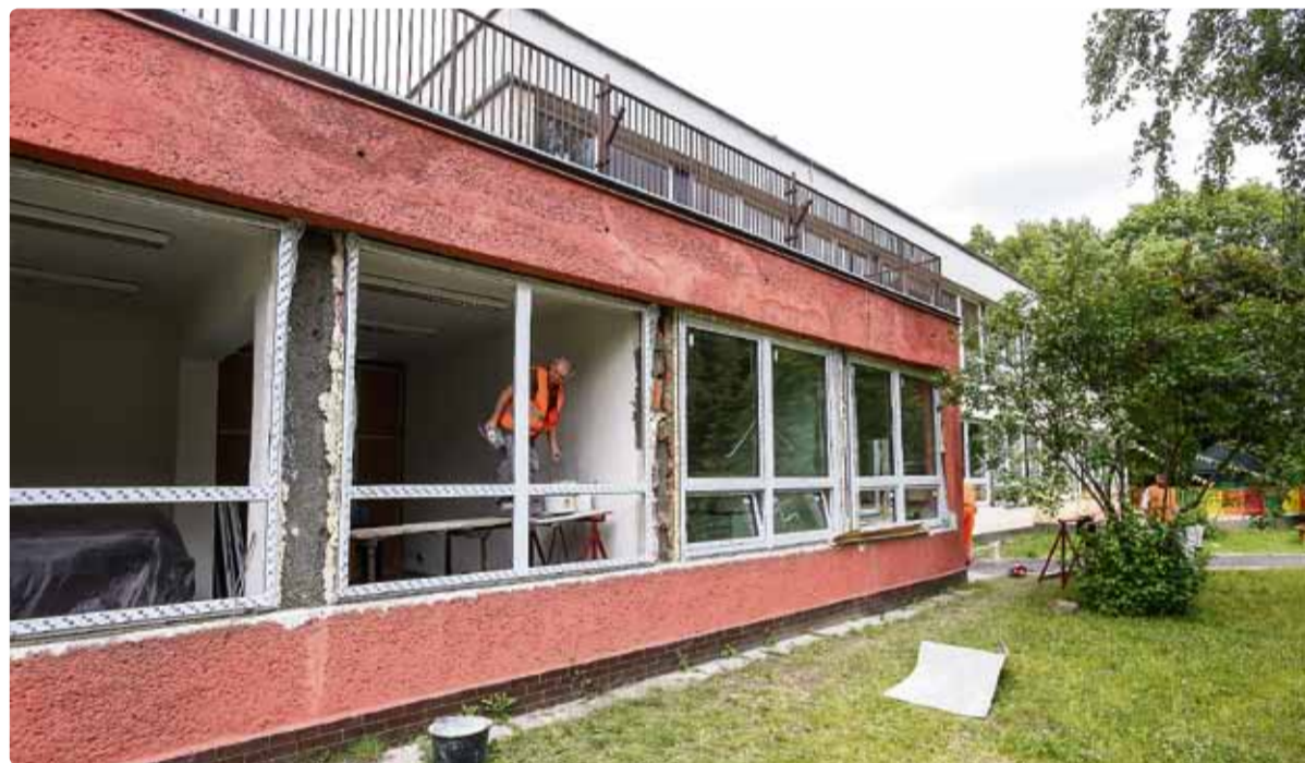
Rekonstrukce budovy Mateřské školy Na Jízdárně 19a už začala.

V létě budou na území obvodu probíhat investiční akce, které přispějí ke zkvalitnění života v centru města. „Červenec a srpen jsou nejnepohodnějším obdobím k rekonstrukcím školních budov. Ani letos tuto tradici neopomeneme,“ konstatuje místostarosta Dalibor Mouka s tím, že už v červnu bylo zahájeno zateplení budovy školy v Nádražní ulici, které provází i výměna oken a rekonstrukce střech pavilonů. „Tato akce v hodnotě 12,6 milionu korun přispěje ke zlepšení tepelně-technických vlastností a snížení nákladů na vytápění. Se stejným cílem realizujeme i zateplení dalších školních budov, například Mateřské školy Křížkova 18 a Základní a mateřské školy Ostrčilova 10,“ pokračuje Dalibor Mouka ve výčtu, jenž zahrnuje také zateplení obvodových a střešních