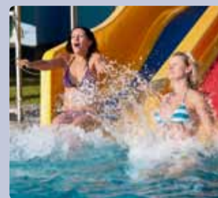
Aktivní léto v centru