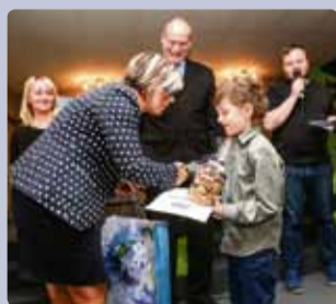
Ocenili jsme žáky i učitele