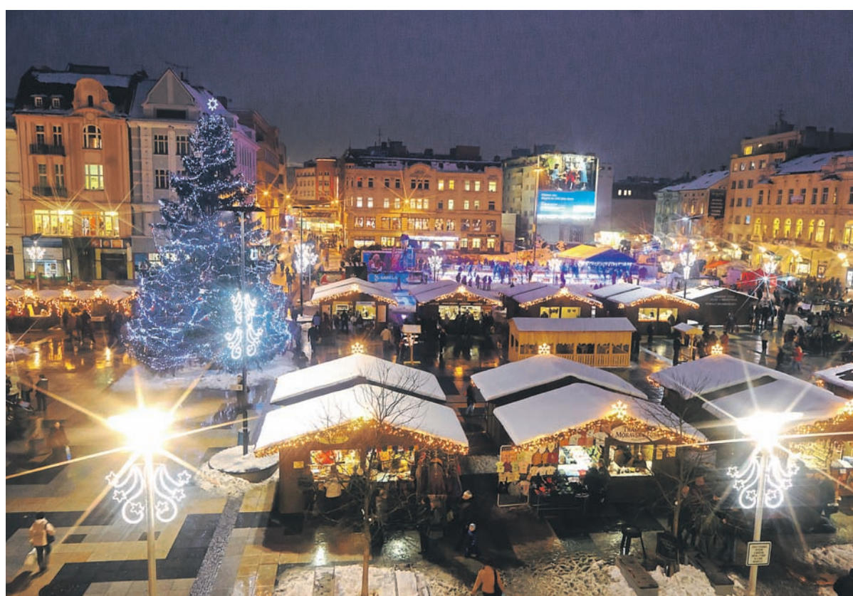
Každý, kdo na vánoční trhy zavítá, tady nalezne to své.

„Vánoční trhy budou mít program opravdu nabitý, každý si tu najde to své,“ zve Dalibor Mouka, místostarosta městského obvodu Moravská Ostrava a Přívoz. „Tradicí se už stalo soutěžní zdobení stromků dětmi z mateřských škol sídlících na území obvodu, které se bude konat v pondělí 2. prosince. Stromky budou po ukončení trhů věnovány dětským domovům a domům s pečovatelskou službou.“ Kulturní program bude v době trvání vánočních trhů, tedy od 1. do 23. prosince, opravdu rozmanitý. Vystoupí několik folklorních souborů a cimbálky, diváci se mohou těšit na vystoupení dětí