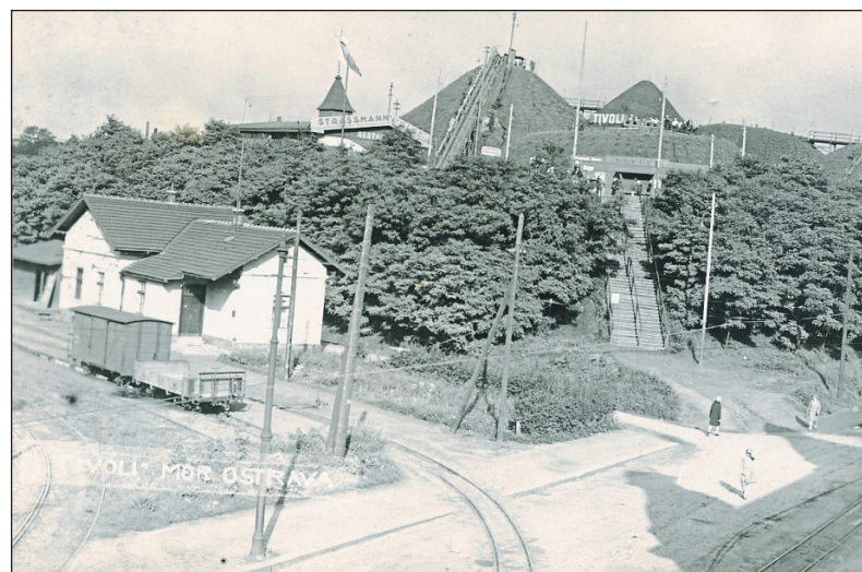
Na snímku z archivu Ostravského muzea je halda za divadlem, zábavní park Tivoli a koleje směřující do pivovaru.

Zdenka Rozbrojová, botanička Ostravského muzea