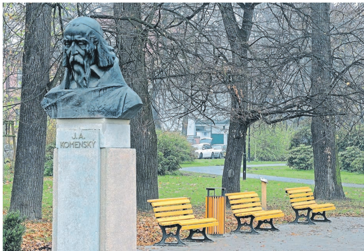
Díky modernizaci městského mobiliáře je v Komenského sadech 121 nových a 76 kusů repasovaných laviček, větší čistotě pomůže 50 nových odpadkových košů a 14 nádob na psí exkrementy.

které budou probíhat denně od 1. až do 23. prosince. „Program vánočních trhů už dlouho před jejich začátkem připravuje naše příspěvková organizace Centrum kultury a vzdělávání Moravská Ostrava a Přívoz. Tentokrát v úzké spolupráci s provozovatelem kluziště společností Sareza a nově i s obchodním domem Laso,“ dodává Mouka. A společně s vánočním stromem se rozzáří celkem 470 zvonků, hvězd, stromků, komet, vloček a další ozdob v ulicích centra Ostravy.