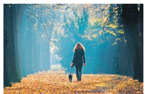
4. místo Podzim v Komenského sadech