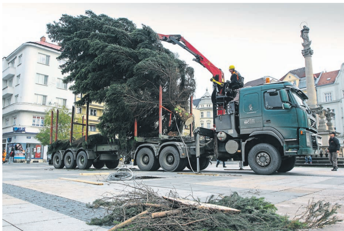
Dvanáctimetrový vánoční strom byl na Masarykovo náměstí přivezen z Dolní Moravice.

Rekonstrukce přednádražního prostoru je v konce. V současné době probíhá přejímání řízení a odstraňují se drobné nedodělky. K této významné investiční akci a jejímu hodnocení se vrátíme v lednovém čísle zpravodaje.