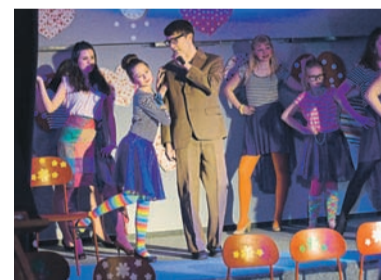
Muzikál rebelové nafotila Lenka Macurová.

Neváhejte a zajděte si zahrát stolní tenis jen tak pro radost i kvůli skvělému pocitu z vítězství! Městský svaz stolního tenisu Ostrava totiž v sobotu 7. prosince pořádá v areálu TJ Ostrava turnaj pro širokou veřejnost nazvaný Velká cena Ostravy. Zúčastnit se mohou neregistrovaní milovníci stolního tenisu, kteří budou hrát v samostatné kategorii rozdělené na muže, ženy, chlapce a dívky, i hráči registrovaní v sezonách 2012/2013 nebo 2013/2014 městské, okresní nebo regionální soutěže. Vítáno je také zapojení handicapovaných sportovců, kteří ocení bezbariérovost areálu. Startovní je zdarma, na vítěze čekají poháry a na ty nejlepší ve všech kategoriích věcné ceny.