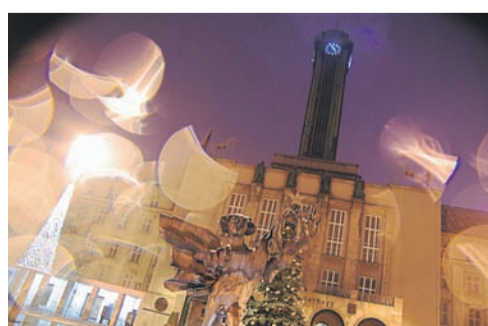
3. místo Ikarus v zimě