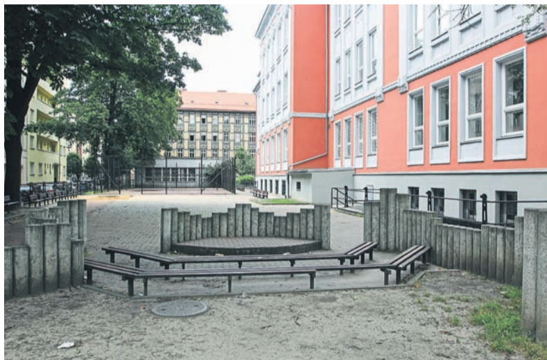
Původní stav dětského hřiště před rekonstrukcí.