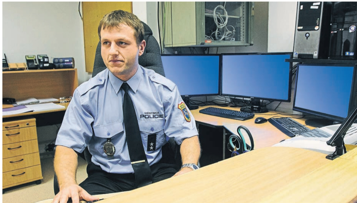
Rekonstruovaná služebna už slouží strážníkům městské policie