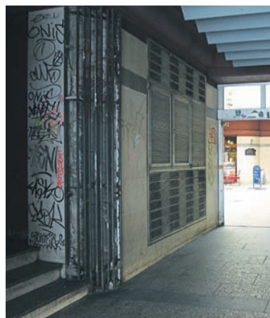
Tato podoba pasáže Vesmír již brzo bude minulostí.

Necelé tři měsíce bude trvat rekonstrukce pasáže Vesmír, jež byla zahájena 23. září a jejíž ukončení je naplánováno na polovinu prosince. Stavební úpravy průchodu,