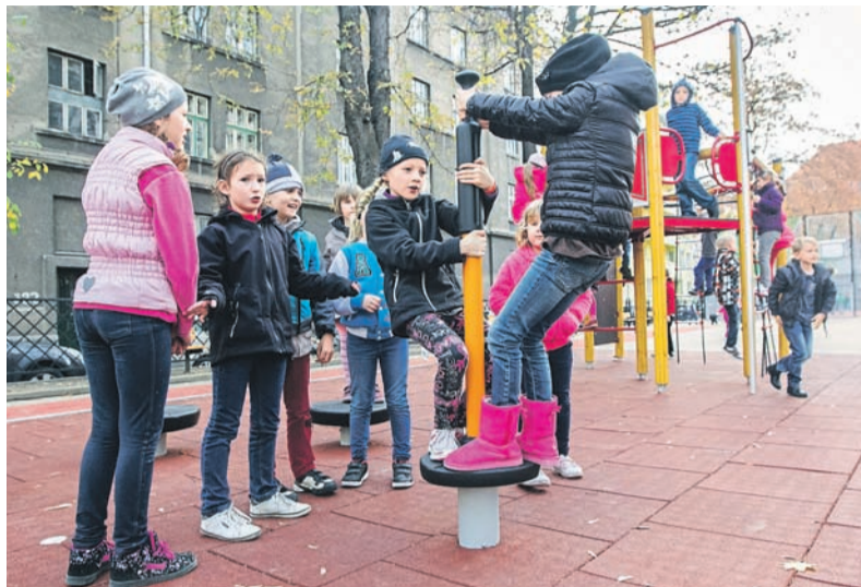
Školní oáza her a odpočinku uprostřed centra.

Žáci Základní školy Matiční 5 mají u školní budovy v ulici 30. dubna k dispozici nově rekonstruované hřiště. Z prostředků obvodu byla na tuto akci vyčleněna částka ve výši 3,5 milionu korun. „Nejde o klasické hřiště, ale o odpočinkový prostor, jehož hřiště pro míčové