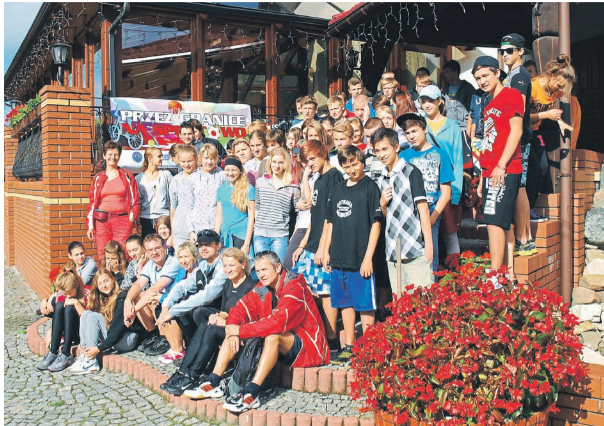
První turnus pobytů v polské Istebně v rámci projektu Přes hranice za sportem.