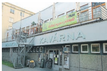
Minikino v říjnu představilo i vítěznou kolekci Ekofilmu 2013.

Minikino nabízí také promítání filmů pro mateřské a základní školy. Zatímco mateřinky se mohou těšit na pásmo animovaných a loutkových pohádek s oblíbenými hrdiny, pro žáky prvních až pátých tříd jsou připraveny například filmy představující filmové verze dětské literatury. Druhý stupeň základních škol a první a druhé ročníky středních škol mohou oslovit filmy čerpající ze světové literatury, dějepisu, občanské nauky a zeměpisu i filmy, které zrcadlí závažná společenská témata. Nabídka pro střední školy představuje film mimo jiné jako doplněk maturitních předmětů.