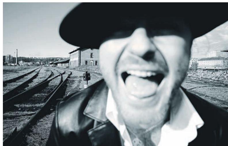
S Janáčkovou filharmonií vystupují mnozí věhlasní umělci. Jedním z nich je i Pavel Šporcl.