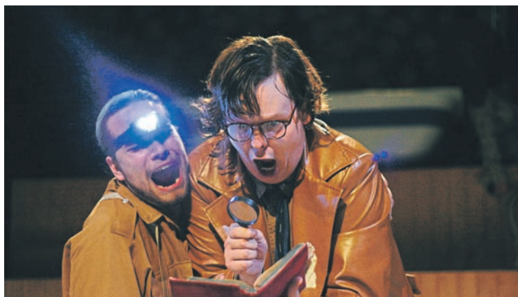
V pátek 29. listopadu se na festivalu představí Pěna dní, inscenace Divadla Petra Bezruče.

a Divadlo loutek Ostrava. Festival je určen výhradně divadelním pedagogům, kritikům a teoretikům, kulturním redaktorům, praktickým divadelníkům a studentům vysokých divadelních škol. Smyslem je účastníkům v několika dnech nabídnout reprezentativní průřez tvorbou ostravských profesionálních divadel za poslední rok. Loňského pětidenního festivalového maratonu OST-RA-VAR se zúčastnilo přes dvě stě divadelních odborníků a příznivců divadla.