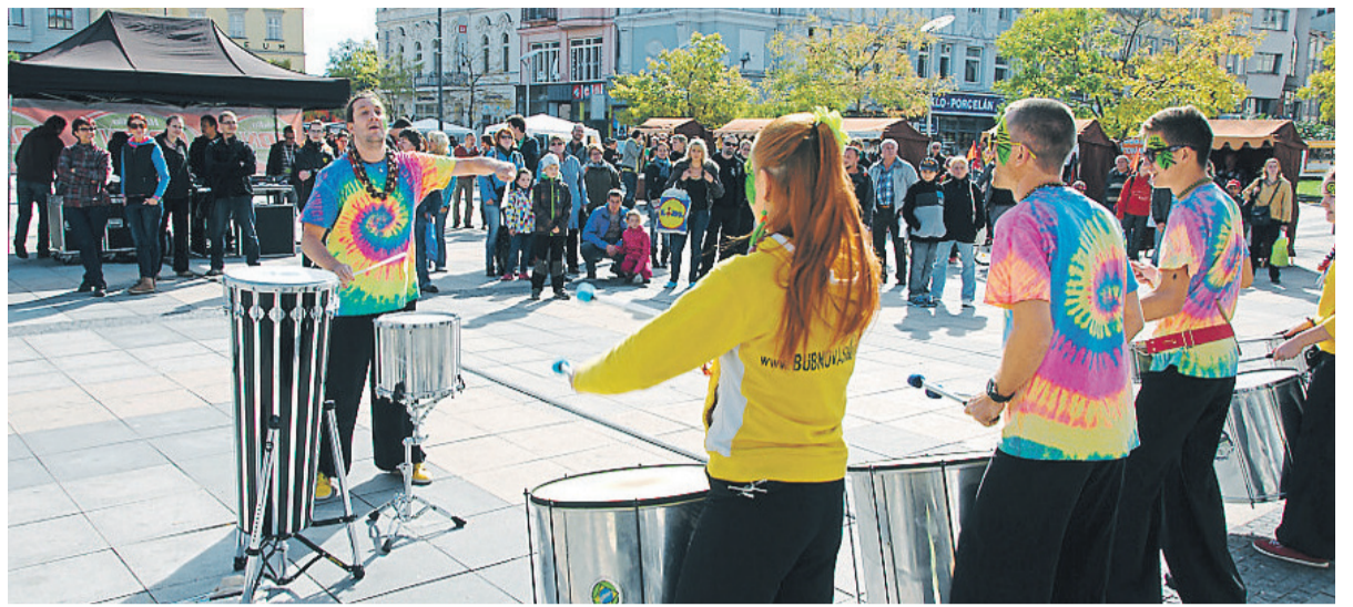
Obvod Moravská Ostrava a Přívoz patřil k těm, kteří Ekofilm 2013 podpořili.