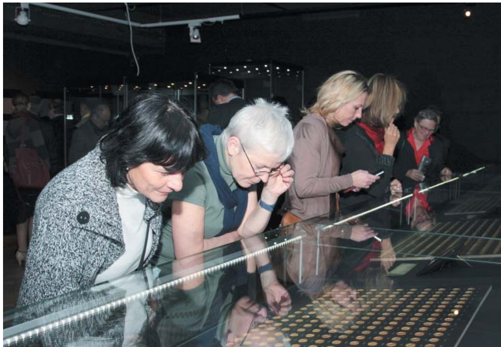
Návštěvníci si prohlíží mince z Košického pokladu.

Košický zlatý poklad byl objeven v budově bývalé Spišské komory, a tak předpokládáme, že jeho majitel byl úzce spjat s touto institucí.