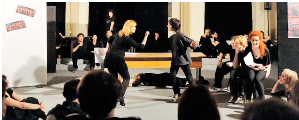
Přípravy muzikálu Fantom Londýna jsou v plném proudu.

Série scénických čtení zahájila přípravy na světovou premiéru autorského muzikálu Fantom Londýna.