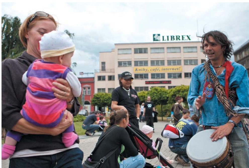
Stejně jako loni i letos bude Festival v ulicích bavit návštěvníky zdarma.

Z dalšího atraktivního programu se pak návštěvníci mohou těšit na pouliční divadlo a Nový cirkus V.O.S.A. Theatre s představením ONI a Vanař, Long Vehicle Circus, vystoupení tanečních mistrů a studentů Janáčkovy konzervatoře, biketrialovou exhibici