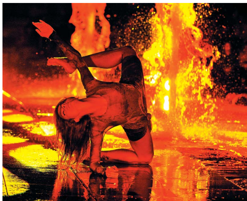
Minulý rok se akce Jdeme za vámi konala na Masarykově náměstí.