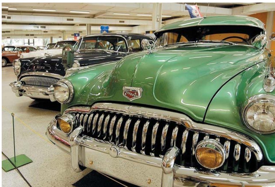
Kdo má rád krásné vozy, nesmí na výstavě chybět.