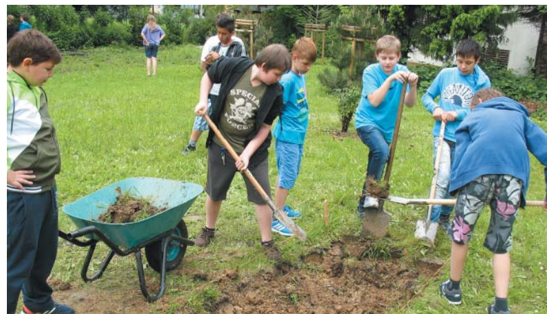
Žáci se chopili nářadí a pustili se do práce.