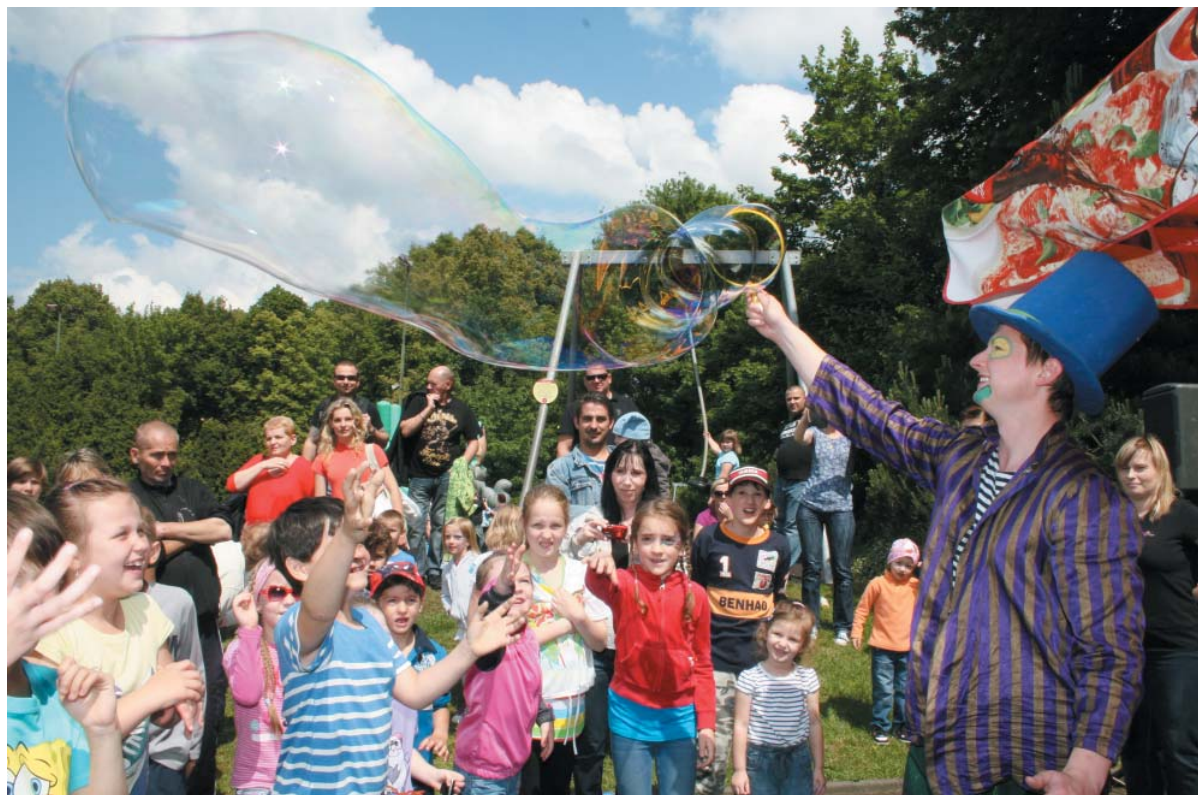
V Dětském ráji na Sadové se konal 2. června Dětský den s „Cirkusem trochu jinak“. Děti bavila bublinová show, klauni na chůdách, nafukovací hrad, malování na obličej či kreativní dílny a spousta her a zábavy. Počasí se vydařilo, na akci dorazily stovky návštěvníků. Akci uspořádal městský obvod spolu s provozovateli areálu.