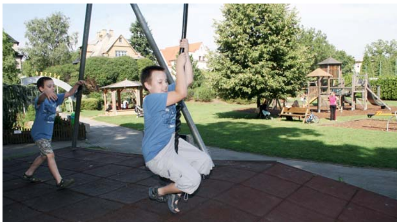
Starším dětem se v areálu líbí lanovka.