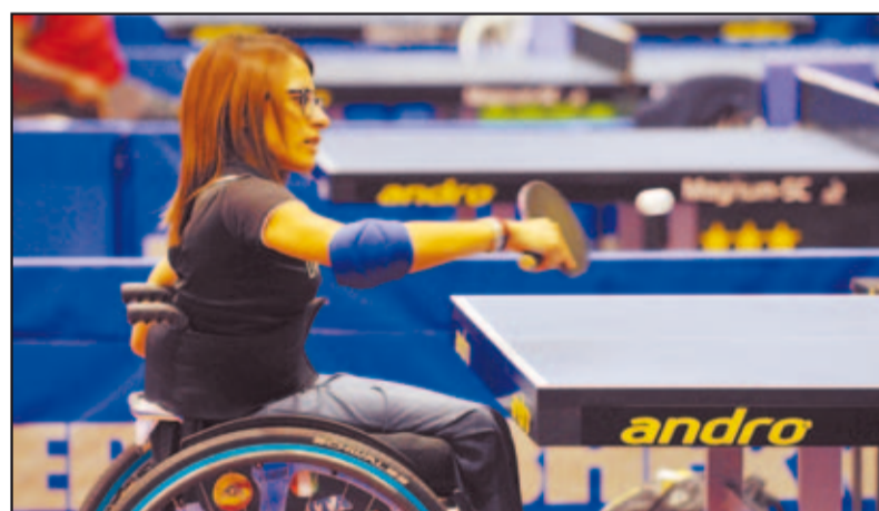
I přes zdravotní handicap dokážou mnozí mladí lidé podávat skvělé sportovní výkony.

Terénní práce je realizována z finančních prostředků státního rozpočtu České republiky, určených na realizaci programu Podpora terénní práce 2011, poskytovaného Úřadem vlády ČR. (red)