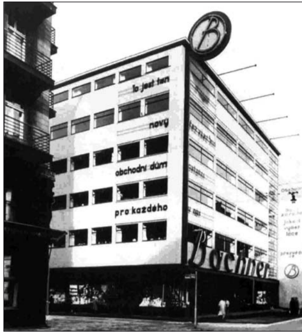
Obchodní dům Bachner - 1936