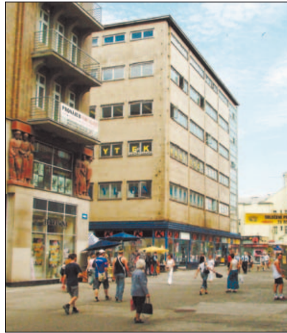
Obchodní dům Horník - 2011

Obchodní dům má ocelový skelet, který dodaly Vítkovické železárny, mezerby byly vyzděny a venkovní stěny mají keramické obložení. V současné době budova zoufale vyžaduje rekonstrukci, nehledě na to, že si ji plně zaslouží. Obchodní dům Bachner patří k nejvýznamnějším architektonickým památkám Ostravy i naší republiky.